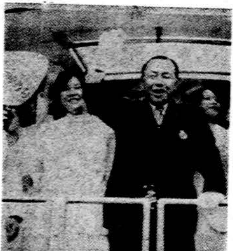
Japonijos premjeras Kakuei Tanaka, dabar lankas Ameriką, ir jo žmona.

Panaši viršūnių konferencija ten pat buvo ir pernai, ir 1971 metais. WASHINGTONAS. — Japonijos ministeris pirmininkas Kakuei Tanaka vakar jau buvo Baltuosiuose rūmuose ir pradėjo dviejų dienų pasikalbėjimus su prez. Nixonu.