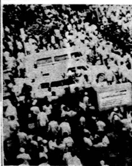
Tripolis išleisdžia automobilių, autobusų ir sunkvežimiu ka ravana, kad reikalautų nedelsiant Libijos ir Egipto susivienijimo. Kaip žinome, Kairas jų neįsileido, užblokavo kelius. Dešinėj Muammar Kaddafi, kitų laikomas pavojingiausiu pasaulio žmogumi.

HOUSTONAS. — Erdvių laboratorijos įgula ir vakar ne kaip jautėsi, tai jų numatytas "pasivaikščiavimas" erdvėje vėl atidėtas vienai ar dviem dienoms. Juos susargdino judėjimas, kamuoją jūros liga.