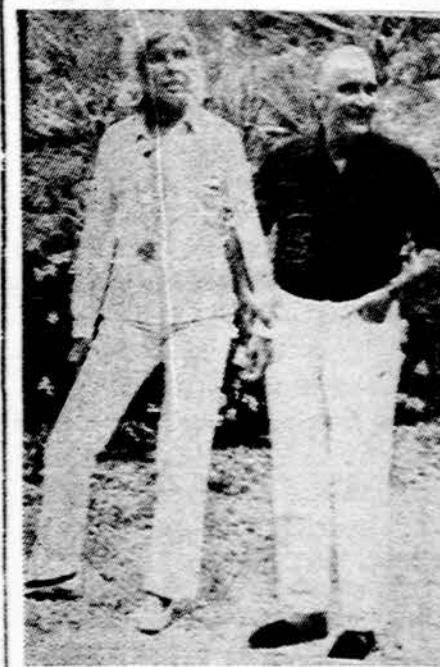
Prancūzijos prez. Pompidou su savo žmona.

Kadangi Vakarų saugumas rėmėsi JAV pažadu reikale juos ginti ir atominiiais ginklais, ilgainiui vakariečiai įsitikino, kad JAV niekada nerizikuos atominiu karu, kuris gali sunaikinti pačias JAV „noring V. Europą gelbėti nuo rusų įsiveržimo. Visa tai paskatino vakariečius ieškoti susipratimo su Sovietų Sąjungą. W. Brandt tapus Vak. Vokietijos kancleriu, ta kryptimi pasitūmėta tiek, kad su ja buvo pasirašyta sutartis, pripažįstanti Sovietų užgrobtimus viutuot Europoje, o kiek vėliau ir su Lenkija, pripažįstantia da-