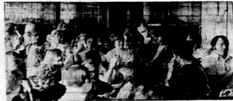
Dalis akademikų skautų-čių savo suvažiavimo metu Christian Lodge, Mich.