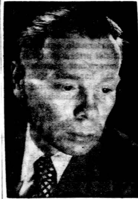
A. a. J. Aistis

Norėtume šią progą vadinti Vakarų su Jonu Aisčiu. Kai susirenkame paminėti poeto, rašytojo, menininko ar muziko gyvenimą ir darbus, man vis kyla įkyrus klausimas, kodėl tie vakarai yra apie juos, bet ne su jais. Kodėl gyvenę tylų, dažnai visų užmirštą gyvenimą, jie tampa herojais jų balsu nutylius? Kodėl? Kodėl plojimai, ovacijos palydi jų darbus, kai ausys nebegirdi ir širdies nebeguodžia... Ir tuos klausimus besvarstant teko prieiti išvados, kad mes riboto išsireiškimo žmonės, gyvų poetų varžomės. Kaip reikia reaguoti į jų gyvą balsą? Mandagiai nuploti, pasakyti, kad buvo gražu... Žodis tartas toks trapus, bet savo poeziją skaitęs poetas atveria savo širdį, savo dvasią ir tas nuogas atvirumas mus varžo, nes ne tik nuo kitų, bet ir nuo savęs mes dažnai slepiam tai, ką poetas scenoje drąsiai deklamuoja. Lengviau mums minėti poeto gyvenimą, jo gijai nutrukus, nes nereikia derinti mūsų reakcijos su jo intensyviu jausmu... Gal tai ir yra pagrindas to vienišumo, to sunkaus poeto kryžiaus, apie kurį Aistis skaitė prieš keletą metų šioj pačioj stovykloj.