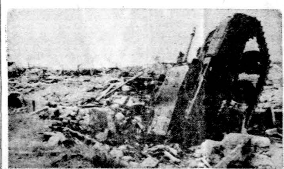
Pietų Vietnamo šiaurėj, kur vyko didžiausi mišiai, Quang Tri miestas atrodo kaip griuvėsių laukas

Tas, kuris už visa tai turės prisiimti atsakomybę šiais metais, vadmas! Dimitri Polijanski, politbiuro narys. Vasario mėnesį jis iš premjero pavaduotojo posto buvo perkeltas ir padarytas žemės ūkio ministru.