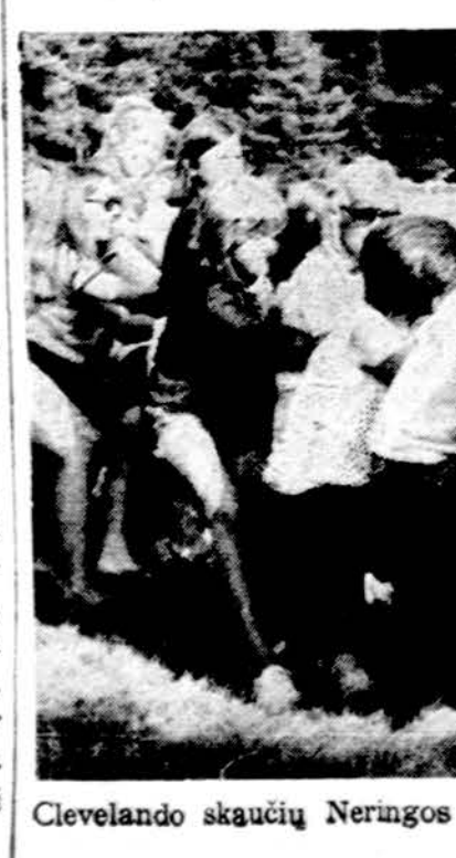
Clevelando skautų Neringos tunto skautės traukia virvę prieš vyrų skautų Pilenus. Mergaitės laimėjo.