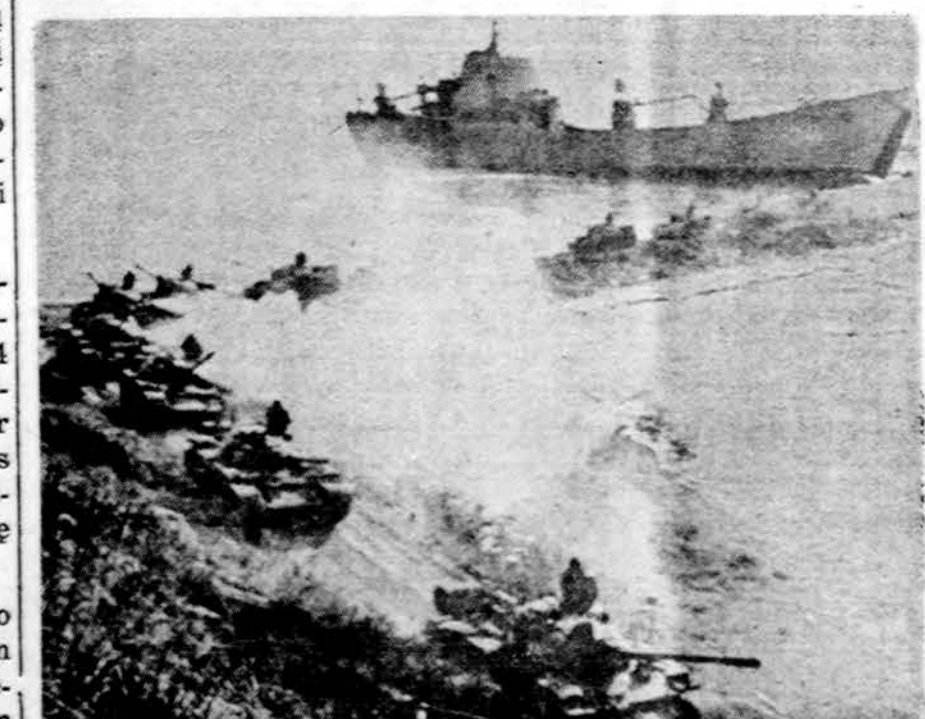
Sovietų tankai iškraunami Persų įlankoje, Irake

KEY WEST, Fla. — Namuose darytu mažu laivėliu po keturių dienų kelionės ir Floridą atvyko 10 kubiečių pabėgėlių.