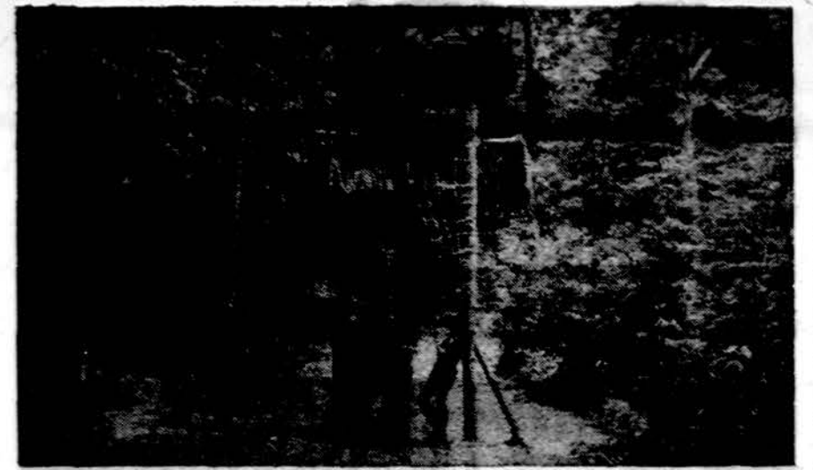
Cia mūsų stovykla — mūsų "Ziežirba"! Stovykliniai vartai Kernavės stovykloje.

pasiminti skrynių vad. "trunks". Iš stovyklos į Chicago grįžtame trečiadienį, rugpjūčio 29 d. Prie Jaun. centro būsimame tarp 8-9 val.