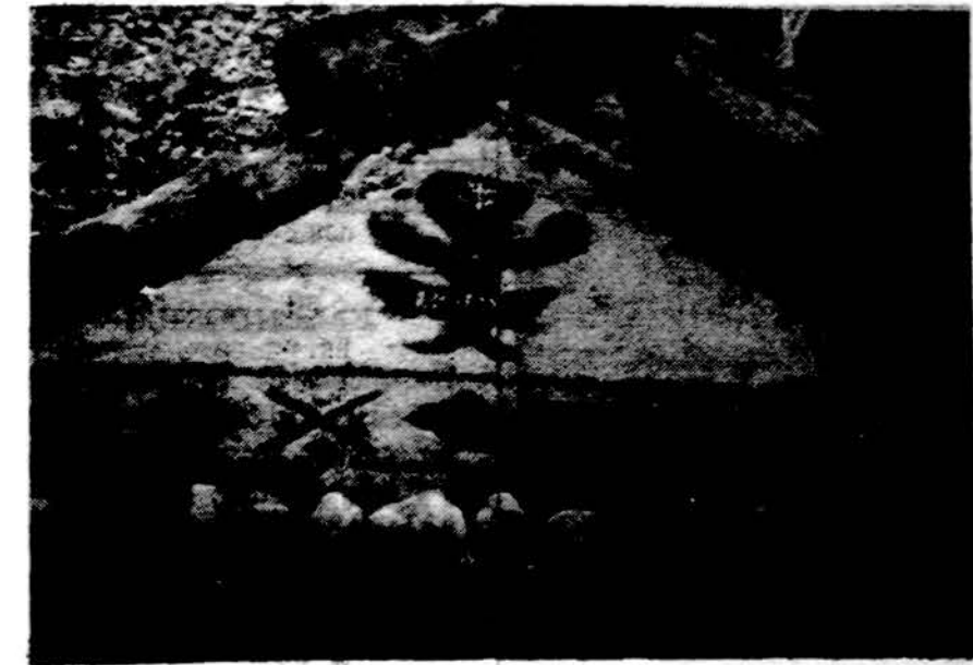
"Pelenės" Kernavės tunto "Ziežirbos" stovykloje patraukė lankytojų dėmesį savo kruopščiai atliktais papuošimais.

Šie ir kiti darbai bus pakartojami pagal pageidavimą ir sesių susidomėjimą.