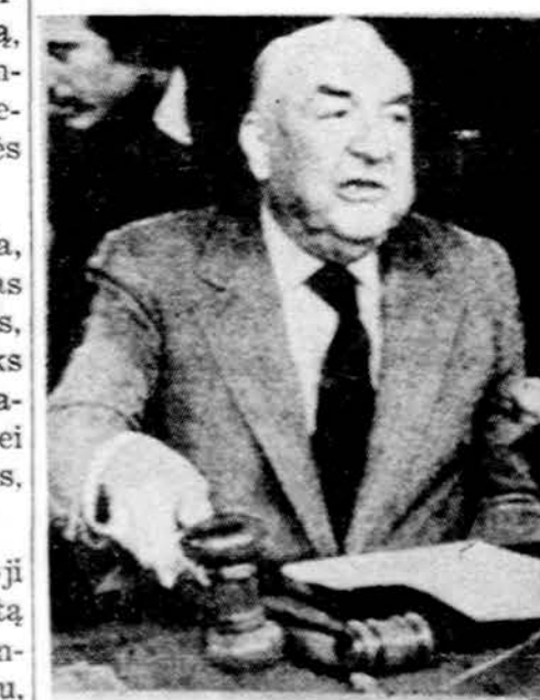
Sen. Sam Ervin, Watergate komiteto pirmininkas.

Dalnai saulėta, karšta ir drėgna, 40% galimybė lietaus su perkūnija, apie 90 laipsnių.