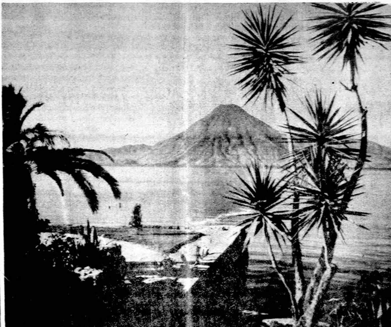
Guatemala, Vid. Amerika. Atitlan ežeras, apštas vulkaninės kilmės kalnais, laikomas vienas gražiausių pasaulio.

NEW YORK. — New Yorko valstijos gubernatorius Nelson Rockefelleris kitais metais nežada kandidatuoti tam pačiam postui.