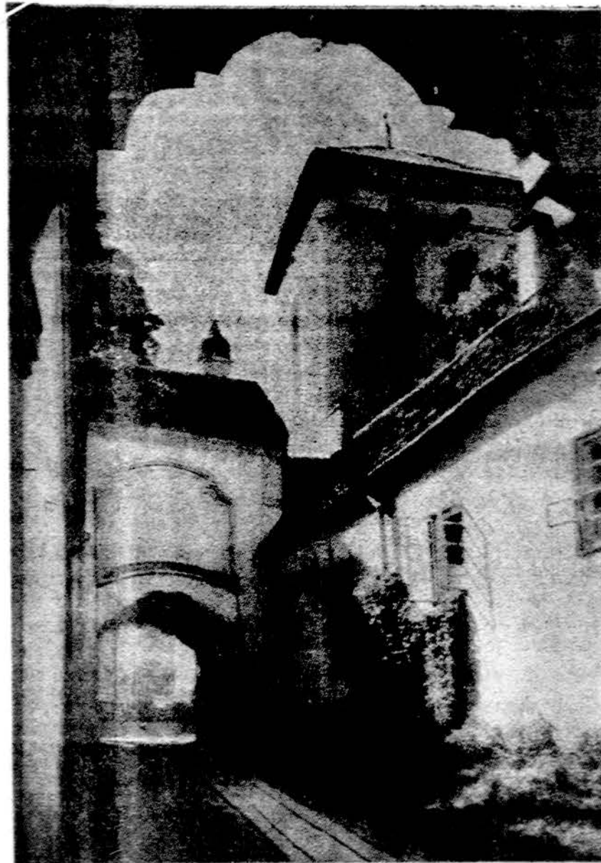
Vilniui — sostinei 650 metų

Liublijana. — Šiais metais Slovenijoje buvo išventinti 59 nauji kumigai. Tai yra rekordinis skaičius, atsižvelgiant taip pat į faktą, jog Slovenijoje yra tik pusantro milijono katalikų.