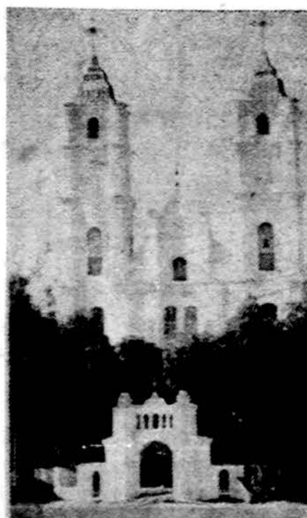
Agiuona, Daugpilio apskr., Latvijoje, netoli Lietuvos sienos. Šioje parapijoje carų laikais radosu prieglauda daugelis lietuvių kunigų, grįžę iš ištremimo ir negalėję įsikurti Lietuvoje.

Tanzanija. — Tanzanijos vyskupo konferencija, Afrikoje, specialiu atsisveikimu kreipėsi į viso pasaulio geros valios žmones, prašydama, kad būtų užbaigtos tarpusavio žudynės kaimyninėje Burundi respublikoje.