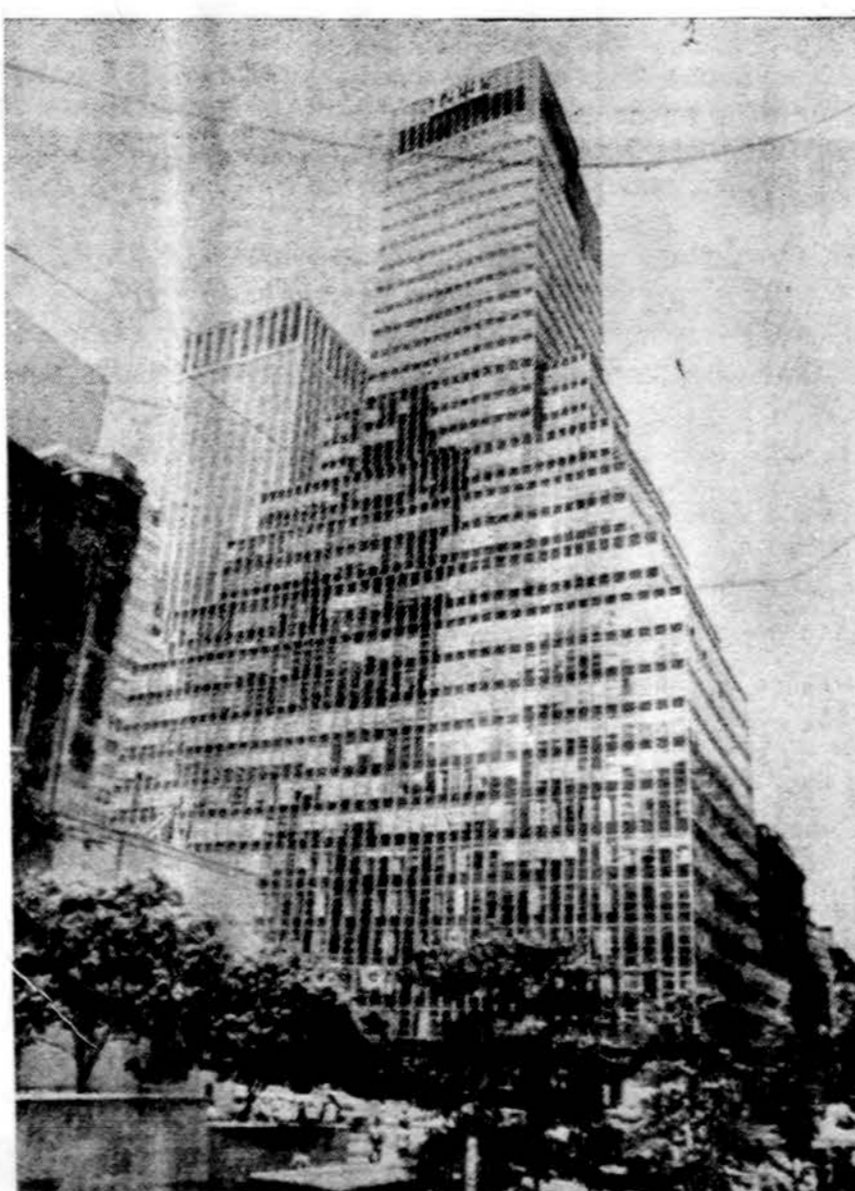
Didžiausios pasaulyje Tarptautinės telefonų - telegrafų bendrovės (ITT) centriniai rūmai New Yorke. Si milžiniška korporacija, be kitų atliktų darbų buvo įruošusi ir taip vadinamą „karštąjį“ telefono laidą tarp Washingtono ir Maskvos

SANTIAGO. — Čilės streikuojantieji šoferiai nepaklausė Al-lende ultimatumo ir į darbą nesugrįžo. Dabar maistą ir gazoliną vežioja kariuomenė. Nuo liepos 26 streikuoja 50,000 sunkvežimių vairuotojų, ir jie nebeįraštinami, kad jei negrįš darban, susilauks tam tikrų bausmių.