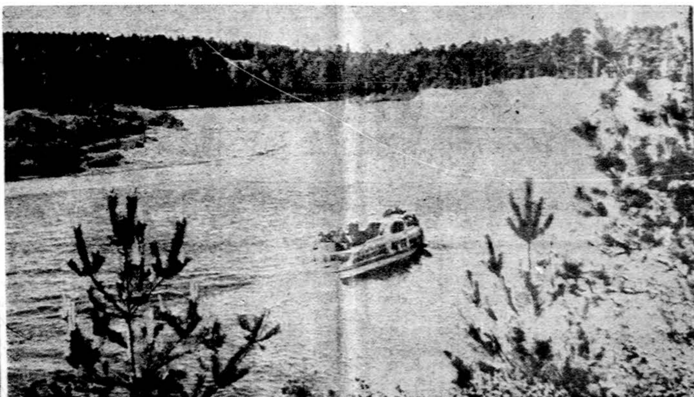
Nemunas ties Druskininkais

PORTO ALEGRE, Brazilija. — Pietinėje Brazilijoje buvo pastebėti radiacijos pėdsakai, dulkelės atneštos iš prancūzų atominių sprogdimų Mururoa salyne. Pėdsakai labai menki ir visiškai nežalingi.