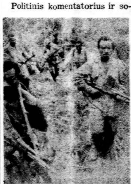
Partizanai Angoloje kovoja prieš Portugalijos kolonijinį režimą.