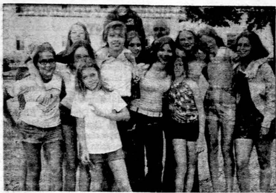
Sunkiausia atsiveikinti ir drauge išleisti iš mergaičių stovyklos...