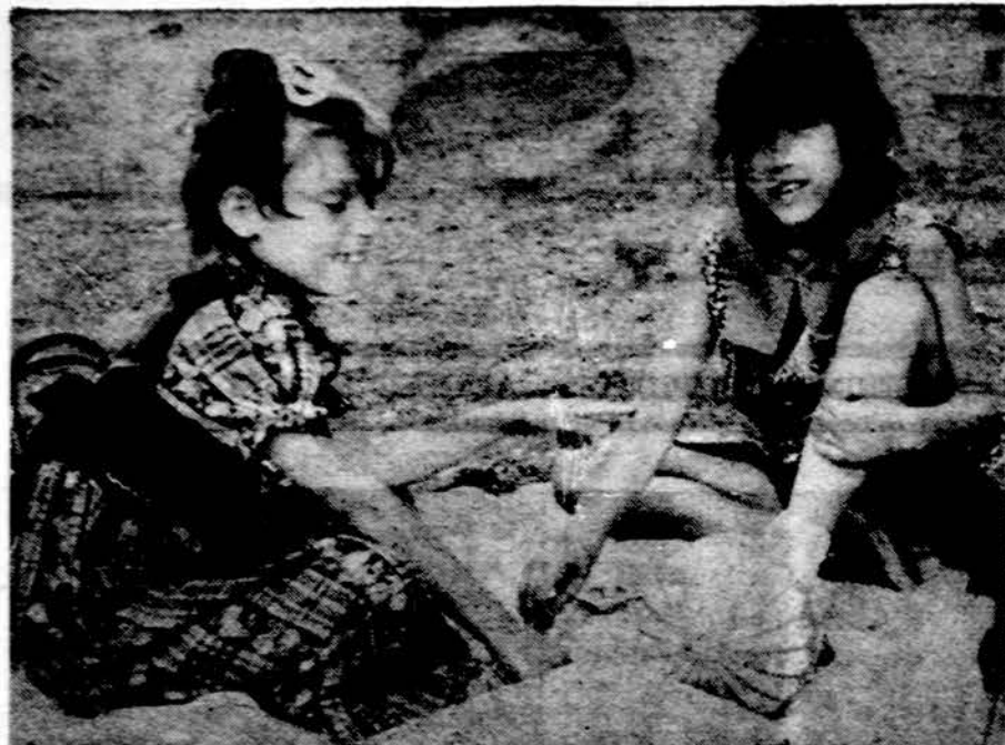
Štai kelias ir gyvenimas — didžiausias narkomanijos priešas. Visur ir visada juo eikime ir savo vaikus mus sekti savais elgesiais įpratinkime. Eikime visi tų mergelių rodomu keliu.

Mes kalbame apie heroinui, tabakui, apkalboms adiktus. Mes siūlome jiems įvairiausių vaistų. Visi iki šiol pasiūlytieji metodai, visos vartotos priemonės žmogui nežmoniška — jausmais nesutapėjusį sužmoginti — jo elgesį jam pačiam ir kitam priimtina padaryti, nuėjo niekais. Ir toliau taip bus, nors žmonija ir milijonus metų gyvens, jei mes šiandien nepradėsime ryžtis savyje žmogų išugdyti ir tame ryžte neįstėsime. Visi iki šiol daug laiko ir energijos išleidžiame antra-