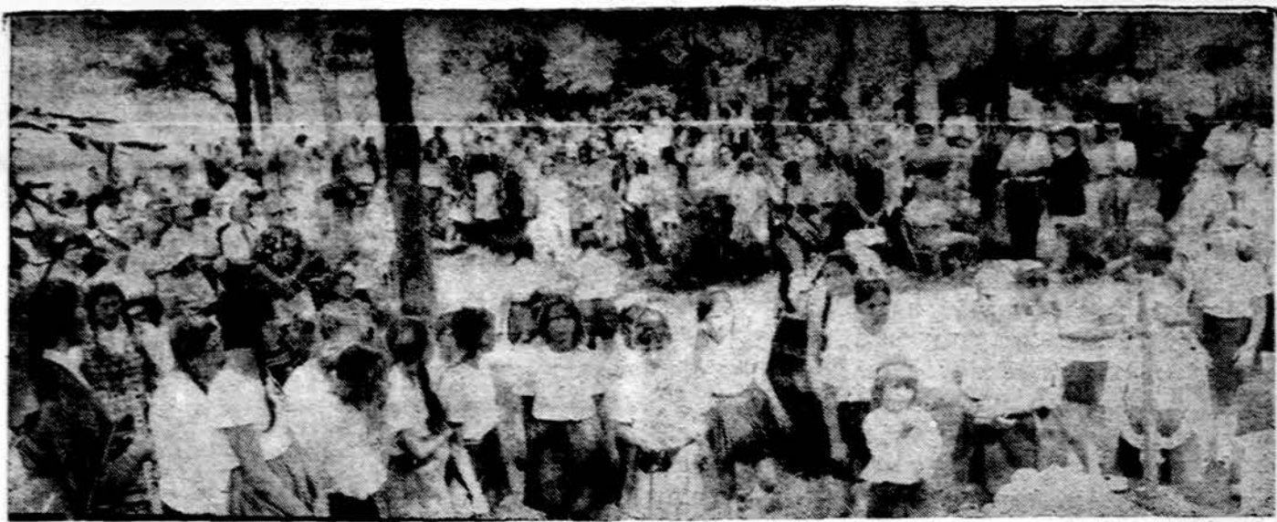
Mergaitės ir svečiai pamaldų metu mergaičių stovykloje Dainavoje.

× Lietuvių Klubui St. Petersburgo reikalingas sargas švarai palaikyti klube ir kieme. Duodamas veltui butas iš dviejų kambarių su vonia, kuru, šviessa ir vėsinimu. Kreiptis: American Lithuanian Club, Inc. 4880-46th Avenue North, St. Petersburg, Florida 33714 (sk.)