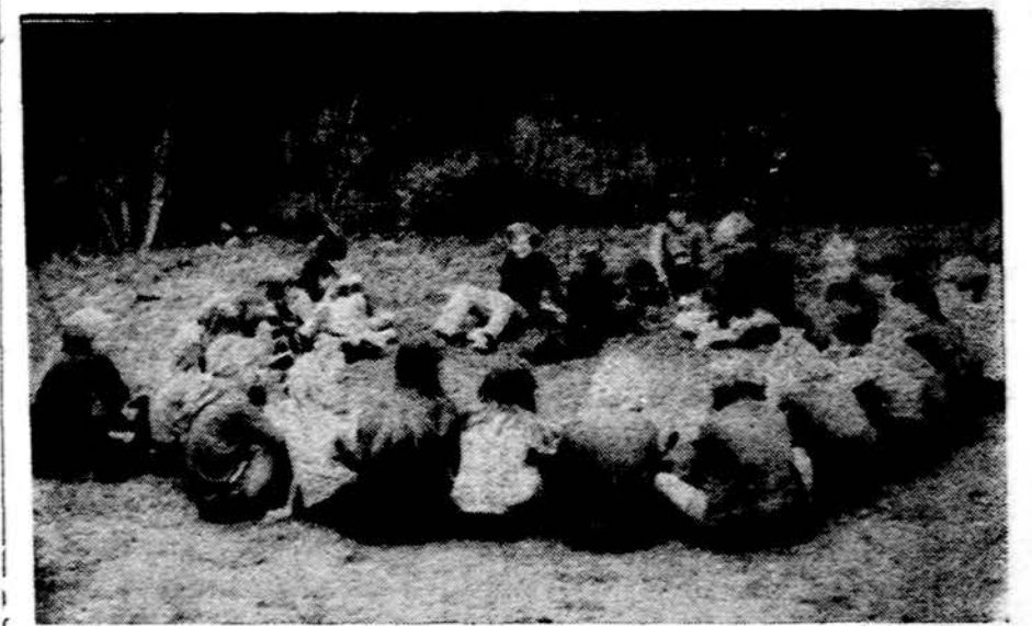
Vaikų stovykloje "Vilnius" netoli Sao Paulo, Brazilijoje. Vaikai mokosi lietuviškų dainų. Dalyvavo 33.