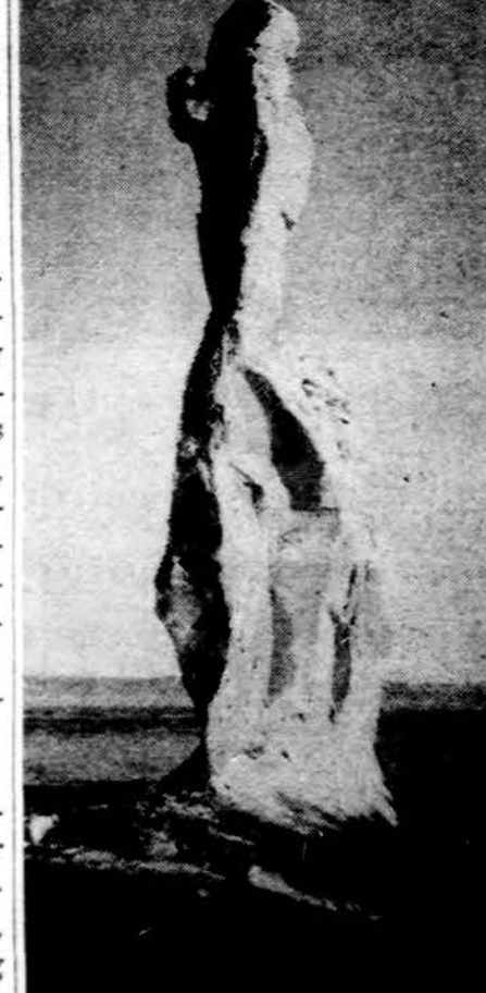
Ne žmogaus, bet gamtos sukurtas paminklas. Utah valstijoje.

Lusaka. — Keturiadesimt penki procentai Zambijos universiteto studentų yra katalikai; 44 procentai priklauso kitoms krikščioniškomis konfesijoms ir tik 7 proc. yra indu-musulmonai.