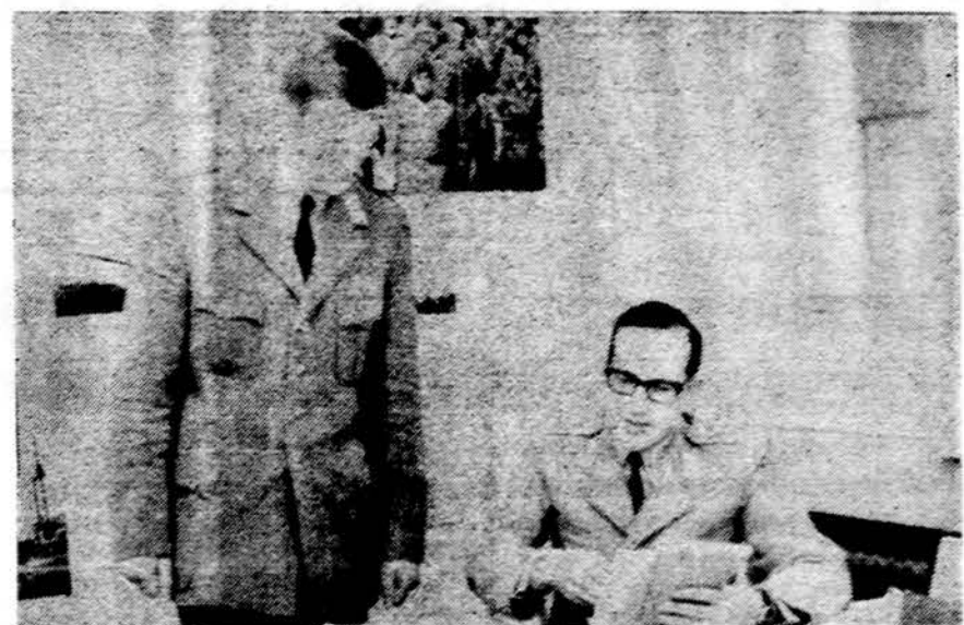
Vak. Vokietijos vieno karinio dalinio vadas ir jo adjutantas

timi. Važiudami išsinešėjom, kodėl nėra autobuso į Pušalotą. — Kad jis ir vakar sugedo. Ir užvakar... Dažnai genda — piktinosi bendrakeleivės iš Bernatonių. — Čia ne autobusai kalti, — įsiterpė į pokalbį taksistas. — Autoparkui vairuotojų stanga. Taip ir liko neaišku, kodėl taip dažnai neišvyksta autobusai iš Panevėžio grafikuose nurodytu laiku. O gal pakeistas autobusų eismo tvarkaraštis? Ir šitaip gali būti, bet keleiviai apie tai turėtų būti informuojami iš anksto. Panevėžio autobusų stotis labai mėgsta "staig menas". Norėtųsi žinoti ir tikrasias priežastis.