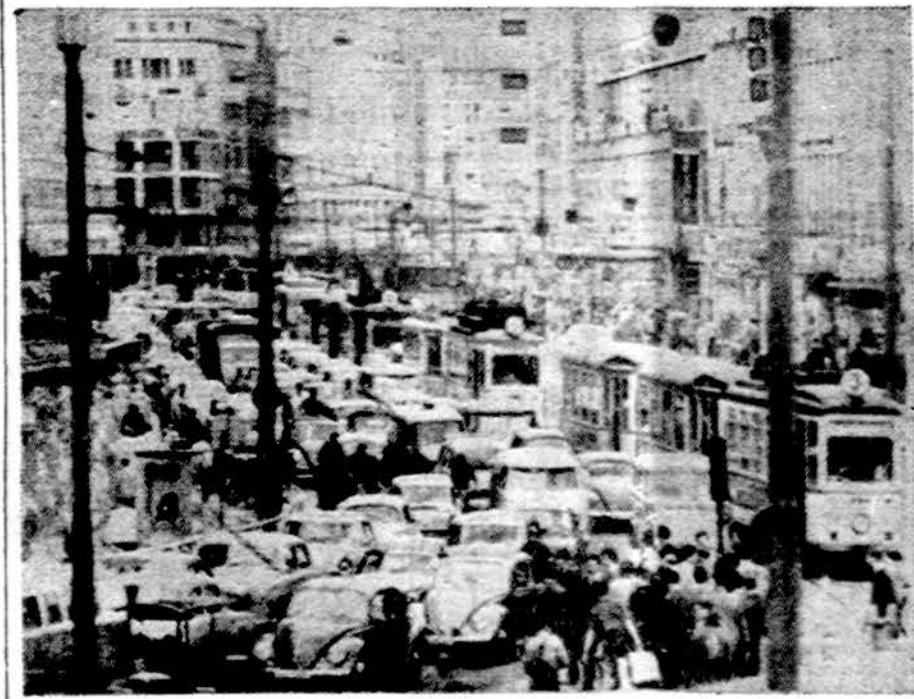
Frankfurtas, V. Vokietijoje. Automobilų susikimimas buvo nepakeliamas ir miesto valdyba buvo priversta uždrausti važiuoti automobiliams. Dabar miestas pasidarė daug malonesnis.

NEW YORK. — Jungtinių Tautų Saugumo Taryba visais balsais pasmerkė Izraelį už Libano lėktuvo nukreipimą į savo aerodromą. Sovietai ir Kinija buvo nepatenkintos, kad rezoliucija nebuvo pakankamai griežta. Rezoliucija buvusi Libano laimėjimas. Prieš balsavimą Libanas kreipėsi į savo draugus, ST narius, kad jie sušvelnintu savo siūlymą, kitaip Amerikai pavartos veto ir nebus priimta ir tokia rezoliucija.