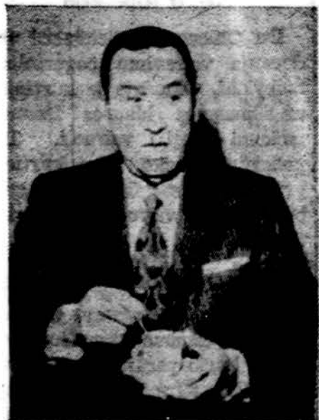
Juan Domingo Peronas, kuris netrukus bus išrinktas Argentinos prezidentu