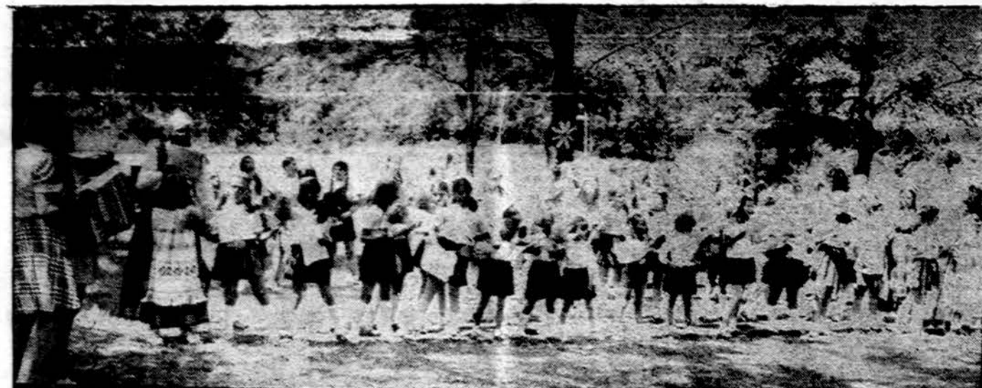
Jaunesniosios mergaitės savo stovykloje rengiasi pasirodymui.