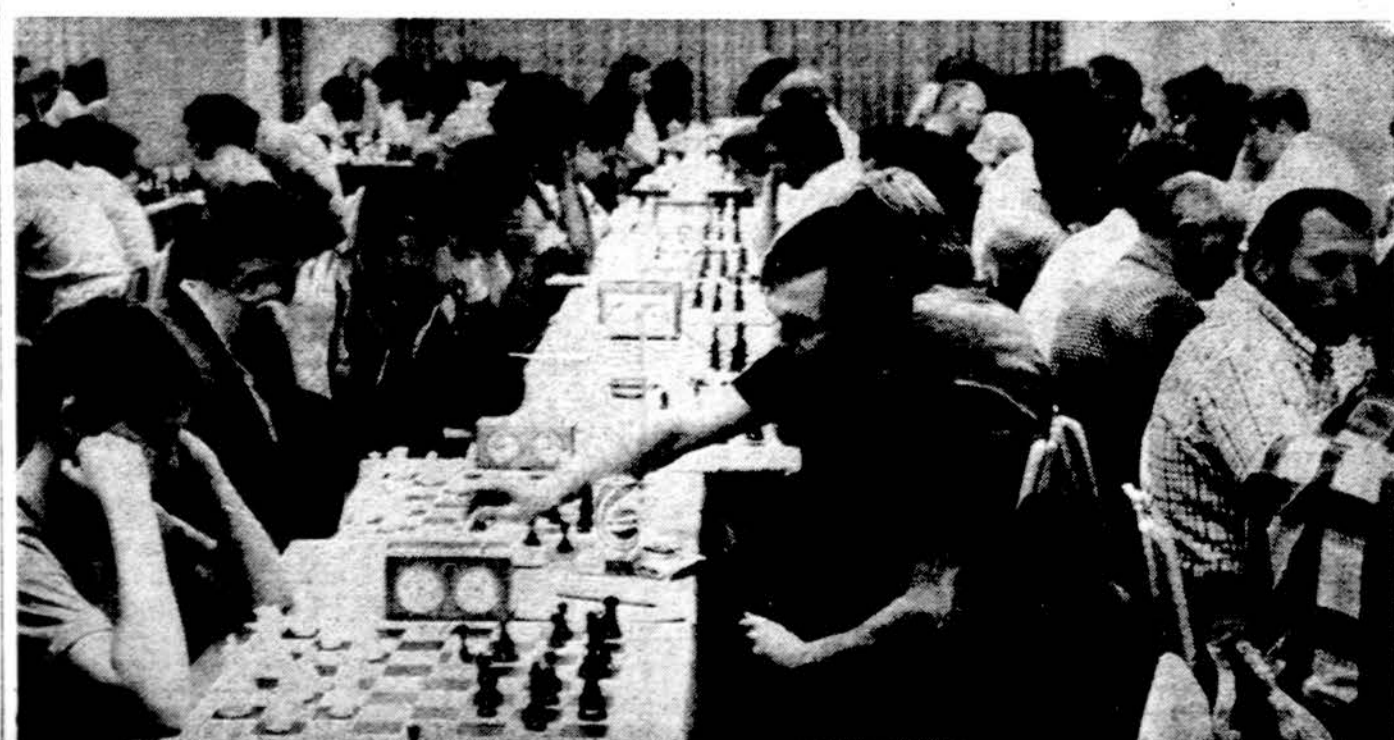
Bendras vaizdas šachmatų turnyre La Salle viešbutyje, Chicagoje.