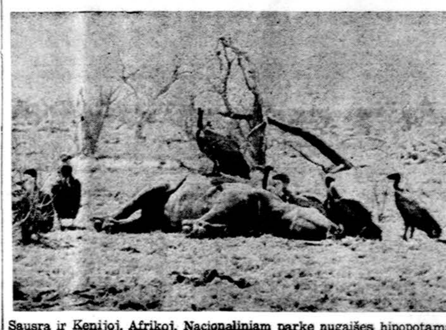
Sausra ir Kenijoje, Afrikoje. Nacionaliniame parke nugaišęs hipopotamas

La Paz. — Bolivijoj palyginti buvo ilgai ramu, prisimenant jos dažnus perversmus. Dabar pranešama, jog dešiniojo sparno socialistų vadas Carlos Valverde su 190 ginkluotų vyrų sukilo prieš prez. Hugo Banzer, užsibarikadavo viename rytų Bolivijos mieste, o jį apsupo kariuomenė ir policija.