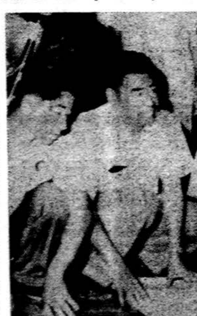
Komunistinės Kinijos specialistai Afrikoje padeda techniškai atsilikusioms tautos įruoti kai kuriuos įrengimus

Kiek šis institutas turi narių, neteko patirti, bet yra tikra, kad jų narių tarpe yra 1,300 kunigų ir turi savanorių atstovų dvidešim-