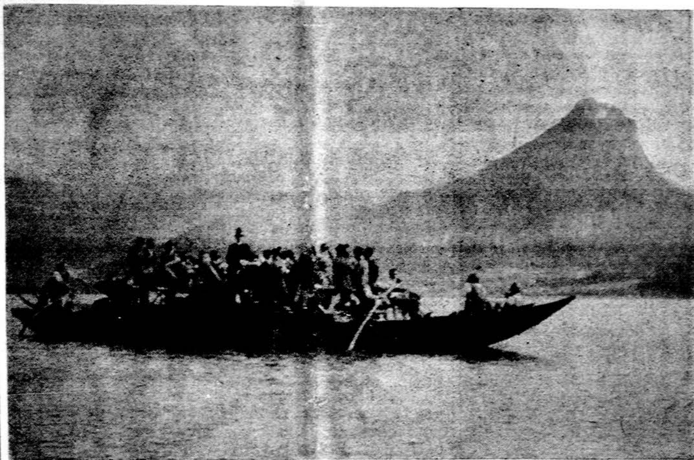
Sventadienio vakaro romantika ant St. Wolfgang ežero, Salzburgo krašte, Austrijoje. Kaimo dūdu orkestras linksmina paežerės gyventojus, o kalnai aidai.

Birželio 1 "Tiesa" skelbia, kad Lietuvoje jau esą gazofikuota 500 tūkstančių butų. Gazofikacija buvusi pradėta prieš 15 metų. Gazų, kaip pigiu kuru, krašte naudojasi jau 83 procentai miestų ir ketvirtadalis kaimo gyventojų. Dujos požeminiais vamzdžiais ateina iš Dašavos (Ukrainos) ir toliau pravedamos į įvairias vietas. (E.)