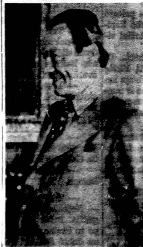
Vak Vokietijos kancleris Willy Brandtas 8 m. gruodžio mėnesį švenčia savo 60 metų amžiaus sukaktį