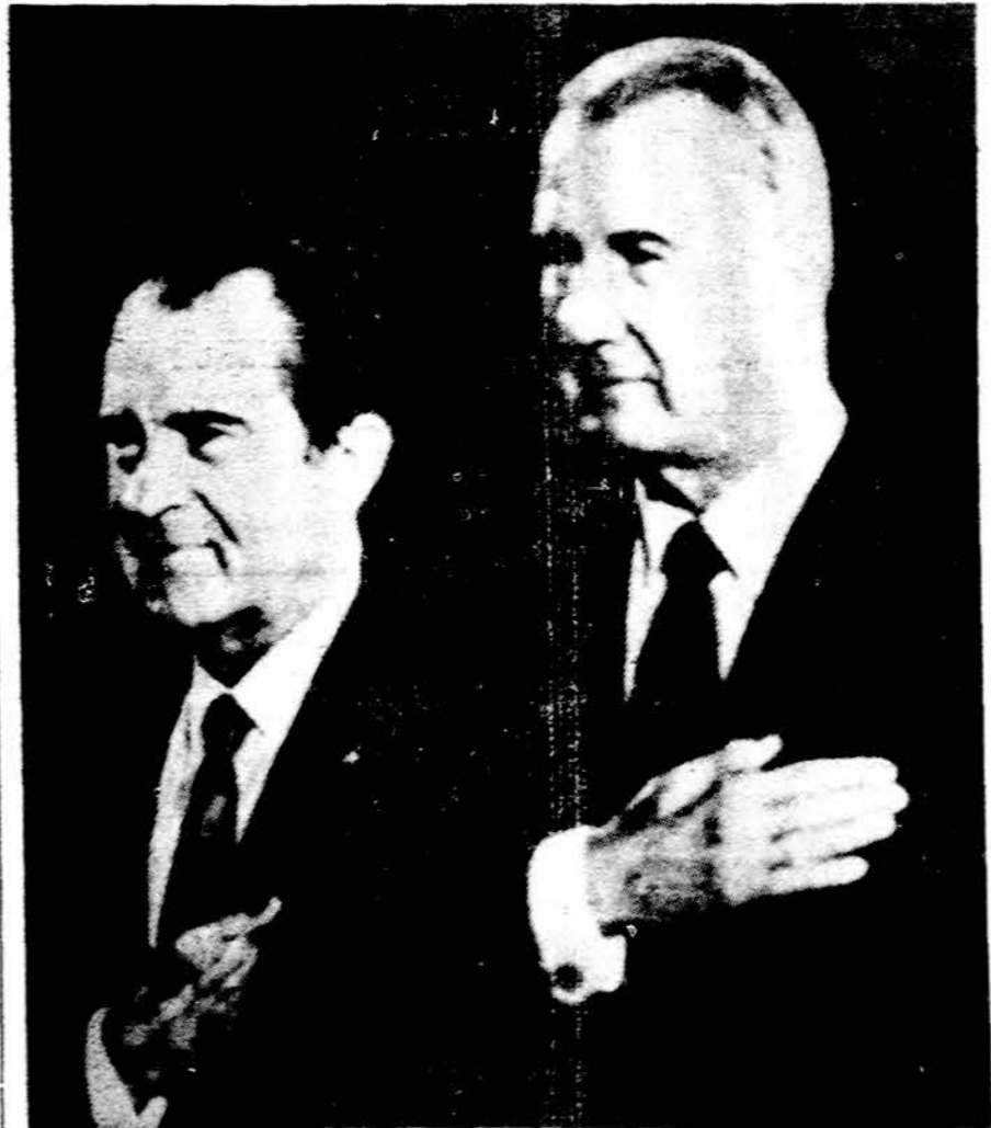
Du vyrai — prez. R. Nixonas ir Spiro Agnew, kurie šiuo metu valdo JAV-bes ir turi labai daug rūpesčių

Nūdien jaunos poros savo įgytą laisvę panaudoja besidžiaugdamos gyvenimu. Jos dažnai keliauja, lanko restoranus, teatrus. Pranašaujama, kad turizmas išleids žmogaus lėšas per sekančią dešimtmetį padidėsiančios nuo dabartinių 40 bilijonų iki 92 bil. Kokį tai turi ryšį? Tradicinės vedybos buvo vyro ir žmonos visam gyvenimui įsipareigojimas vaikų augimui. Vis didėjančiam jaunų vyrų skaičiui vedybos darosi bandomi ir netgi laikinu susitvarkymu. Dvaikšiai ir sociologai įspėja, kad šis jaunų porų vis didėjęs pasinešimas į vedybinius malonumus sugriaušias santuokinius įsipareigojimus. Vaikų psichologai pažymi, kad nepaprastai didelis skaičius nusikaltėlių atsiranda iš šeimų, neturinčių tėvo ar kuriosios abu tėvai dirba. Jie bijo, kad vis didėjęs skyrybų skaičius, laikui bėgant, pasireikš jaunų nusikaltėlių teismuose.