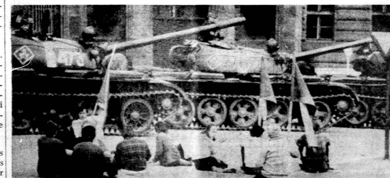
Cekoslovakijos tragedija prieš 5 metus. Kai 1968 rugpiūčio 21 sovietų tankai įriedė į Pragę, čekų jaunimas ruošė protesto demonstracijas, iškilė valstybines vėliavas ir dainuodami patriotines dainas blokavo gatves

NEW YORK. — Šios savaitės "Time" magazinas rašo, jog Teisingumo departamente yra aiškių įrodymų, kad Spiro Agnew tikrai buvo paėmęs kyšių, būdamas Marylando gubernatorium, ir kad tuo reikalu pasakys žodį "grand jury" kitą mėnesį. Kongresmanas John Anderson (resp., Ill.) sako, kad jam skambinęs prezidento patarėjas Melvin Laird ir sąsėkas, kad neimtum nei Agnew ginti, nei teisti. Laird su juo kalbėjęs ne kaip oficialus pareigūnas, bet kaip asmeninis draugas.