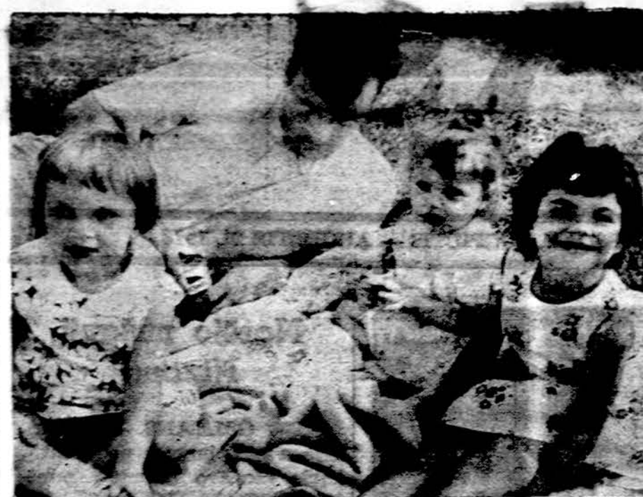
Amžiu ir polinkiams pritaikintas kūrybinis vaikų užėmimas yra geriausias vaistas prieš didžiausią mūsų visų priešą — įvairiojo narkomaniją ir girtavimą. Sekime kiekvienas šio tėvo elgesiu.