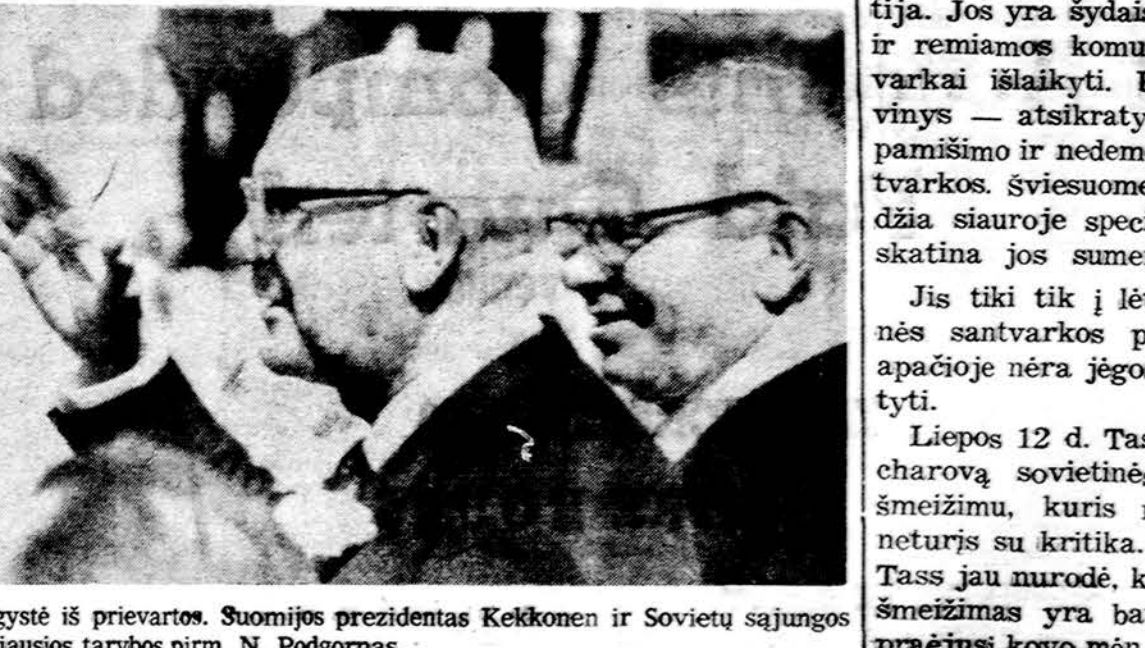
Draugystė iš prievartos. Suomijos prezidentas Kekkonen ir Sovietų sąjungos aukščiausios tarybos pirm. N. Podgornas.