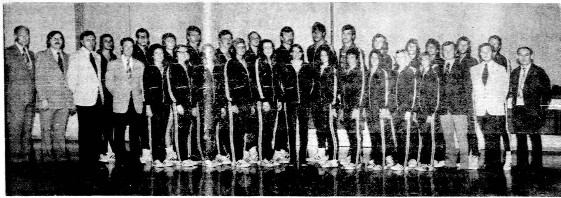
Moterų tinklinio ir vyrų krepšinio rinktinės su vadovais prieš išvyką į Europą