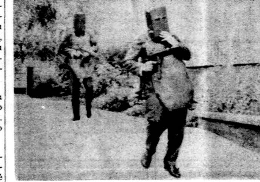
Vakarų Berlyno policija, kovodama su bankų plėšikais, pradėjo naudoti naujo tipo šaukus ir šarvus apsaugojančius nuo šūvių galvą ir krūtinę.