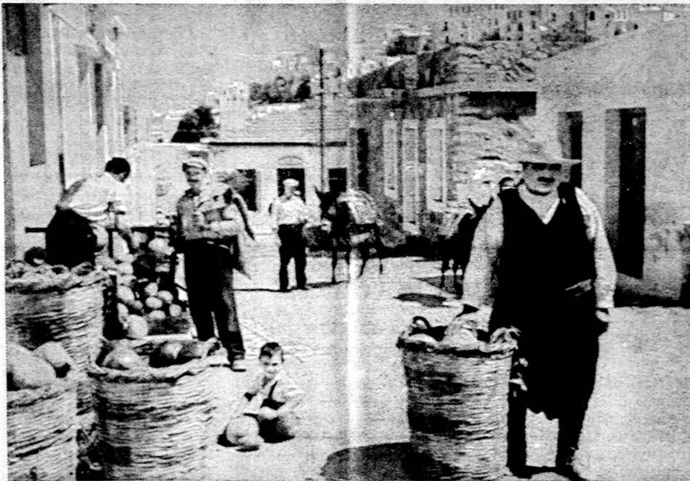
Būdingas Graikijos gatvės vaizdas karštą vasaros dieną

NEW ORLEANAS. — Amerikos karo veteranų konvencija didelė balsų dauguma atmetė siūlymą į organizaciją priimti ir moteris pilnateisiais nariais.