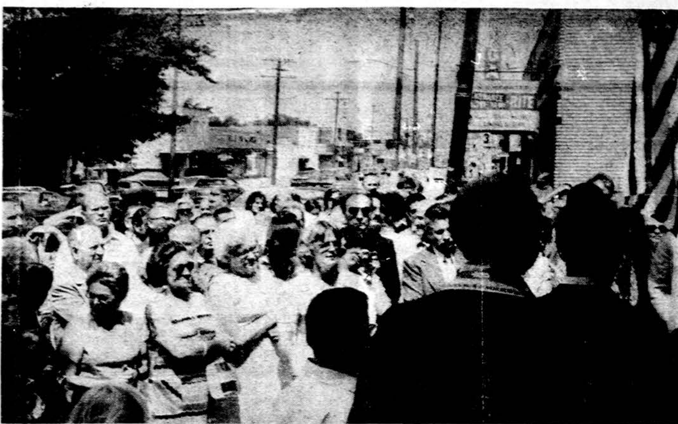
Is Lietuvių namų Clevelande atidarymo iškilmių rugp. 19 d. Dalyvių dalis prie naujų namų pastato.

Chicago sveikatingumo inspektorius įsakymu bus išimama iš krautinių keturių rūšių pur-