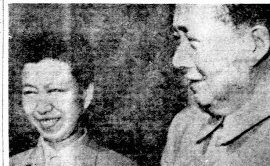
Rečiau pasitaikanti proga tokiai nuotraukai: Mao ir jo žmona Čiang Čing. Čing vardas vėl pradėtas dažniau minėti, kai Pekine vyksta kovą dėl valdžios ir Mao įpėdinio. Ji laikoma viena iš kairiojo sparno, radikaliųjų, vadų.

Talkininkaudama tarptautinei reakcijai ir imperializmo jėgoms, Pekino vadovybė pigia demagogija mėgina bloginti Sovietų Sąjungos, besivystančių šalių ir nacionalinio išsivadavimo judėjimo santykius, kad tokiu būdu besivystančios šalys ir nacionalinio išsivadavimo judėjimas netektų patikimos atramos ir gynimo, rašo "Rude pravo".