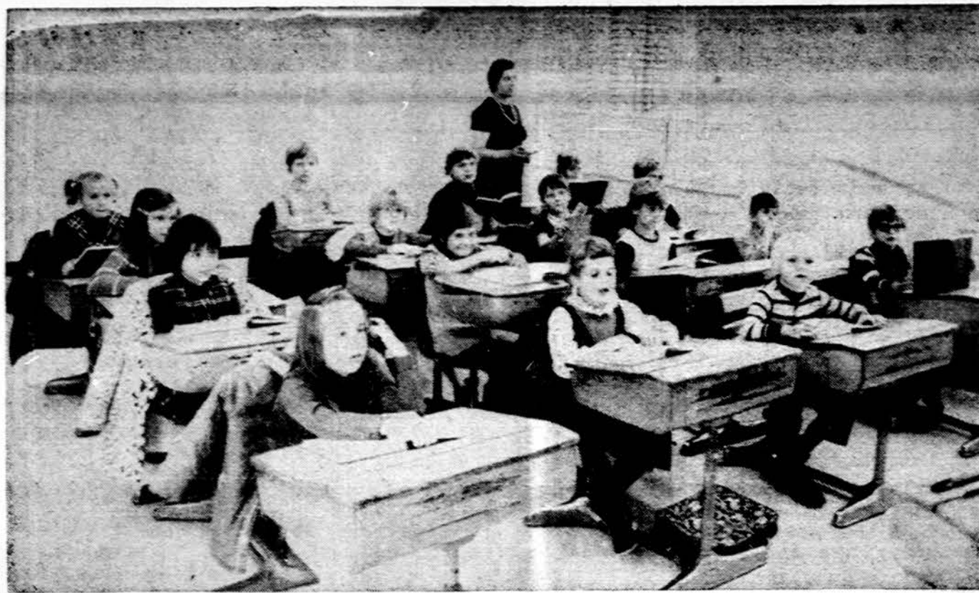
Dariaus Girėno mokykloje praeitais mokslo metais. Š. m. rugsėjo mėn. 8 d. vėl prasideda mokslo metai. 9 val. registracija Jaunimo Centre.