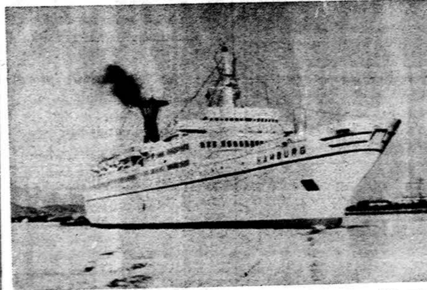
Vakarų Vokietijos laivinkystė, dėl išplitusio susisiekimo lėktuvais ir kitų prežaščių, pergyvena didžiulę krizę. Garsiosios laivų bendrovės turi didelius nuostolius. Dolerio vertės kritimas juos dar padidino.

Taikos programa vis plečiam. Rugsėjo mėn. Maskvoje bus sukviesta 80 kraštų ir 60 tarpautinių organizacijų atstovai kalbėti apie socialistinę taiką, kuri iš esmės skiriasi nuo vakarietiškos.