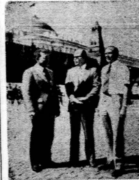
Vakarų Vokietijos pramonininkų atstovai Maskvoj. Jie derasi su sovietais ir nori pirkti urano rūdus už bilijonus dolerių ir tuo sulaužyti Amerikos urano monopolį. Net sovietai žada paruoti savo uranų pigestėmis kainomis

Cook apskrities asesorius Cullerton nusistatė pasiūlyti, kad būtų padarytas pigesnis namų įkainojimas ir tuo būdu sumažinti namų mokesčiai net apie 25%.