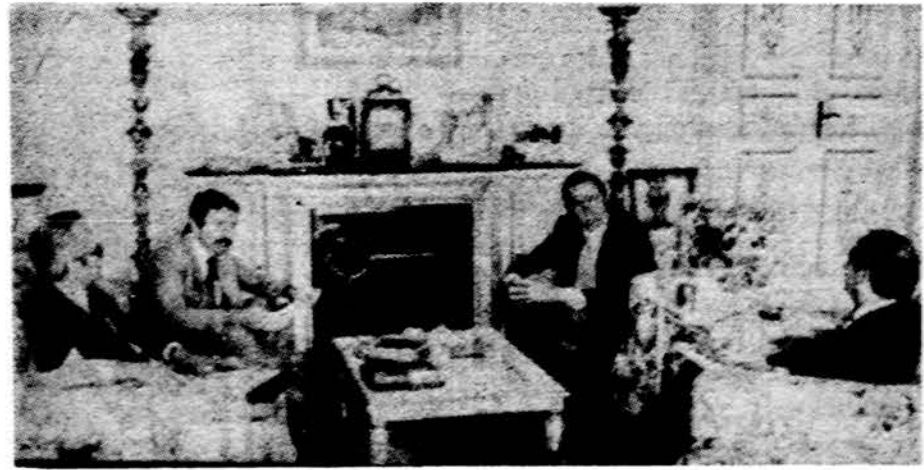
Buv. Graikijos karalius Konstantinas (antras iš dešinės), šiuo metu gyvenęs Italijoje, pasibaigus Graikijoje referendumui, kurio proga buvo panaikinta monarchija, vienoje romėnų viloje priėmė spaudos atstovus ir pareiškė, kad tautos atsklausimas buvęs neteisėtai prarastas. Šia proga jis dar kartą pareiškė savo protestą.

Bendrosios rinkos parlamente savo atstovus turi Prancūzijos ir Italijos komunistai. Ligi šiol jie veikė atskirai ir didesnes akcijas neparodė. Pagal parlamento taisykles tik ta grupė, kuri turi 14 atstovų, tegali būti užregistruota kaip atskira politinė grupė. Tada ji turi teisę gauti iš BR biudžeto 21,000 dol. pašalpos ir patalpas savo raštinei. Susijungę Prancūzijos ir Italijos komunistai teturi tik 13 atstovų. Tad Europos parlamento vadai taisykles šiek tiek pakeitė, kad naujoji grupė nenustotų savo privilegijų. Susijungę komunistai kovos prie žemės ūkio produktų kainų kilimą ir rūpinsis darbininkų socialine gerove.