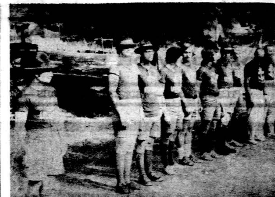
Dariaus - Girėno stovyklos vadovybė rikiuotėje.

— Jūs abu klystate — sako trečiasis. Tikriausias žmogaus tarnas — aligatorius. Patelė neršto metu padeda apie 10.000 kiaušinėlių, kurių 9.999 surija patinas. Jeigu patinas jų nesudorotų, tai mus suaugę aligatoriai tuojau suėstų.