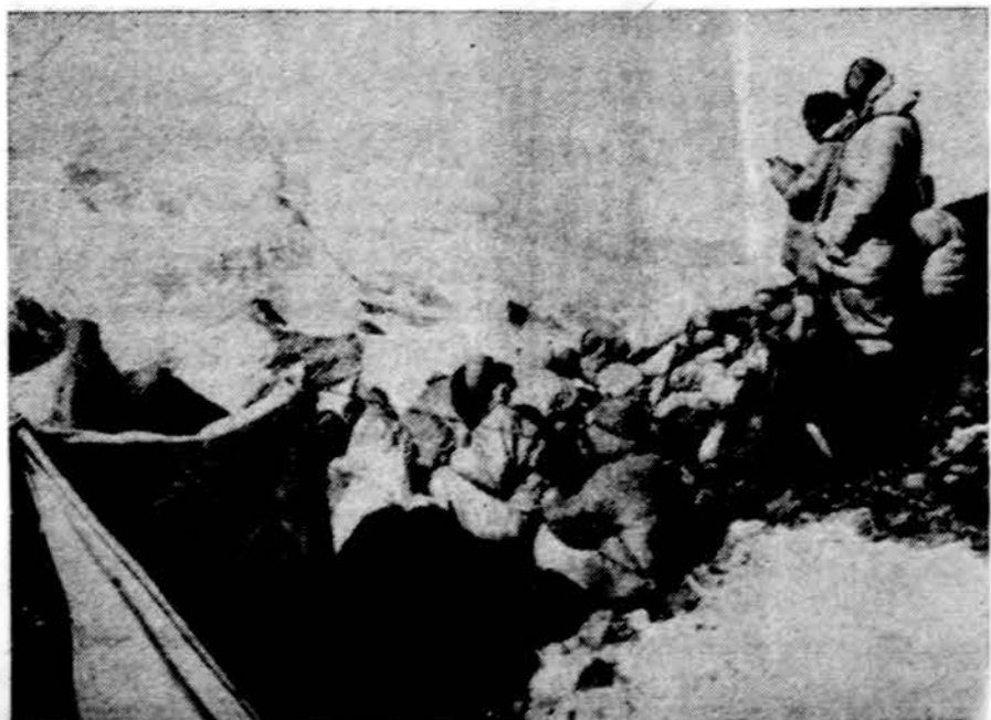
Komunistinės Kinijos alpinistai tiria Everesto kalnų sritį

Washingtonas. — Nuo sausio mėnesio nėra Amerikos ambasadoriaus Maskvai. Keli kandidatai atsisakė tos vietos. Dabar laukiama, kad ambasadorių parinks Henry Kissingeris, kai pradės eiti savo naujas pareigas. Daugiausia minimi dabartinis valstybės paskretorius Kenneth Rush ir sekretoriaus asistentas Vid. Rydams ir Pietų Azijai Joseph Sisco.