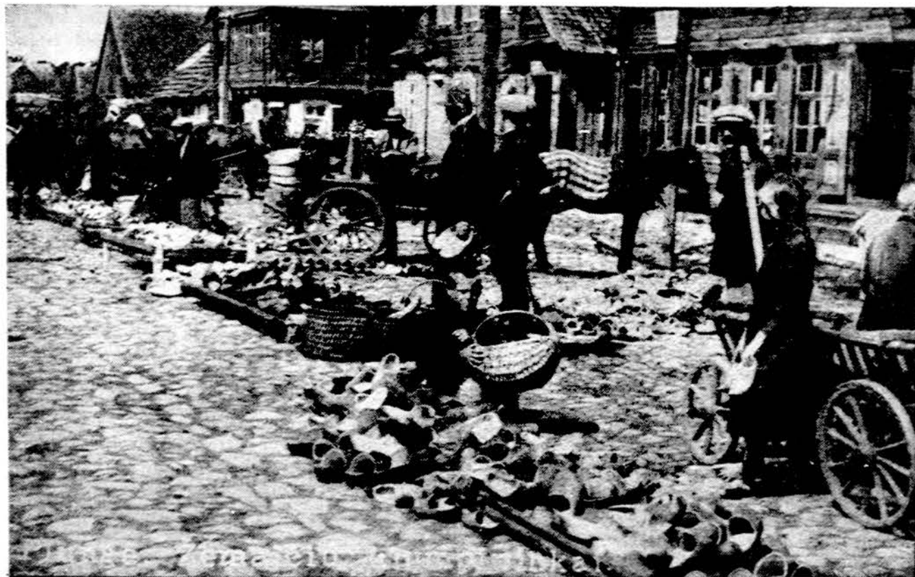
Mažiausiai prieš 60 metų — Plungės kiuplių pardavėjai prieš I pasaulinį karą