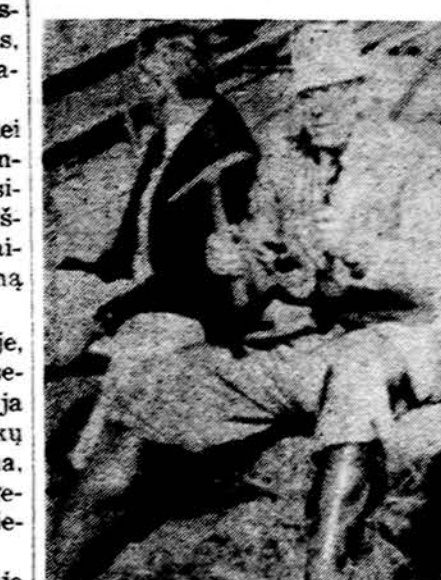
Svedijos karalius Gustavas VI Adol- fas, šiuo metu sunkiai sergąs, buvo labai paprastas žmogus ir nevengė fizinio darbo, kuris jį stiprino ir teikė ilgą gyvenimą

Sunku taip pat pasakyti, ar panaši teroro banga dar pasika- rios, ar ne. Viena aišku, ramiems žmonėms sunku surasti dabar saugią vietą.