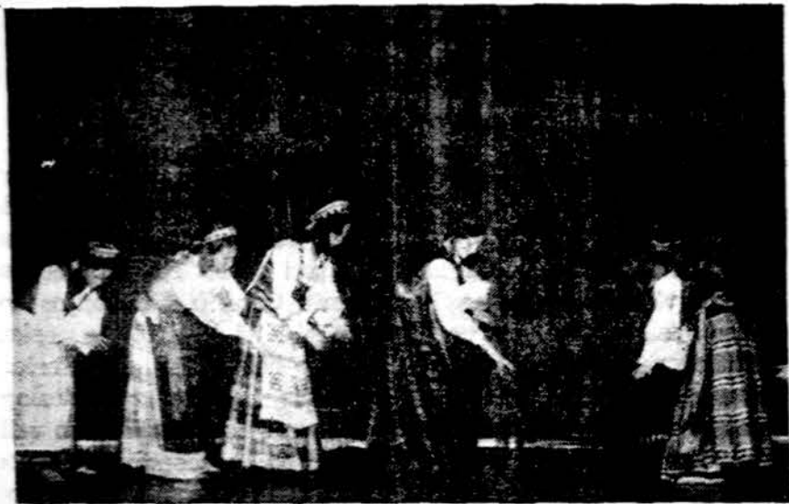
Tautinius šokus šoka Vasario 16-sios mokiniai