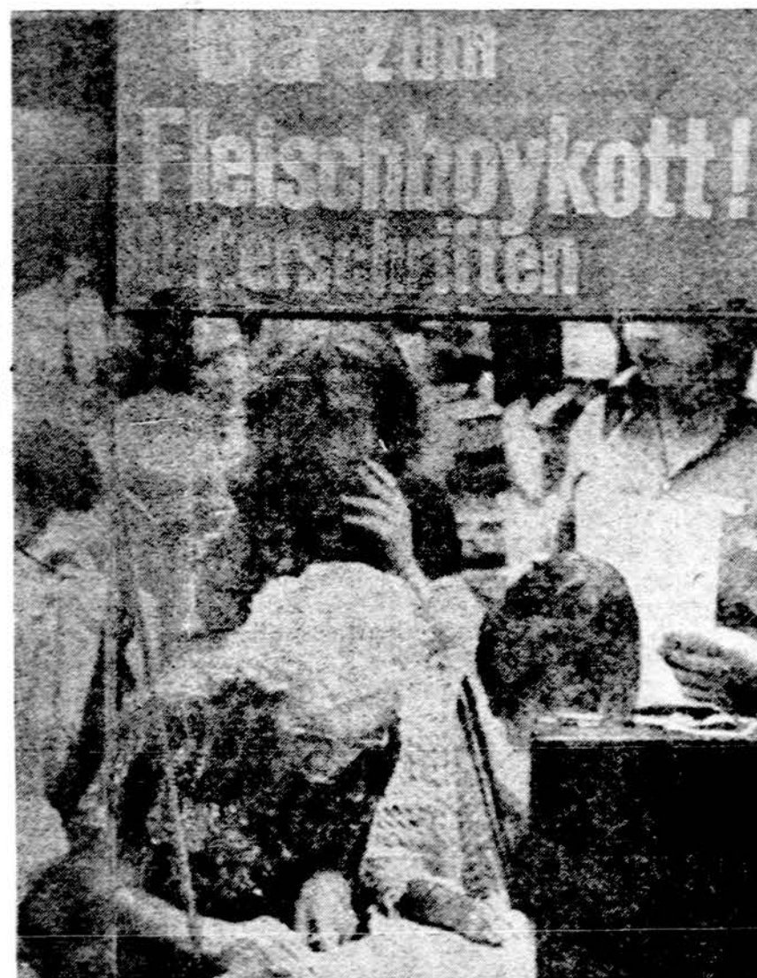
Ne tikta Amerikoje, bet ir Europoje smarkiai pakilo mėsos ir jos gaminių kainos. Vakarų Vokietijos moterys suruošė organizuotą mėsos boikotą ir pasirašė šiuo reikalu protestą

ANCHORAGE. — Dingusio prekybinio lėktuvo liekanos rastos netoli Cold By, Aljaskoj. Škelebiama, kad šeši asmenys žuvo. Lėktuvas gabeno padangas iš Travis oro bazės Californijoj, į Yokota, Japonijoj.