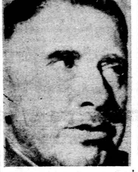
Gen. Augusto Pinochet, įvykdęs perversmą Čilėje.