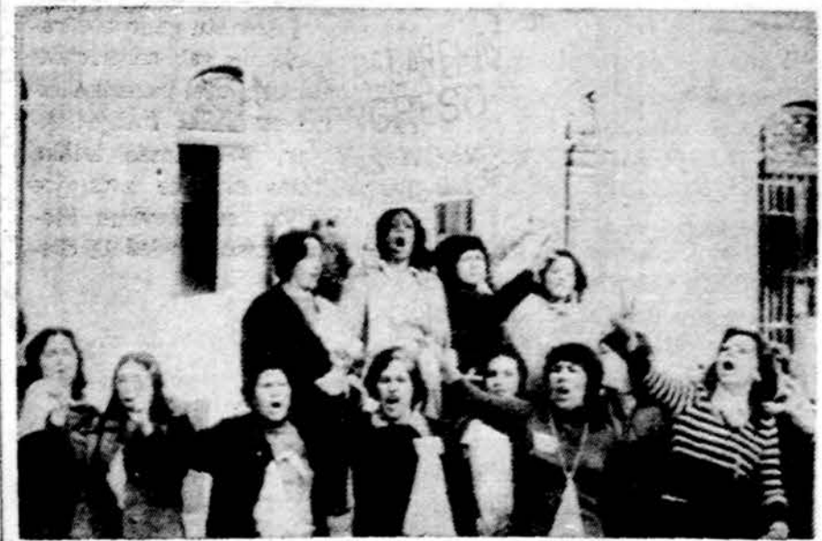
Viena demonstracijų Čilėje, kurios buvo kasdieninis reiškinys