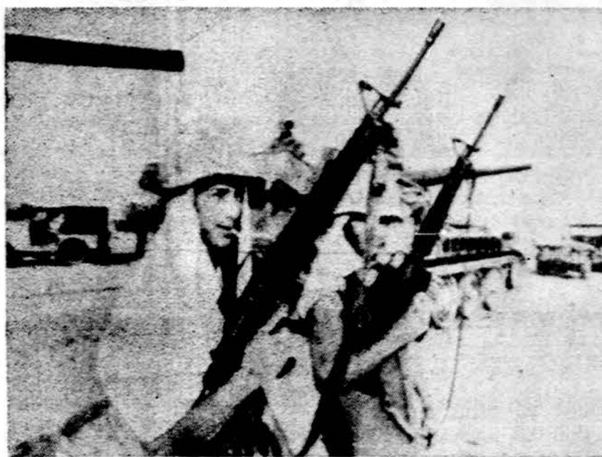
JAV prezidentas R. Nixonas įspėjo arabų šalis nekelti alyvos kainų. Maždaug tuo pačiu metu Mohave dykumoje, Kalifornijoje buvo suruošti Amerikos kariuomenės dykumų manevrai, kuriuose dalyvavo 5000 marių ir kiek pagalbinių dalinių. Kai kurie arabų vadai ėmė kaltinti JAV-bes, kad jos ruošiasi karui prieš arabų šalis. Amerikos kareiviai dykumų manevrų metu

Institutas taip pat skelbia, daugiau kaip ketvirtadalis Sovietų karių pajėgų šiuo metu yra sutraukti prie ilgos Sovietų - Kinų sienos. Ryšium su tuo, komunistinė Kinija neatleidžia stiprianti savo apsigynimo sistemą, įskaitant ir atominę raketą.