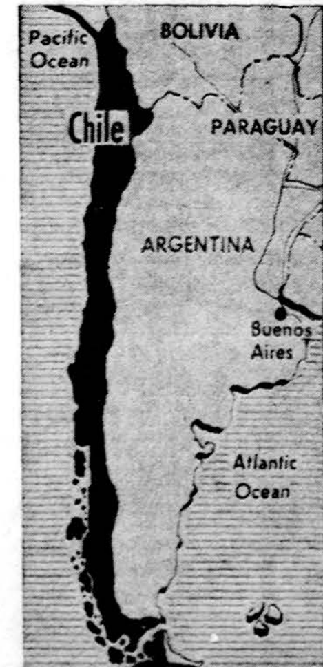
Situaciniame žemėlapyje juodai pažaisduota Čilės valstybės teritorija.

Chicagoj ir apylinkėse debesuota, malonus oras. Temperatūra apie 70 laipsnių.