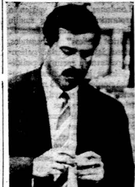
Vak. Vokietijoje buvo žymiai pakeltos cigarečių kainos. Nemaža dalis rūkatorių pradėjo pirkti tabaką ir patys sukuti papirosus

Vasarą miškai saugo dirvožemius nuo didelio peržiūvimo, o rudenį — nuo staigaus atšalimo ir ypač — šalno. Mažesni temperatūrų skirtumai miške naktį ir dieną. Tačiau daugiausia įtakos miškas turi oro masių judėjimui. Į mišką įsiveržusios oro srovės išsisklaido tarp medžių lapų ir gerokai susilpnėja. Be to, miškai turi į-