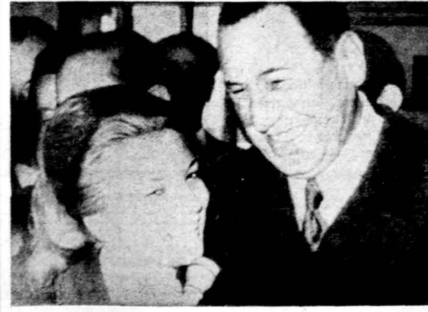
Argentinos prez. Peron su savo žmona, kuri būdama jauna ir graži, susilaukė krašte daug dėmesio.

BUENOS AIRES. — Juan Peronas, kuris už dešimt dienų tikisi būti perrinktas Argentinos prezidentu, sunegalavo širdimi. Spalio 8 d. Peronas bus 78 metų amžiaus. Gydytojas lanko jį kasdien ir pataria jam susilaikyti bent tris mėnesius nuo bet kokio aktyvumo.