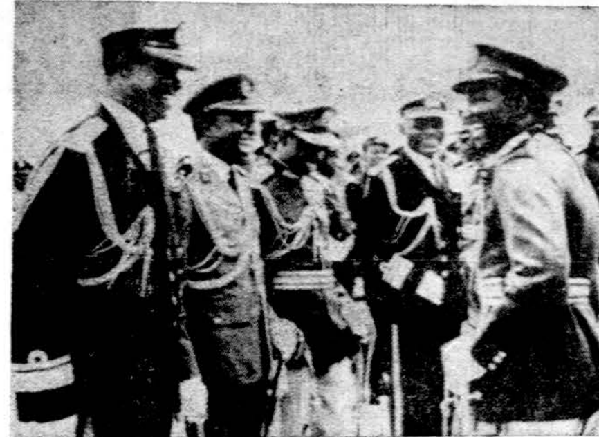
Aukštieji Nigerijos respublikos (Afrikoje) kariškiai. Dešinėje — valstybės šefas Gowon.

BUENOS AIRES. — Juan Peronas, kuris už dešimt dienų tikisi būti perrinktas Argentinos prezidentu, sunegalavo širdimi. Spalio 8 d. Peronas bus 78 metų amžiaus. Gydytojas lanko jį kasdien ir pataria jam susilaikyti bent tris mėnesius nuo bet kokio aktyvumo.