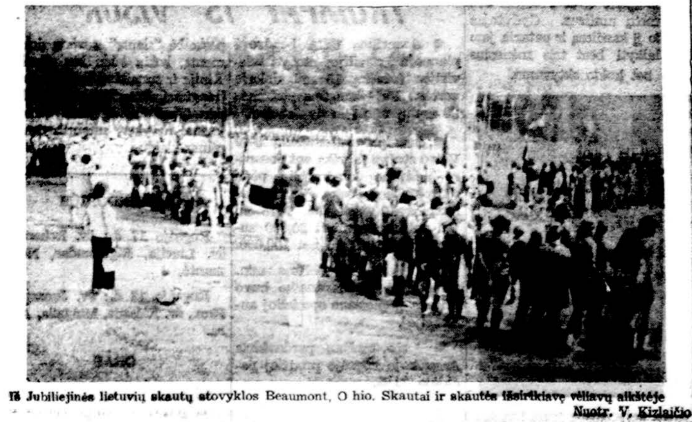
18 Jubiliejinės lietuvių skautų stovyklos Beaumont, O hio. Skautai ir skautės išsireikiavė vėliavų atkėčije.