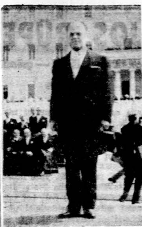
Naujasis Gratijs prezidentas Georgios Papadopoulos, nuvertęs karalių ir laimėjęs plebisicita, paleidęs jo anksčiau suimtus politinius kalinius, dabar ima įgauti didesnį populiarumą.

MISCELLANEOUS MOVING SERENAS perkausto baldus ir kitas daiktus. Ir iš toli miesto leidimai ir pilna apraudo. 2047 W. 67th Place — WA 5-8063