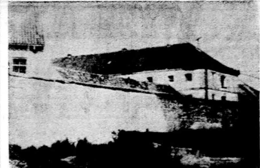
Psichiatrinė ligoninė Įsrutyje (Cerniakovskyje), Mažojoje Lietuvoje (Kaliningrado srityje), kurioje sovietai kalina prieš režimą pasisakiu- sius savo mokslininkus ir kitus žymesnius asmenis

Praeityje Kinijos vadai reikė nepasitenkinimą Japonijos finan- suojamam alyvos vamzdžių pra- vedimui pagal sovietų — kinų pasienį.