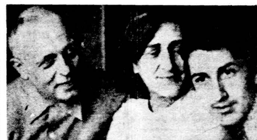
Sovietų labai puolamas jų atominis fizikas A. Sacharovas ir jo šeima. Neseniai jis kreipėsi į JAV-bių kongresą, prašydamas neduoti Rusijai prekinį lengvatų