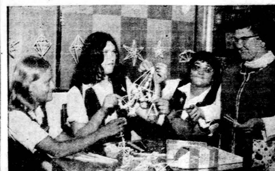
Sesuo Roseanne ruošia kalėdinius papuošalus, kurie bus rodomi "Lietuvių festivaly" sekm., rugsėjo 23 d., Talman taupymo bendrovės automobilijų kieme, prie 56 ir Kedzie gatvių. Talman taupymo bendrovė specialiai ruošia šį festivalį ir nuo 12 iki 6 val. popiet duos įvairią programą su keturiom lietuviškų šokių grupėm, su dainininkėm ir Neo-Lituanų orkestru. Bus galima pirkti lietuviškų knygų ir maisto. Marijos aukšt. mokyklos moksleivės rody savo meną ir liaudies meno dalykus. Popietėje bus atstovaujami tėvai jėzuitai, Balzeko muziejus, lietuvių skautai, Marijos aukšt. mokyklos meno ir Rūtos klubai, kai kurie lietuvių biznieriiai. Lietuvių paroda Talman taupymo bendrovėje bus iki spalio 2 d. Visi kviečiami atsilankyti.

× Tradicinis rudens vakaras, ruošiamas LB Brighton Parko apylinkės, įvyks spalio 6 d., 7:30 v. v., Pakšto salėje. Įdomią programą atliks talentingas jaunimas. Kviečiame visus atsilankyti ir besivažiuojant, prie melodingos muzikos draugiškai praleisti vakarą. Rezervacijoms skambinti 523-7410. (pr.)