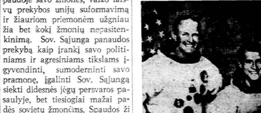
Antradieni iš erdvių grįžta antrosios erdvių laboratorijos astronautai. Jau paskelbta ir trečiosios laboratorijos Skylab III astronautai. Ją sudaro Gerald Carr, Edward Gibson ir William Pogue. Šie vyrai erdvėje išbuvo 56 dienas.

Washingtonas. — Darbo unijos AFL-CIO vadas George Meany yra stipriai nusistatęs prieš įvairias lengvatas Sovietų Rusijai. Šios savaitės pradžioje Meany buvo pasiuntęs telegramą komiteto visiems 25 nariams. To se telegramose labai kasdieniškai žodžiais buvo puolamas Kissingeris už pastangas sudaryti prekybos sutartis su komunistinio bloko kraštais. Tokia prekyba su komunistais, pasak Meany, yra "prieš geriausius JAV interesus". Esą, Kissingerio pasiūlymas užtikrinti importo padidėjimą iš tautų, kurios laiko priespaudoje savo žmones, varžo laisvą prekybą unijų suformavimą ir žiauriom priemonėm užgniaužia bet kokį žmonių nepasitenkinimą. Sov. Sąjunga panaudos prekybą kaip įrankį savo politiniams ir agresiniams tikslams įgyvendinti, sumoderninti savo pramonę, įgalinti Sov. Sąjungą siekti didesnės jėgų persvaros pasaulyje, bet tiesiogiai mažai padės sovietų žmonėms. Spaudos žiniomis, Kissingerio ir Meany susirėmimas dar tik prasideda, bet viena jau dabar aišku: darbininkų vadas davė pirmąjį smūgį buvusiam profesoriumi.