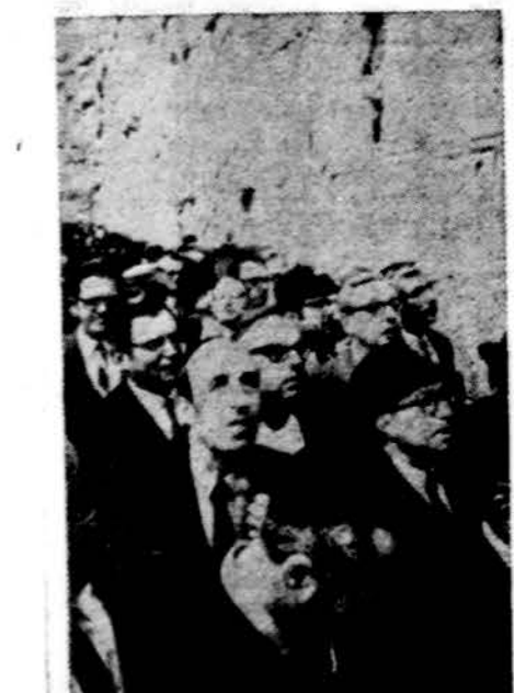
Užsieniečiai turistai Jeruzalėje apžiūri Raudų sieną. Šiuo metu Izraelį daugiausia lanko vokiečiai.

1973.IV.20 Kauno II aštuonmetės mokyklos mokytoja Stanionė ne gąsdino vaikus: "Per Velykas nei vienas neikite į bažnyčią, nes tenai stovės milicija ir jus visus suims". Viena mergaitė atsiliepė: "Aš eisiu į bažnyčią su mamyte ir tėveliu — jie mane apgins nuo milicininkų".