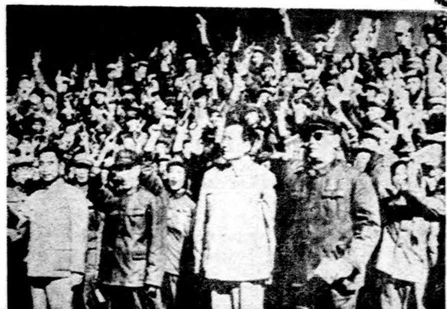
Mao (stovi viduryje, šviesiu švarku) vėl perinktas komunist. Kinijos galva. Kairėje — ministras pirmininkas Čou, o greta jo nuo valdžios nustumtas ir tragiškai žuvęs Lin Piao. 1968 metų nuotrauka