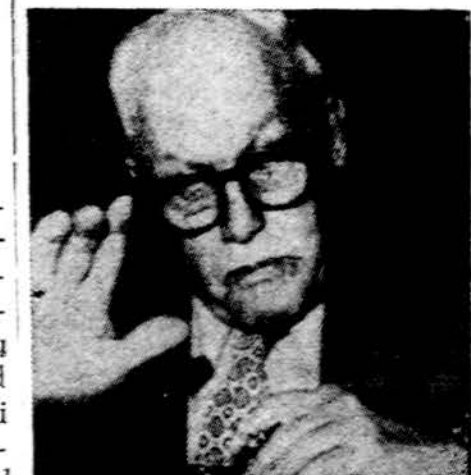
Darbo unijų vadas George Meany