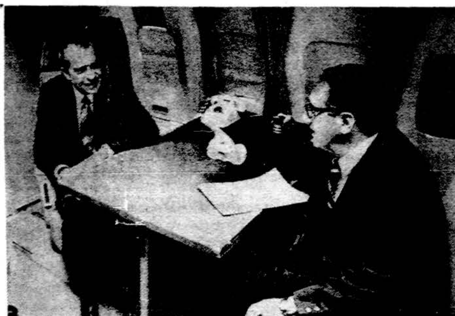
Prezidentas Nixonas ir naujasis valstybės sekretorius Henry Kissinger