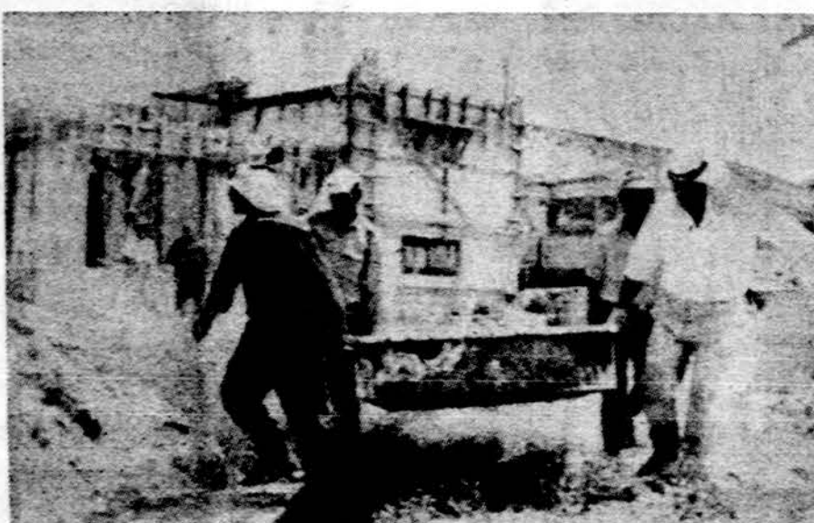
Arabai darbininkai Izraelio užimtose srityse yra aprūpinami darbu. Nors jie ir nelengvai dirba, džiaugiasi gaudami gerą atlyginimą, kurį jiems moka Izraelis.

BUENOS AIRES. — Argentinoje, dabar einąs prezidento pareigas ligi naujai išrinkto Perono įvesdinimo spalio 12 d., Raul Lastiri pareiškė, kad jis sunaikins (Trockitie) Liaudies revoliucinę armiją, kuri yra pasižymėjusi įvairių pareigūnų grobimais. Jis daug padėjo prez. Perono rinkiminę kampaniją, kurioj šis žadėjo sunaikinti visus marksistus. Prieš grįždamas į Argentiną Peronas tą sąjūdį vertino kaip geriausiai kovojantį prieš karinę valdžią.