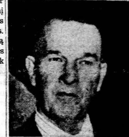
JAV gynybos pasekr. Clements

Ieškoma ir apsigynimo būdų. Kaip ir kiekvieną ginklą išrandant, tuoj ieškoma, kaip nuo jo apsiginti. Pavyzdžiui, būtų pagamintas kaip veidrodinis spindis lėktuvas, su specialiais įtaisais tokius spindulius atstumti atgal prieš šiu. Taip pat ekspertai mano, kad prieš tokius spindulius apsigynimui gali padėti ir blogos oras, dūmai, rūkas, debesys, didelis drėgnumas, oro dulksė ir kiti panašūs gamtos reiškiniai. Tokie spinduliai lekia tiesia linija, kaip televizijos signalai. Geriausia lekią skystu oru, todėl bus ieškoma būdų kaip tokiame spinduliu veikimui panaudoti erdvę. Apsigynimui lenktymėse šiuo metu daug dėmesio skiriama tiems laserio spinduliams, kuri ateityje turės būti ne visuotinės, tai milžiniškos reikšmės.