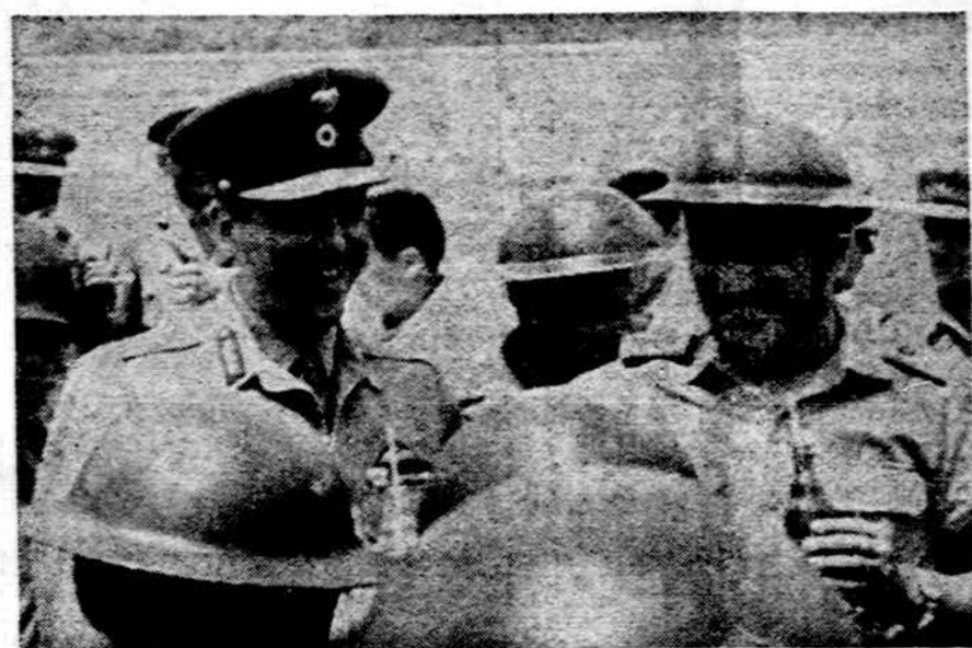
Grakijos pulkininkai. Pakeitus monarchiją respublika, kariuomenė yra svarbiausias valdžios ramstis. Praėjusį šeštadienį pasitraukė 10 Grakijos ministrų ir, manoma, kad jų vietas užims civiliai.

Kiniečiai komunistai savo pasitarimų metu