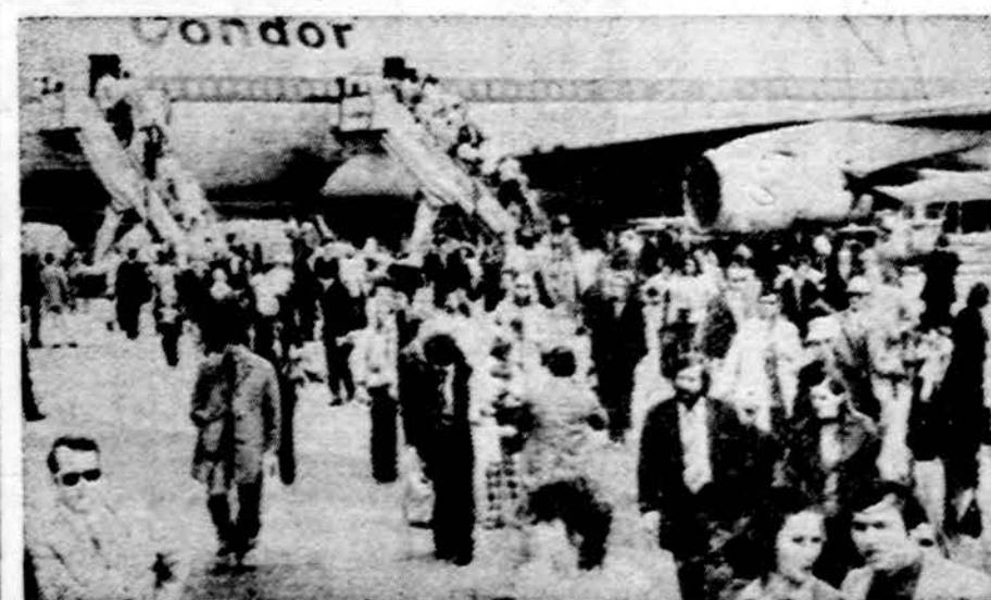
Vakarų Vokietijos turistai vis dažniau lanko Ispaniją

YOKOSUKA, Japonija. — 8,000 darbininkų ir studentų surengė demonstraciją, protestuodami, kad vyriausybė sutiko šiame uoste leisti sustoti ir pasilikti Amerikos lėktuvnešiu "Midway". Lėktuvnešis turi atvykti šią savaitę ir žada čia nuolat lankytis per trejus metus.