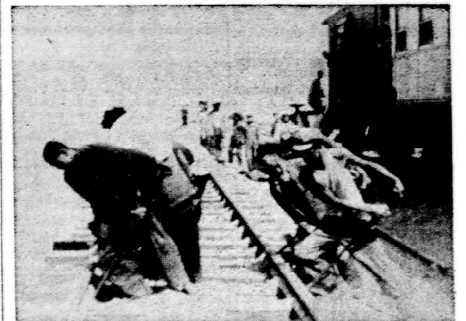
Kinija vakar šventė revoliucinės valstybės 24 metines. Nuotraukoj pasirošimas galimas puolimai iš šiaurės, naujo, strateginio geležinkelio statyba sovietų pasiūny, dykumoje.

WASHINGTONAS. — Yra žinoma, kad sovietai į Iraką pasiuntė už garšą greitesnių bombonešių, ir tokiu būdu gali būti sugriautas jų balansas Vid. Rytuose. Tie lėktuvai yra TU-22, "aklai" skrisdami, gali pasiekti 1,000 mylių per valandą greitį, arba du sykius greitesni nei kiti sovietų bombonešiai, parduoti arabams. Sovietų ginklavimas Irako dar labiau vers to paties griebtis ir Irano šachui.