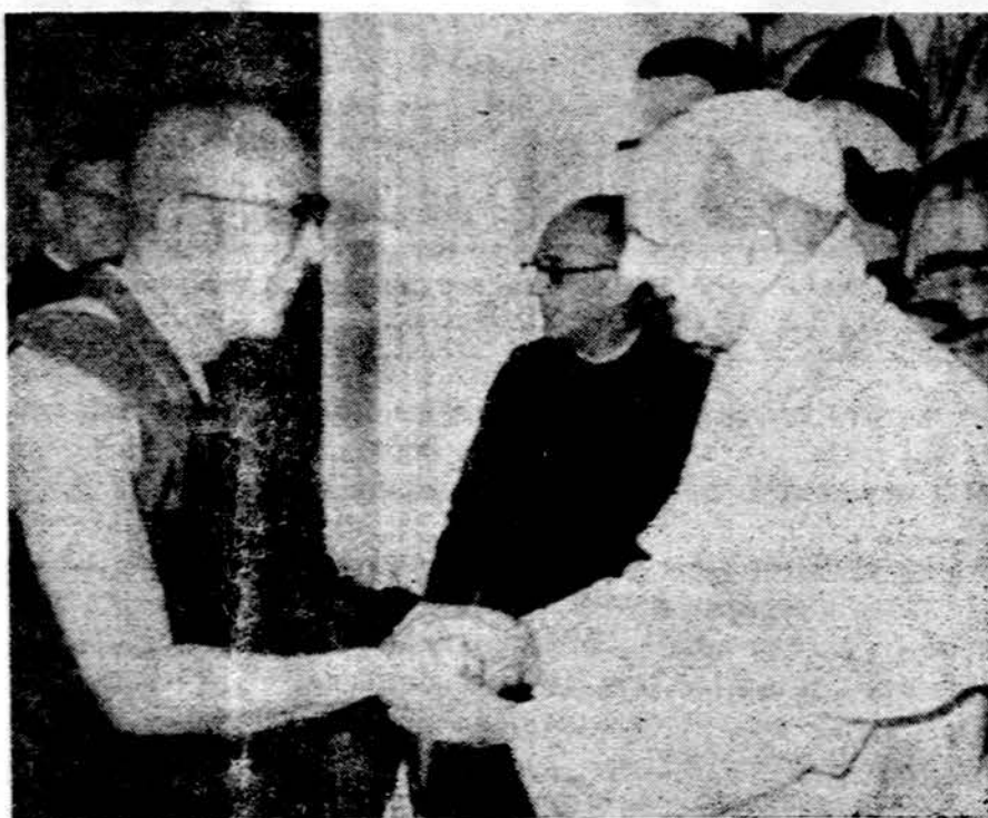
Dalai Lama pas popiežių Paulių VI

DETROITAS. — Jeigu automobilų darbininkų unija su Fordo bendrove nesutars iki spalio 22, tai spalio 26 pradės streikuoti.