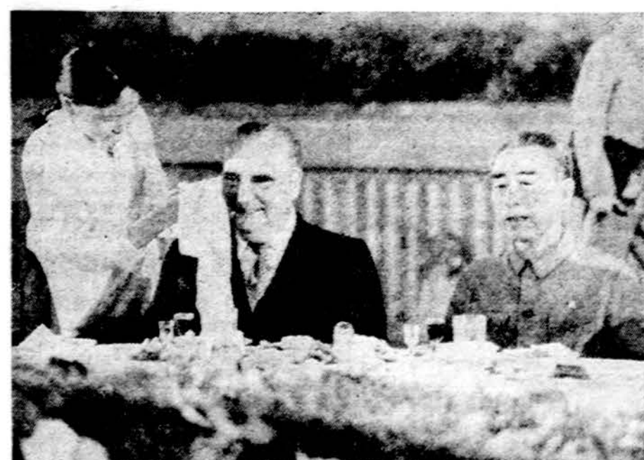
Po 23 patiekalų per vienus iškilmingus pietus pririekia tolimam svečiui ir praktiškai nušluostyti. Kinijos Ču En-lajus tokį banketą buvo surokęs Prancūzijos prezidentui George Pompidou

Kai neseniai Pekine lankėsi Prancūzijos George Pompidou, Ču jam tą pat kalbėjo. Nelengva buvo prezidentui suderinti du priešingus polius, priimti į širdį Kinijos premjero įspėjimą ir testi toliau pradėtus gerinti santykius su sovietais. Iš paskelbto komunikato matyti, kad Pompidou pabrėžė svarbą išlaikyti gerus ryšius su visais didžiais, neišskyrus nei sovietų. Vadinasi, Ču susilaukė kiek didesnio politinio nepasisekimo, Prancūzija jo įspėjimo neišklausė.