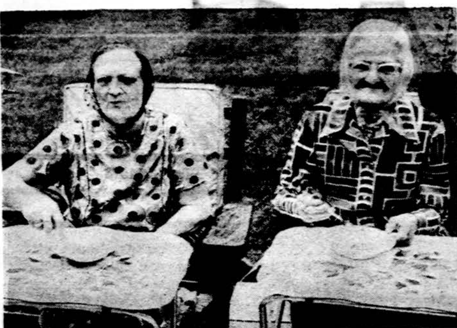
Ir senatvė netaip sunki, kai Lietuvos sodyba daugelį tokių atsirandančių sunkumų šalina galimomis priemonėmis.

TEISINGĄ PATARIMĄ IGYVENDINK - SVEIKESNIS BOSI. SVIESKIMĖS PRIĖS SUSIRGDAMI KLAUSIMAS. Gerb. Daktare, 1. mano giminės iš Lietuvos prašo vaistų nuo tulžies takų ir pūslės uždegimo. Gal pasiseks ko-