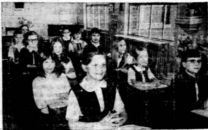
Chicago's Marquette Parko lietuvių parapijos mokyklos viena klasė.

Iš jo nedegama medžiaga ugnia- gesių apdarams, kino, teatrų scenoms nedegamos užuolaidos ir kit.