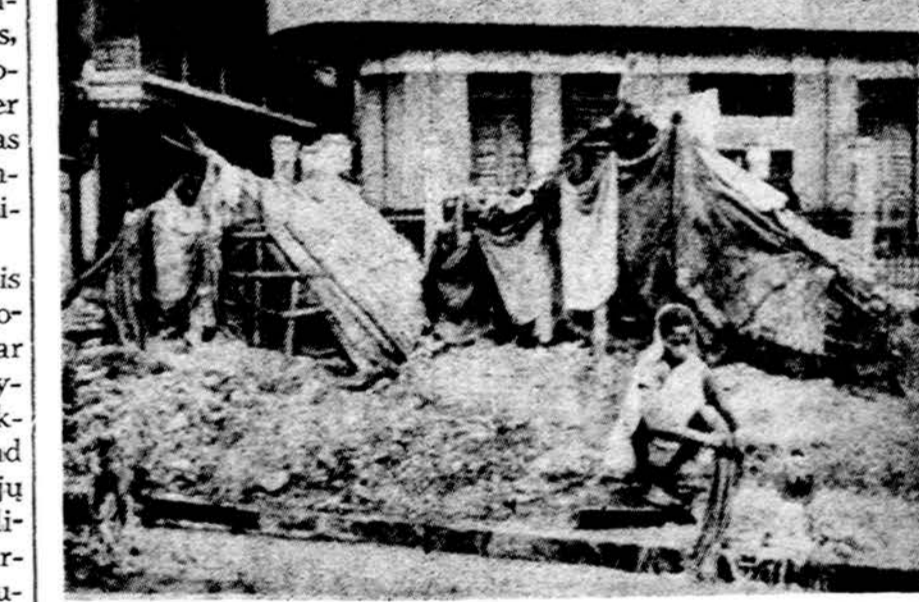
Begalinis skurdas Indijoje. Sitokiose landynėse gyvena žmonės.

Irake komunistai į vyriausybę taip pat patenka per įvairius frontus, kaip Tautinis progresyviųjų frontas ir pan. Du komunistai buvo Irako vyriausybės: irigacijos ir ministeris be portfelio. Sirijoje vadovaujanti Baath