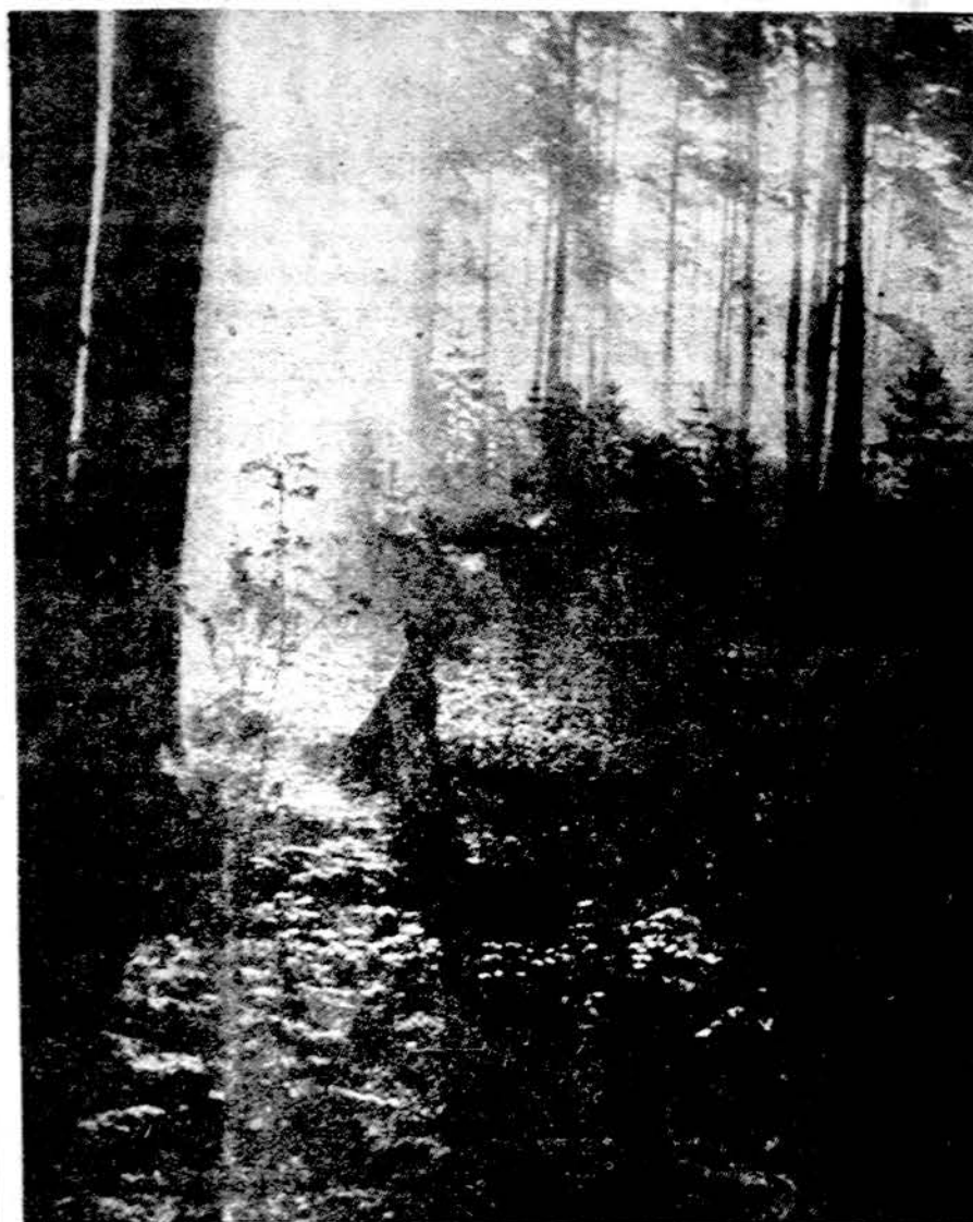
Ruduo Vidgiriio miške, Alytaus apskrity