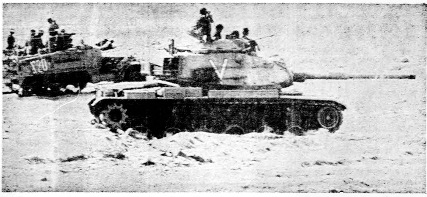
Izraelio tankai prie Sueso kanalo