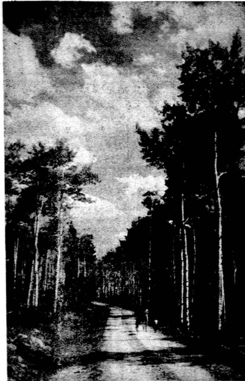
Rudenįjančiam lapuočių miškely. New Mexico

Paklausta apie Vokietinųjų Rytų karą, pridėjo, kad kiek ji pažįsta Brežnevą ir jo grasinimus sunaikinti Izraelį, tai jis, Brežnevas, tikrai esąs „atviras ir beveik brutalus“. Nixonas su juo taip pat pakalbėjo kietai, ir tik tokiu būdu buvo sulaukytas išsiplėtas karas.