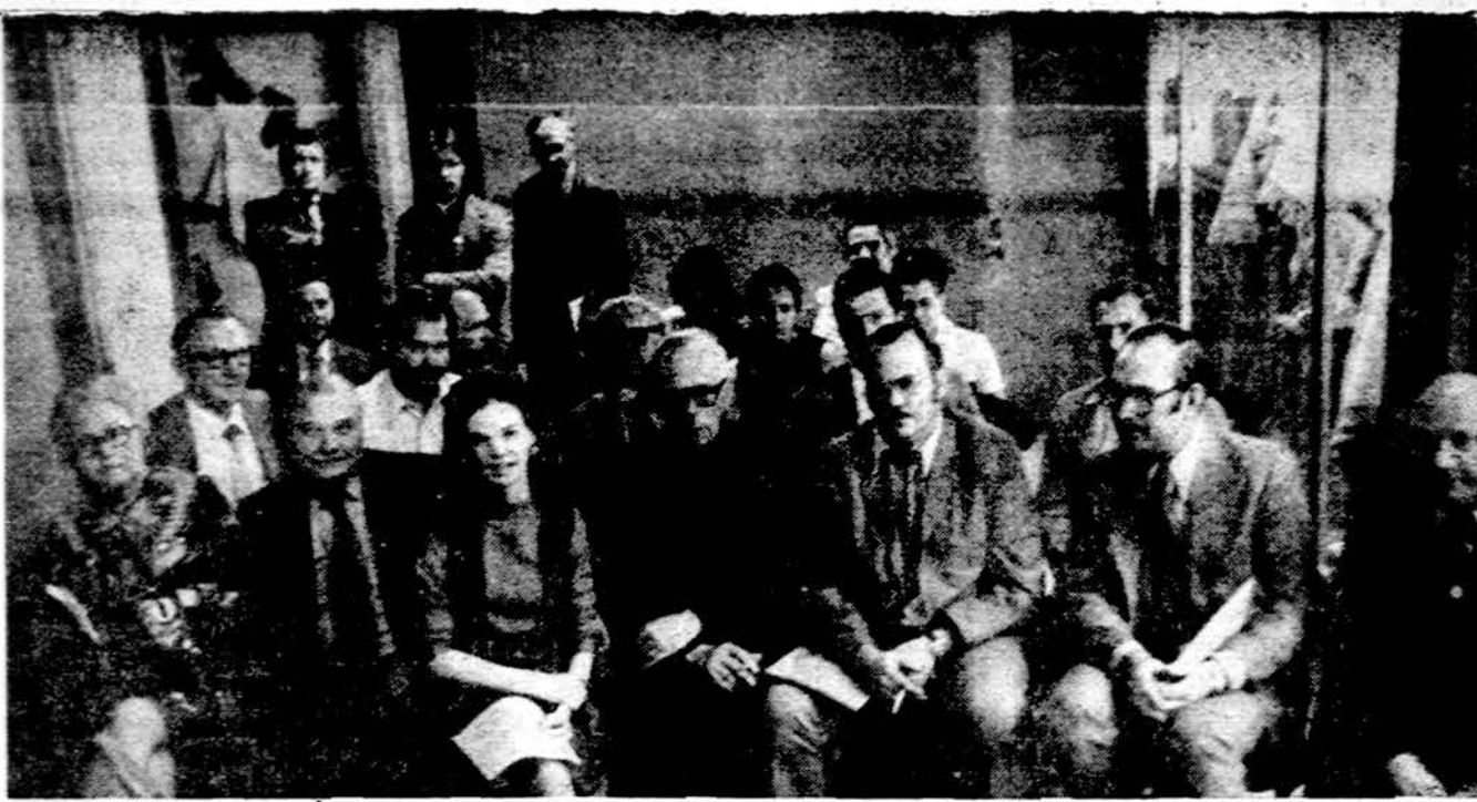
Pavergtų tautų komiteto atstovai Chicagoje spalio 24 d. buvo susirinkę posėdžiui aptarti ruošiamų demonstracijų reikalus prieš sovietų rengiamus prekybinius su Amerika seminarus. Posėdyje dalyvavo ir Amerikos lietuvių pagrindinių organizacijų ALT, LB ir PLJS atstovai.