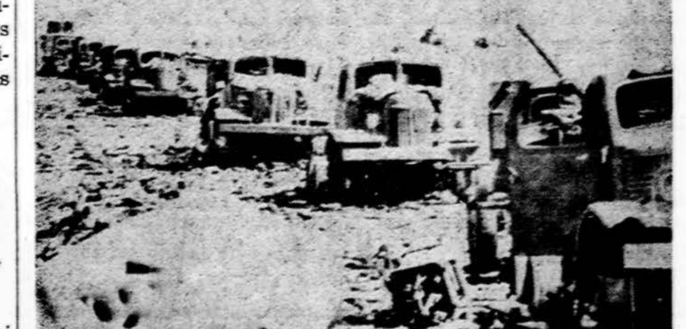
Sudaužytas Sirijos karinio transporto konvojus

Egiptiečiai Izraeliui perdavė tik 30 sužeistųjų, o dar gali būti apie 2.000 sužeistųjų apsupto trečiojo armijoj.