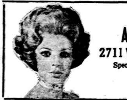
Artistic Hair Stylist