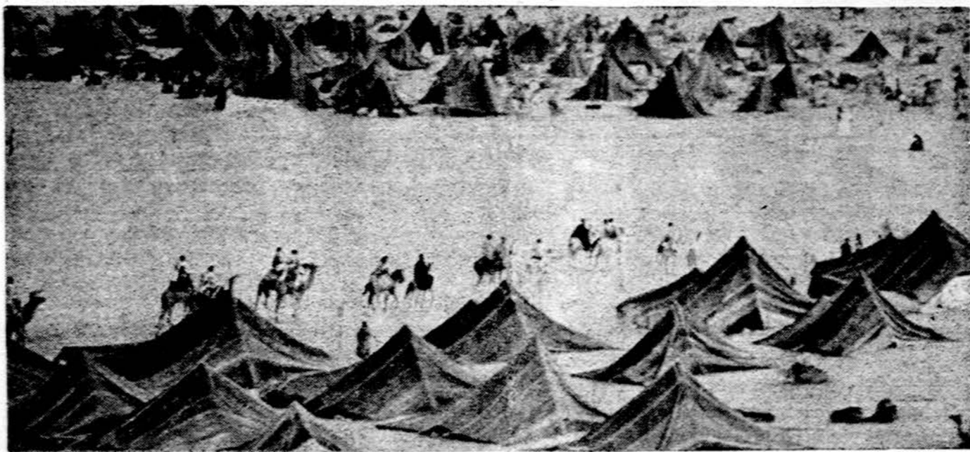
Būdingas vaizdas Maroke. Šis kaimelis mėgsta tigoniską gyvenimą