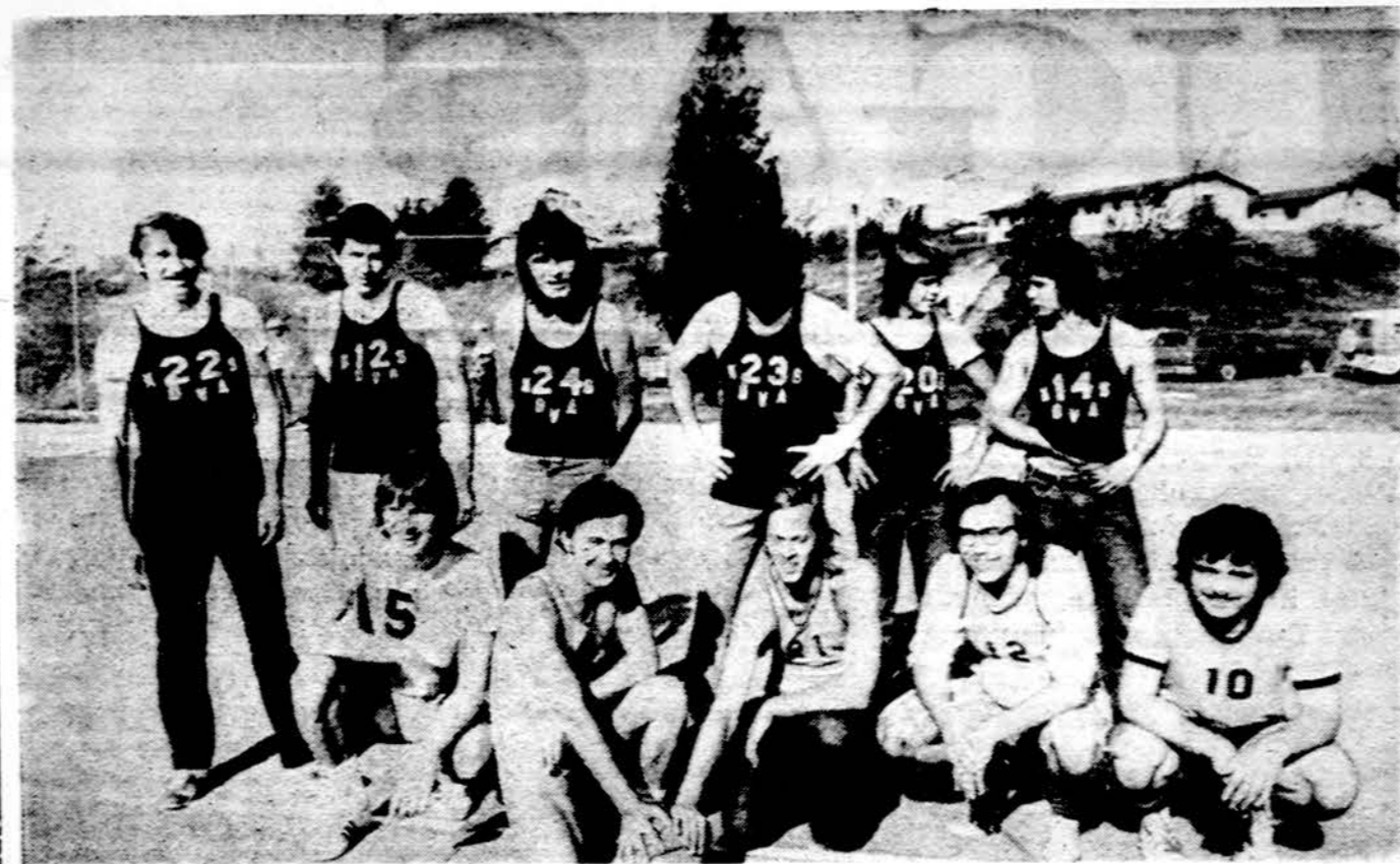
Rudeno išvykoje į Dainavą Detroito jaunimas ir vyresnieji po krepšinio rungtynių — 1973 spalio 14 d.

100 jūd. įvairaus: 1) L. Barzdukaitė (V) 1:39.6 min.