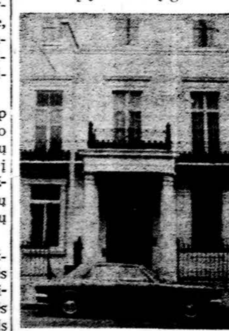
Rytų Vokietijos pasiuntinybė Londone — naujas bošėvikių šnipinėjimo lizdas.

Nebuvo lengva nuo sovietų nusisukti ir paramos ieškoti vakaruose. Nors pastariesiems turės mokėti aukštesnius procentus už finansavimą, bet už paroduomą jiems varį gaus aukš-