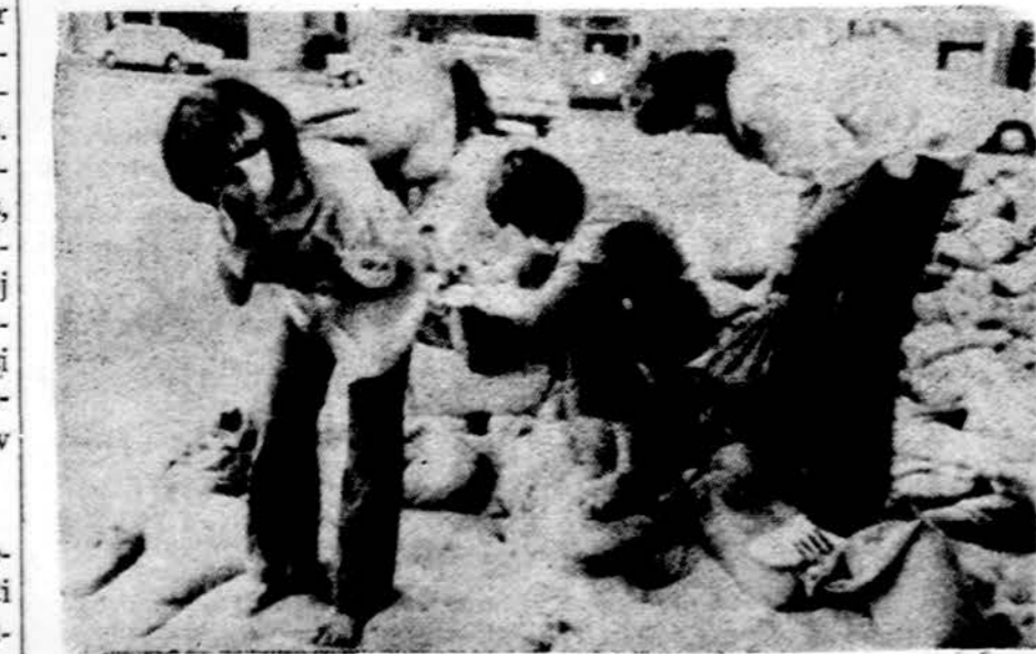
Arabų kraštams užpuolus Izraelį, visa žydų tauta buvo savanoriškai įsijungusi į krašto gynimo darbą, moterys ir vaikai talkininkavo prie sutvirtinimų statybos

WASHINGTONAS. — Vakar jau buvo oficialiai pranešta, kad prezidentas Nixonas sen. Saxbe pasiskyrė valstybės gynėju, o valstybės gynėju pareigas einas Robert Bork pasiskyrė Watergate bylos tardytoju Leon Jaworski.