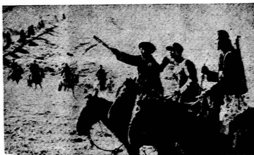
Kinijos-sovietų pasieny. Kinų milicijos raiteliai padeda kariuomenei patruluoti ir sekti kas daroma kitoj pusėj