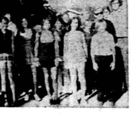
Los Angeles Mačernio kuopos nariai po susirinkimo