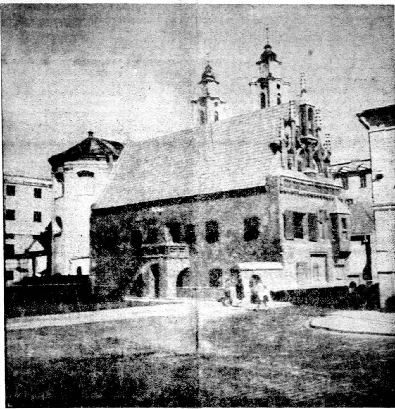
Kaunas, Perkūno namai. Už jų jėzuitų bažnyčios bokštai