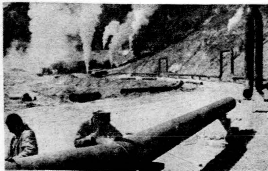
Jiems šiluminės energijos krizės nebus. Geysers, Cal. tiesiami vamzdžiai į karštus šaltinius ir šiltas geizerių vanduo bus pakinkytas

NEW YORK. — Jungt. Tautų Saugumo Taryba turi sunkumų kompleksuodama tarptautinę kariuomenę Vid. Rytams. Sovietų Sąjunga nesutinka įsileisti net tokios jai draugiškos Kanados karinių dalinių. Amerika žada tą patį: neįsileisti Rumunijos.