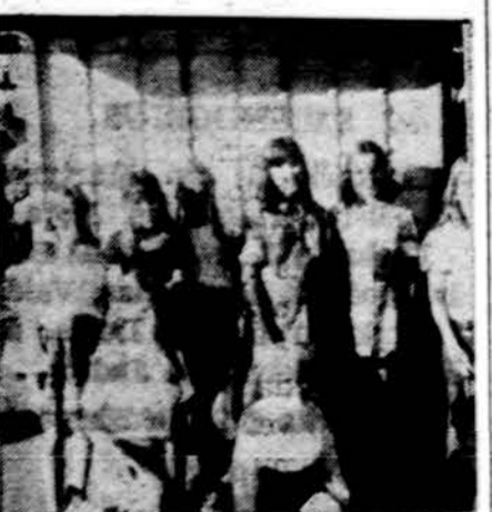
Dalis Los Angeles Mačernio kuopos at-kų — iškylos į Magic Mountain dalyvių