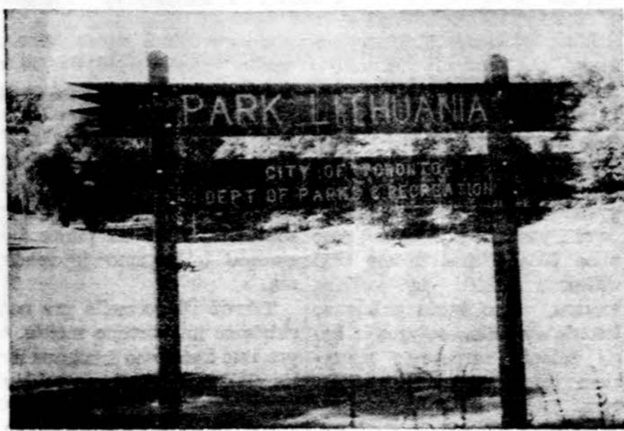
Park Lithuania iškaba Toronte, Glenlake - Keele gatvių sankryžoje