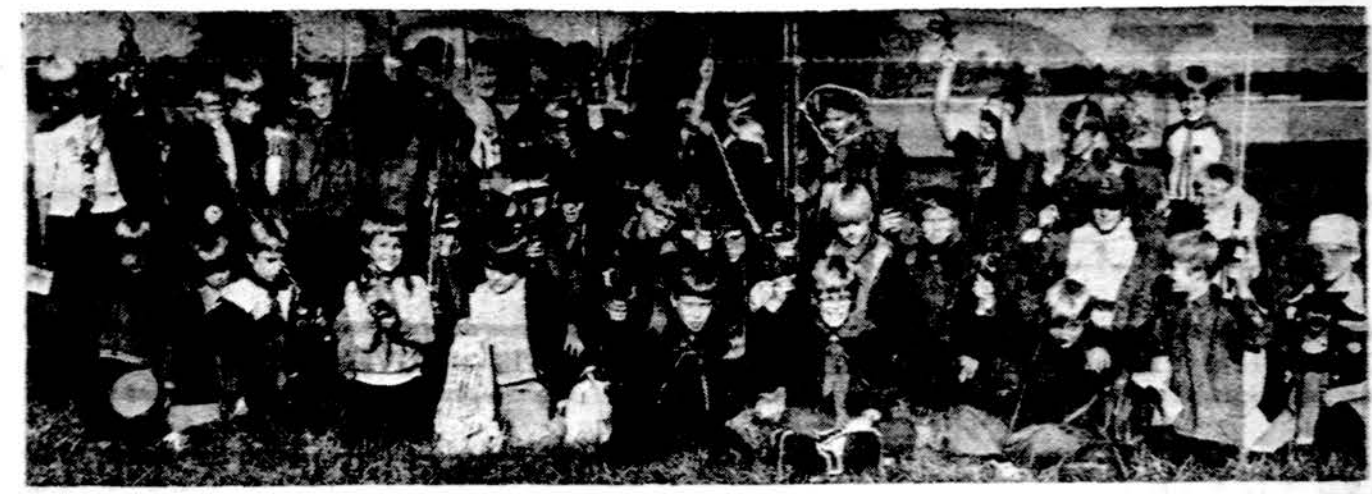
Chicago Lietuvos tunto vilkiukai žuvimo iškyloje.

"Skautybė Kelias" yra skiriamas skautiškos veiklos informacijai. Kviečiame visus vienetus juo daugiau susidomėti ir save jame reprezentuoti.