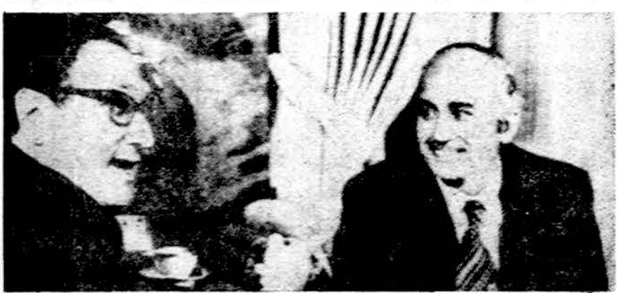
Kai užtarimo ir tarpininkavimo ieškodami Amerikoje lankėsi Egipto užsienio reikalų min. pavaduotojas Fahmi ir Izraelio min. pirmininkė Golda Meir