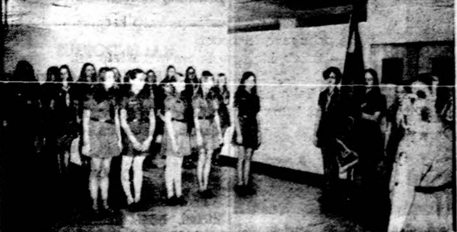
Būrelis Aušros Vartų tunto sesių pasirodusiu šio žodžiu iškilmingoje tunto sueigoje.