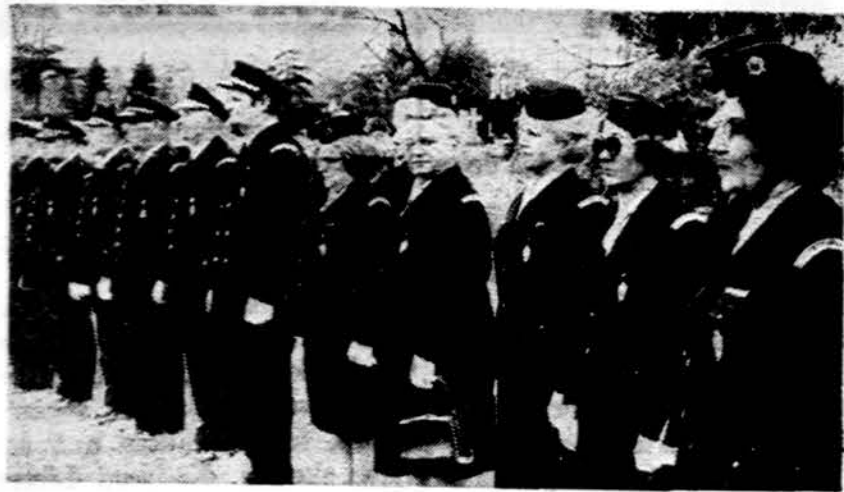
Lietuviai šauliai susikaupto metu Chicagos Lietuvių Sv. Kazimiero kapinėse lapkričio 4 d.

Chicagos priemiesčio laikraštis "Cicero Life" nusiskundžia popieriaus trūkumu. Nebepriima vėliau atsiunčiamų skelbimų, trumpina žinias, kiek galima mažina tiražą. Prenumeratoriams dar visiems nusiūnčia, bet mažina numerius, paliekamus kioskuose ir verslo vietėse. Laikraštis pažymi, kad tebestreikuoja popieriaus fabrikai Kanadoje ir gado nematyti. Esą, nenumatoma, kad prieš Kalėdas padėtis pagerėtų.