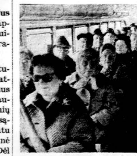
Iš Marquette Parko lietuviai važiuoja protestuoti prieš komunistus Chicago miesto centre.