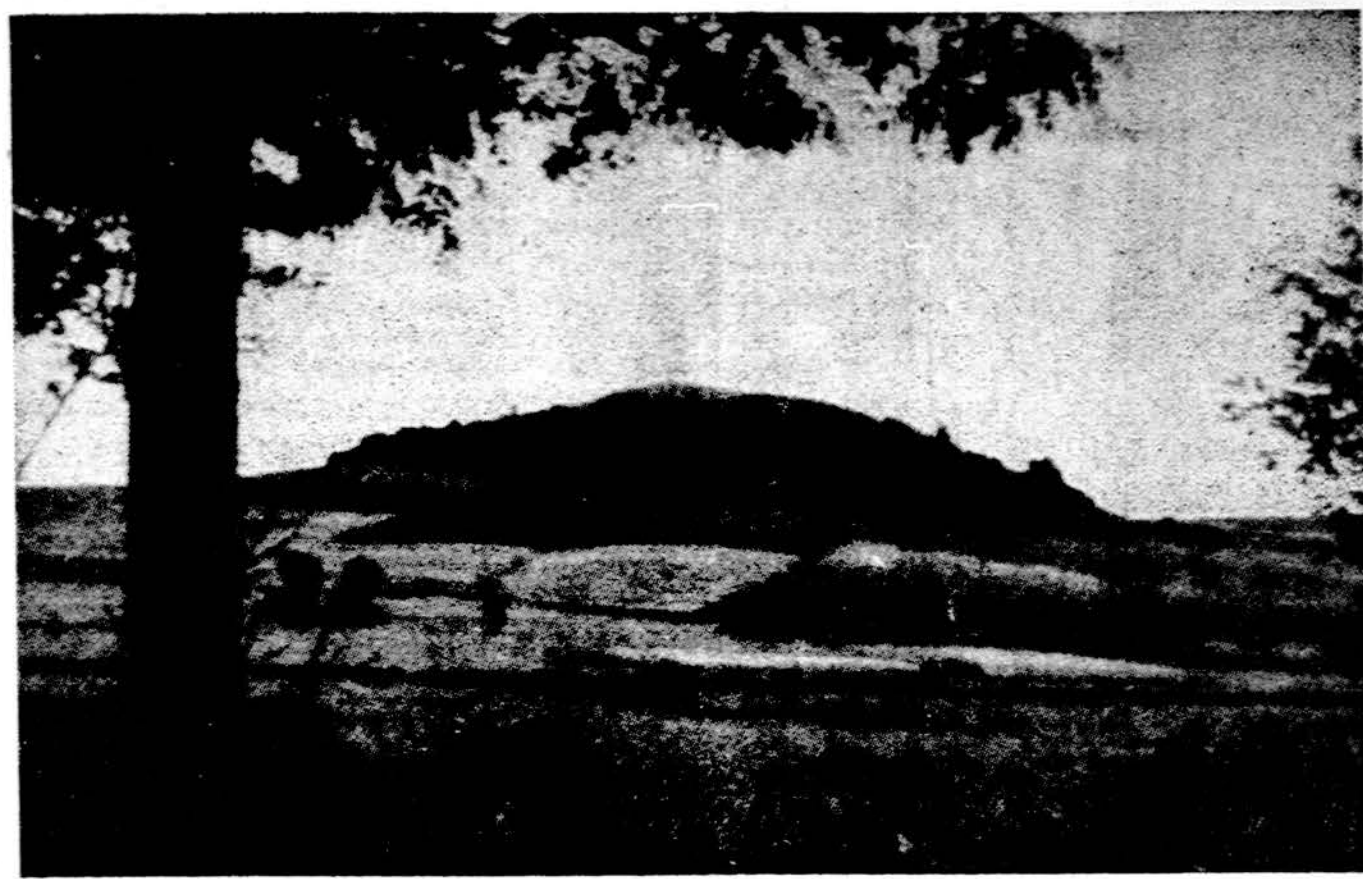
Satrijos piliakalnis. Luokės vlsć, Telsių aps.

Sadatas neabejotinai talentin-gas arabų vadas ir turj įtakos ne vien tik namie. Kissingerio ir apskritai Amerikos interesas yra jį išlaikyti ir apsaugoti nuo didesnio pralaimėjimo fronte, tai suprantamas ir paspaudimas Izraelio bei kitos nuolaidos.