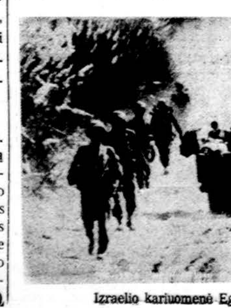
Izraelio kariuomenė Egipto žemės duikėtais keliais

Pradžioje autorius apžvelgia so vietinės propagandos pastangas Vakarų pasauly Sovietų Sąjungą pavaizduoti kaip valstybę, sie-kiančią įgyvendinti pilną pilie-čių laisvę ir demokratiją, tačiau tarp tos propagandos ir gyven-i-mo tikrovės yra neperžengiama bedugnė. Šiuos tvirtinimus autorius pagrindžia akivaizdžiais pas-tarųjų metų faktais ir cituoja Sa-charovo pareiškimą, jog "sovietų socializmas yra tušti žodžiai, su-litinė propaganda, siekianti su-klaidinti žmones tiek krašto vi-duje, tiek užsienyje. Sovietinis so-cializmas — tai absoliutinė poli-tinės valdžios monopolija, valsty-binis kapitalizmas, kuriame vals-tybė užvaldžiusi visą ūkį, yra pati blogiausia kapitalistinio išsivys-tymo forma. Tarp kapita-listinio pasaulio ir sovietų sukur-tojo valstybinio kapitalizmo yra tik vienas skirtumas, kad mes sa-vo bendruomenėje esame pasiekę pačią kraštutinę ribą, prie kurios