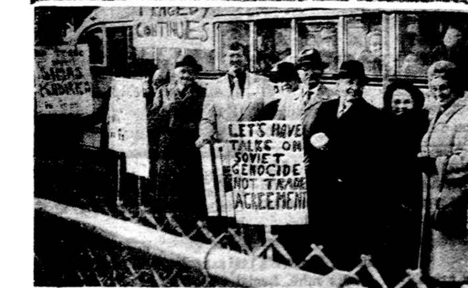
Lietuviai Crigajoje demonstruoja prieš prekybos sutartis su Sov. Rusija

MOLD MAKERS. Exper. on Plastic and Die Cast Molds GENERAL MACHINISTS To work in Mold Shop JANITOR — Will Consider Mature Man Day Work — 40 hours COMPANY PAID HOSPITALIZATION Pringe Benefits — Air Conditioned Shop TRI-PAR DIE AND MOLD CORPORATION 221 King St., Elk Grove Village, Ill. Tel. 439-4533