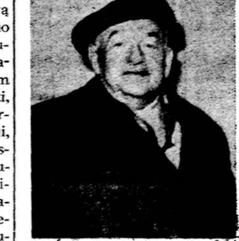
Buvęs Sovietų šnipinėjimo organizacijos vadovas Paryžiuje Leopold Treppner atsakė grįžti į Sovietų Sąjungą ir vakariečių šalis suteikė daug žinių apie Sovietų šnipinėjimą bei šnipus trylikoje kraštu...