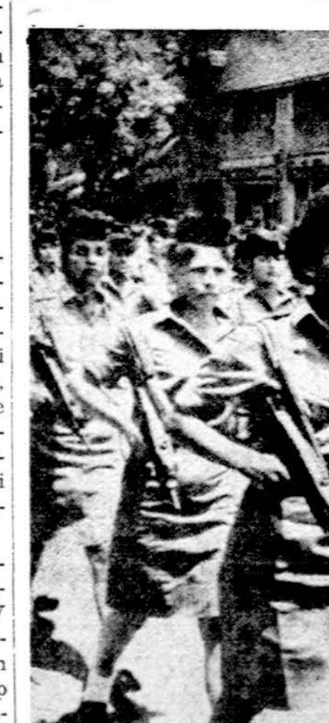
Izraelis permaža valstybė, kad kariuomenei pakaktų vien vyrų, tai karinė prievolė liečia ir moteris. Jaunų merginų dalinys žygiuoja Jeruzalės gatvėmis.

Bet gal pati svarbiausioji Vid. Rytų karo pamoka yra pade-monstravimas sėkmingumo masinio aprūpinimo karo reikmenimis, kaip tą įvykdė Sov. Sąjunga ir JAV. Tai parodė, kad gerai organizuotas karo reikme-