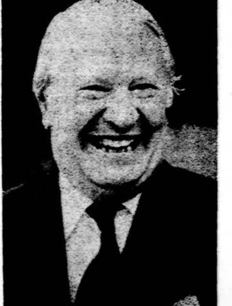
Angliją palietė džiuliais ekonomini s sunkumai. Premjeras Edward Heath stengiasi sulaukyti algų ir kainų kilimą