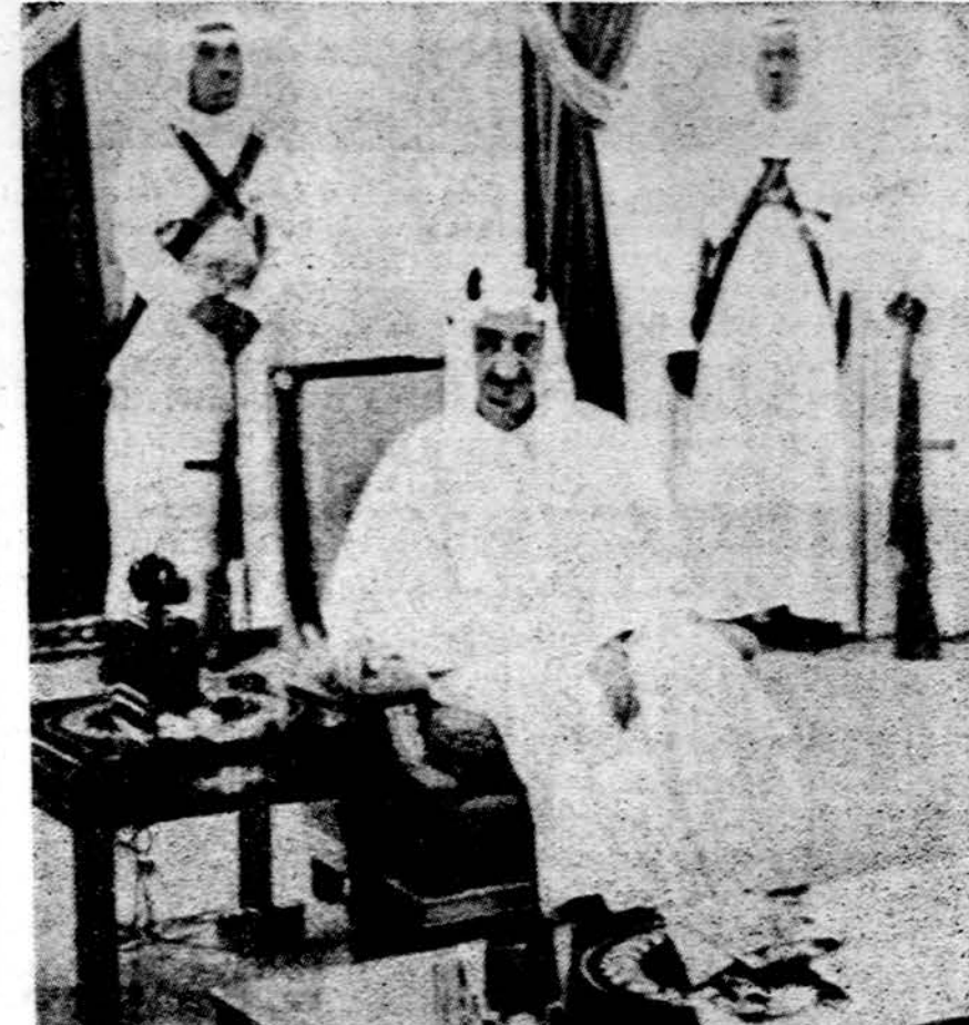
Saudi Arabijos karalius Faisal, pradėjęs spausti Vakarų Europą, nutraukdamas naftos tiekimą

MASKVA. — Sovietų "Pravda" be jokių komentarų paskelbė Nixono pareiškimą, kad jis nežada atsistatydinti.