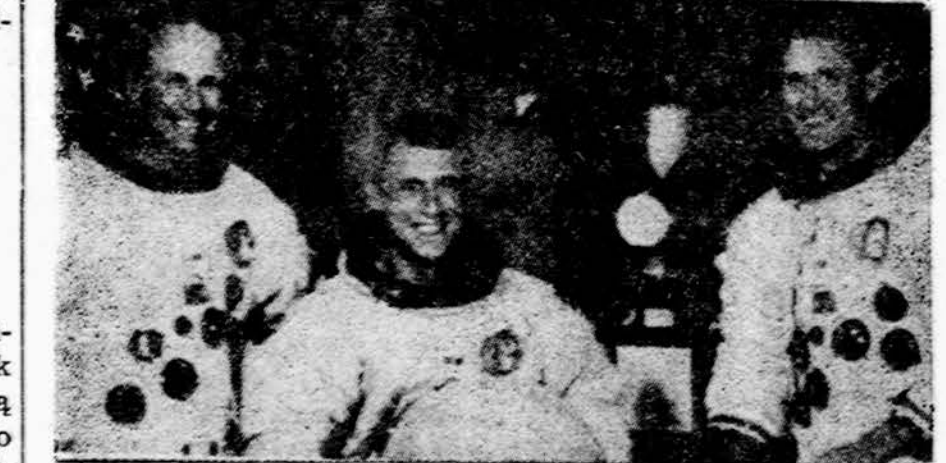
Trečioji astronautų pamaina. Gerald Carr, Edward Gibson ir William Pogue, kurie nuo lapkričio 15 erdvių laboratorijoje gyvens porą mėnesių

WASHINGTONAS. — Atstovų rūmuose didelė balsų dauguma buvo patvirtintas sumanymas Penn Central ir dar šešias kitas bankrutuojančias geležinkelio linijas sujungti ir joms teikti federalinę pagalbą.