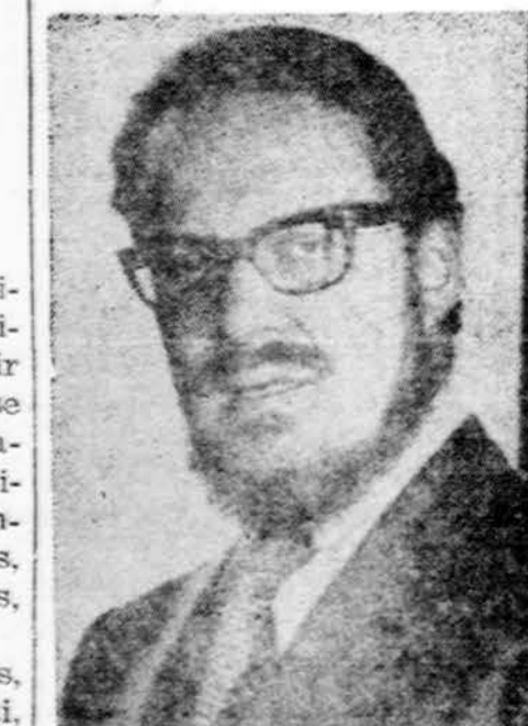
Robert H. Bork, laikinai einantis valstybės gynėjo pareigas