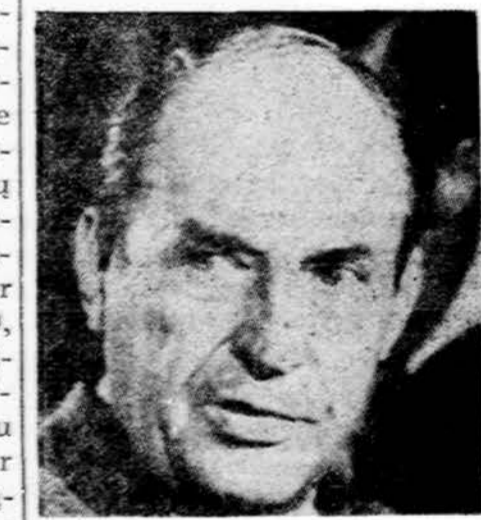
Sen. William Saxbe, paskirtas, bet dar nepatvirtintas valstybės gynėjo pareigoms

Dalnai saulėta, šilčiau, apie 60 laipsnių.