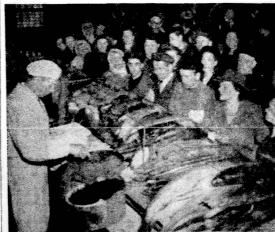
Sovietų pavyzdinė žuvies ir kavario krautuvė Maskvoje. viena nedaugelio, kur netrūksta prekių, bet pirkėjų dar labiau

Jeigu sunkoka pažinti, kas yra tas, kuris tau šiandien priskirtas, pataria laikas nuo laiko sustoti prie menkų vitrinų ir pasidaryti. Vitrinų, kaip veidrody bus gali-