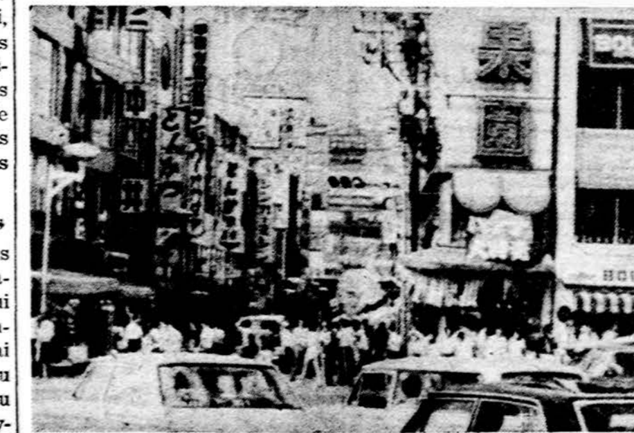
Didžulius Tokio miestas, Japonijos sostinė, yra labai tankiai gyvenamas. Jo aplinka labai užteršta. Japonai ieško būdų minėtoms ir kitoms blogybėms išvengti.

AP žinių agentūra ir spaudos bei televizijų stočių tarnyba iš Kairo pranešė, kad "yra vilčių ir daug optimizmo, jog Kissingerio taikos misija Artim. Rytuose šį kartą tikrai gali pavykti — pralaužti arabų ir žydų užsispyrimo ledus". Yra nuomonė, kad Egiptas pamatė ir įsitikinimo, jog taikai pasiekti tarp žydų ir arabų būtinai reikia Amerikos. Ginklų jie gauna iš Maskvos, bet taikos su jais nepasiekė. Amerika turi Artim. Rytų taikos reikalų raktus ir,