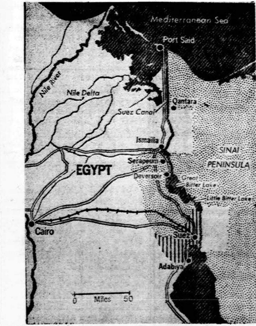
Sueso kanalas ir Egipto - Izraelio paliaubų linija. Dryžuotas ruožas (apačioje) — ginčijamoji sritis, egiptiečiai tvirtina, kad ją Izraelis užėmė jau po paliaubų įsigalėjimo, po spalio 22.

Su geriausiais linkėjimais, HENRY A. KISSINGER