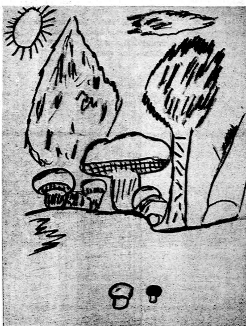
Jau baigiasi grybų sezonas.

Kartą gyveno žmogus, kuris vedė merginą, kuri turėjo auk-sinę ranką. Jis norėjo, kad ji numirtų. Ir ji mirė. Kai buvo kalbamas rožinis už ją, jis bu-vo liūdniausias iš visų ir buvo juodžiausiai apsiirengęs. Naktį jis žmoną iškasė iš žemės ir nukirto jos auksinę ranką. Gr-žo namo ir padėjo ranką po pa-