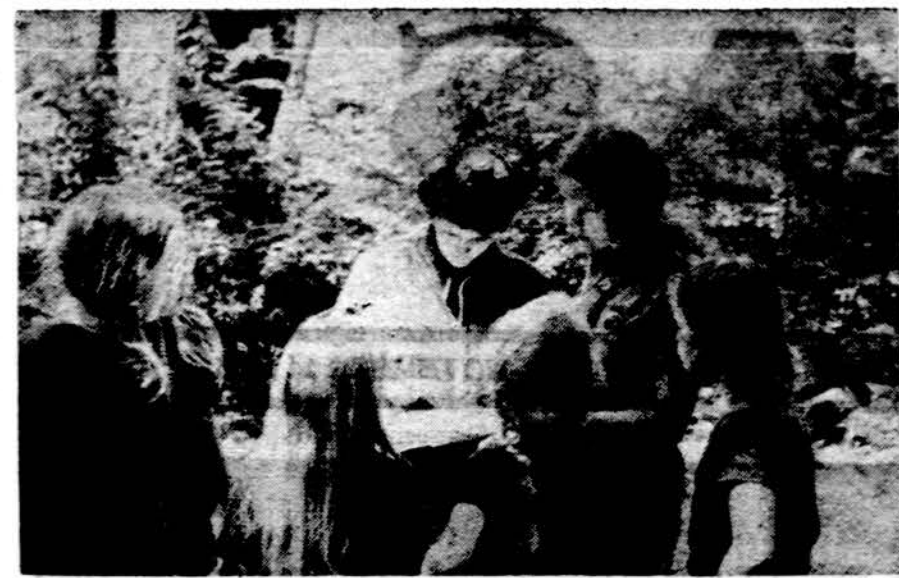
"Ziežirbos" stovykloje paukštytės atidžiai klausosi vadovų nurodymų.

Prašau visas vadoves artimiausiu laiku prisijusti man savo darbo planų kopijas. Dėkoju Cleve-