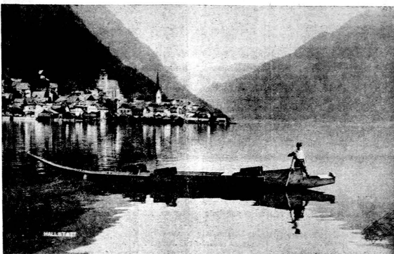
Austrijos Alpe. Hallstatt miestas ir ežeras

WASHINGTONAS. — Šiandien Nixonas žadėjo pasirašyti įstatymą, kuris leidžia per Alaską, iš šiaurės į pietus, praktiškai netiesiogiai 789 mylių ilgumo. Darbai užtruktų vis tik ilgai, ir geriausiu atveju linija būtų baigta po ketverių metų.