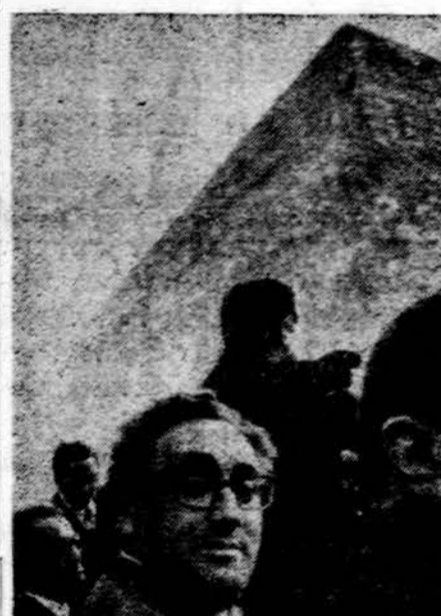
Kai Kissingeris lankėsi Kaire, egiptiečiai jam parodė piramides

Prieš kelis metus Sartre yra lankęsis ir Lietuvoj, o kaip labai žymus, buvo nuvežtas ir į Klaipėdą bei Neringą. Tada jis dar nebuvo vadinamas "antikomunistu".