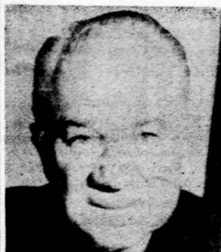
Leon Jaworski, prezidento paskirtas ir pradėjęs eiti Watergate tarytojo pareigas

Kongresmanas Derwinski (Illinois), didelis Nixono rėmėjas, atsakė dalyvauti Nixono priėmime. "Jeigu Nixonas nori žinoti Kongreso nuomonę, jis turėtų to klausyti prieš penkerius metus". Jis daugiau nepatenkintas ne tiek Nixono užsėdarymu nuo Kongreso, kiek tais žmo nėmis, kuriais apsisėtas ir jie jį izoliuoja. "Net ir Haig nėra geresnis, nei buvo Haldeman ar Ehrlichman".