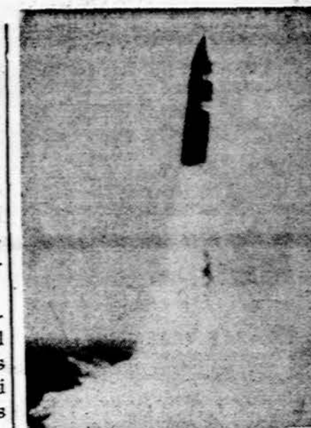
Amerikos karinė raketa "Poseidonas". Pavojaus atveju gali būti paleista į priešą per 15 sekundžių

Šitas aplinkybes numato Amerikos vyriausybė, tą padėtį supranta ir Izraelis, todėl ir turi priimti Amerikos tariamą tikrą spaudimą. Juo labiau, kad šis karas bent iš pradžių parodė du visai nelauktus dalykus. Pasi-