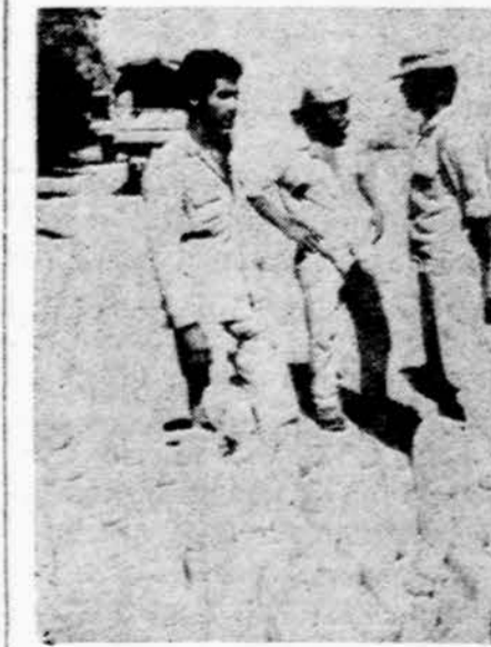
"Is tikrųjų mes neturėtumėm Sadatui padėti", sako Izraelio kareiviai, pristatydami vandenį 3-ajai Egipto armijai

COLD BAY, Alaska. — Pavlovo ugniakalis Aleutų salose, 8,215 pėdų aukštumo, pradėjo veikti ir lavą išmeta iki 300 pėdų.