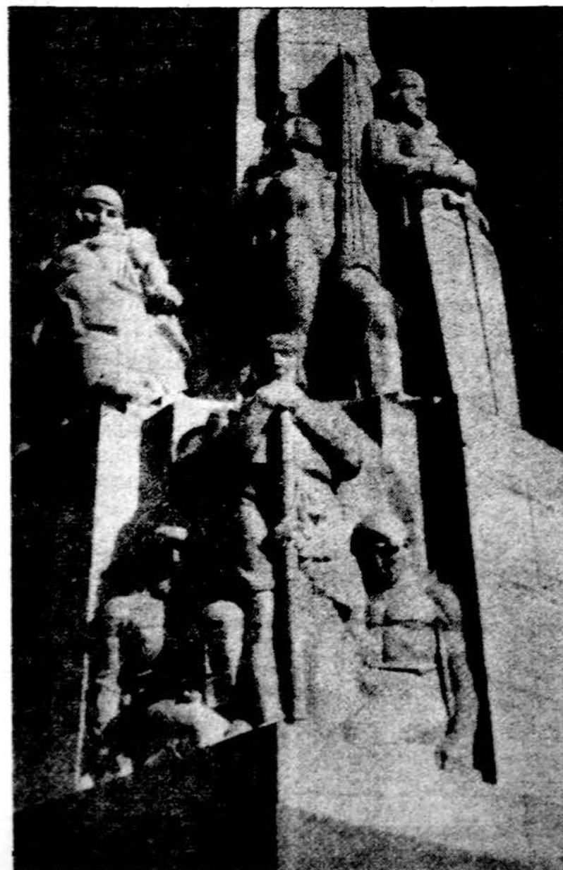
Latvijos Laisvės paminklo Rygoje detalė. Rytų, lapkričio 18, laisvojo pasaulio lietuviai švenčia 55 metų sukaktį nuo nepriklausomybės paskelbimo

Daugiausia saulėta, bet vėsu, apie 40 laipsnių.