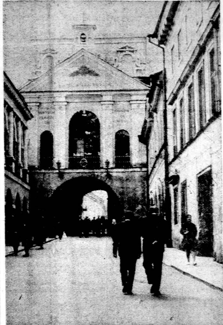
Aušros Vartai, kaip jie atrodo šiandien

Toji Nixono kalba buvo pirmoji grandinėje visų kitų, kuriuose bandys atgauti tautos pasitikėjimą. Kitos vietos numatytos Orlando, Fla., kur jis kalbės Disney World, paskui Macon, Ga., Memphis, Tenn. Disney World kalbės laikraščiu vyriausiųjų redaktorių konferencijoje ir atsakinės ji jų paklausimus. Sesija šiandien bus perduos per televiziją, tik nežinoma tiksliai valanda. Memphis bus respublikonų gubernatorių konferencija ir ji nebus vieša.