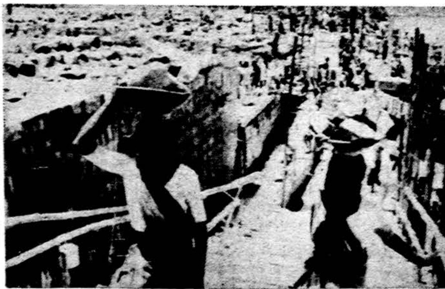
Vienos užtvankos statybos darbai Indijoje. Sunkiausi darbai atliekami ne mašinomis, kurių labai trūksta, bet rankomis, kurių krašte yra perdaug. Darbininko dienos uždarbis siekia tik 10 amerikoniškų centų.

Švietimo departamentas pa- rūpino 6,984 dol. federalinės paramos Chicago bibliotekai, kad suruoštų bibliotekininkų kursą. Pati biblioteka tam skirs 6,000 dol., o Rosary kole- gija paripins mokslo priemonių ir patarnavimų 1,599 dol. vertės. Kursuose bus ruošiami tarmautojai Chicago bibliote- kos padaliniams, skyriams, kny- gų punktams, kurių iš viso tu- rima net 147.