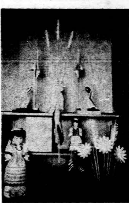
Dovanų rinkinys "Draugo" administracijoje kas savaitę didėja. Dabar galima gauti dovanų giminėms ir pažįstamiems šv. Kalėdų proga.