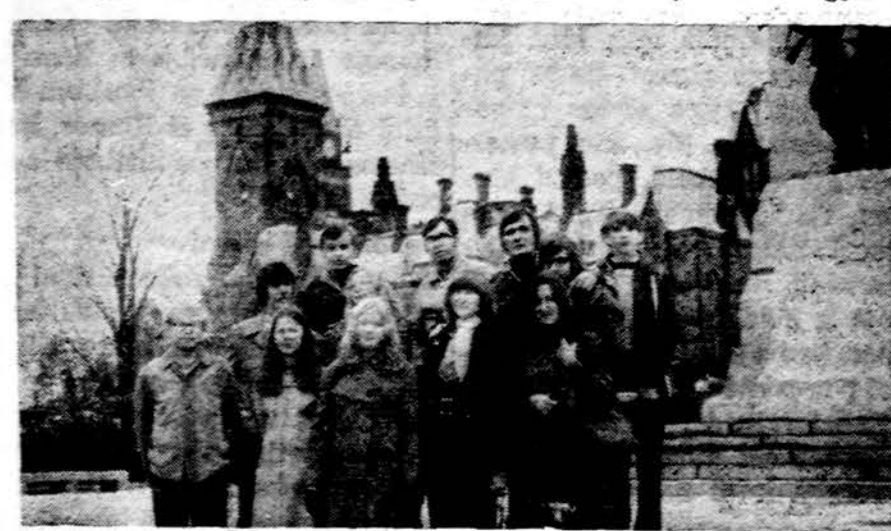
Dalis Montrealio ir Ottavos studentų ateitininkų prie valstybinių pastatų Ottavoje

Jaunimo veikla šiais mokslo metais yra pagyvejusi. Jaunučių ir jaunių vadovai turi paruošę programas visai mokslo metų veiklai. Vyresnieji moksleiviai taip pat vykdo programą, kurią jau turėjo paruošę prieš vasaros atostogas. Taip pat reikia pasidžiaugti centro valdybos rūpes-