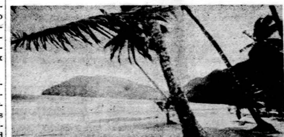
Tahiti, paskutinis rojus kampelis žemėje, šalia kurio prancūzai daro atominius sprogdinimus

Nežiūrint to, spaudoje jau buvo žinia, kad ir prancūzai su savo atominiais bandymais jau rengiasi leisti gilyn į žemę. Ieškoma tinkamos vietos Prancūzijos Polinezijoje Pacifike, kur jie iki šiol vykdomi atmosferoje.