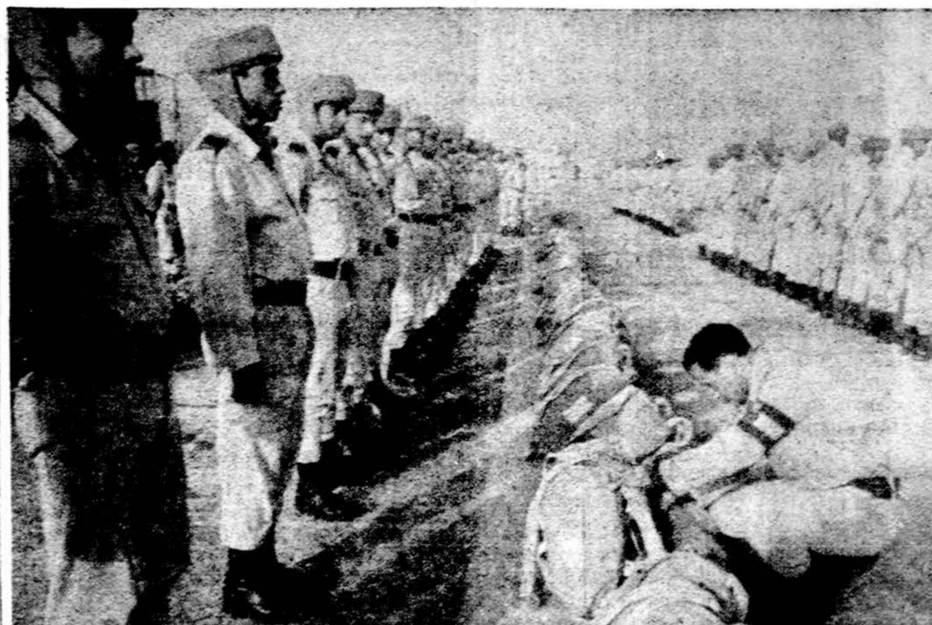
Egipto kariuomenės parašūtininkai šiame kare