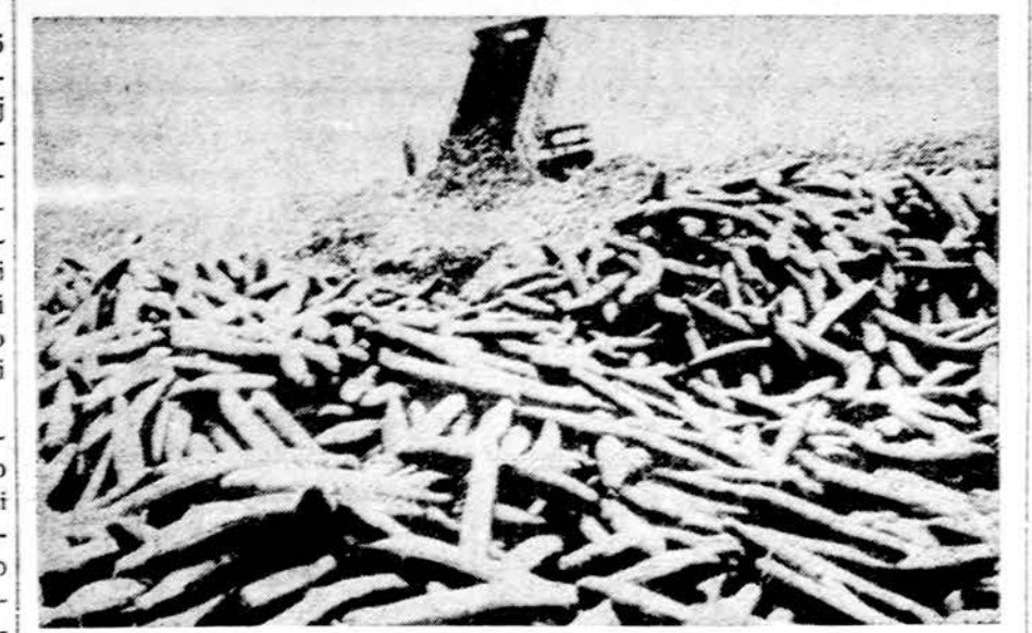
Olandijoj šiais metais buvo didžiulis agurkų derlius. Perteklių pardavė kitiems Europos Bendrosios rinkos kraštams.

Gazolino stotys prerijose pasitikdavo mus mandagiai. Visada rūpestingai nuvalydavo langus. Jei nori — patikrindavo alyvą. Bet jau kainos, kainos! Pakelėse daugiausia suksis apie 60 centų už galioną (tiesa, viena kvorta didesnį, negu U. S. galionas). Miesteliuose ir miestuose dvim-trim centais pigiau, bet kas gi tyčia nuo transkanadinio suks penkias mylias į šoną, kad pusė dolerio už gazoliną sutauptis? Gerai dar, kad mano Dodge'as paprasto, ne pagerinto — etilio reikalauja. Už tą pagerintą turėjai mokėti apie 63-65 centus galionui. Tik namo grįždami, vieninteliam mieste — Winnipege pylėme gazoliną po 50 centų galionui, nes ten vyko kainų karas. Beveik visos gazolino sto-