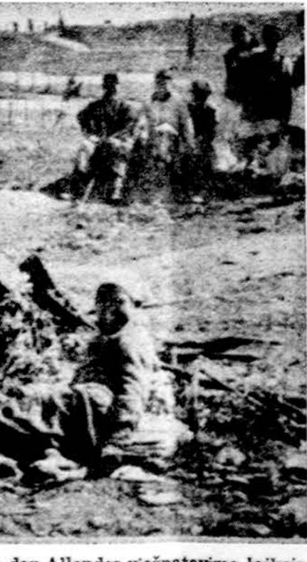
Skurdas Čilėje. Nuotrauka daryta dar Allendes viešpatavimo laikais

WASHINGTONAS. — Saudi Arabijos naftos ministeris Ahmed Yamani ir Alžirijos pramonės ministeris Belaid Abdes-salem vakar atskrido į Ameriką ir čia pasiliks apie savaitę. Jie aplankė Vakarų Europą ir Britaniją, Prancūzijai bei Ispanijai pažadėjo nesumažinti naftos tiekimo 5 proc., kaip buvo numatyta sausio mėnesiui. Tie kraštai arabams esą "draugiški". Jie tirs, kiek galima išsiderėti draugiškumo ir Amerikoj.