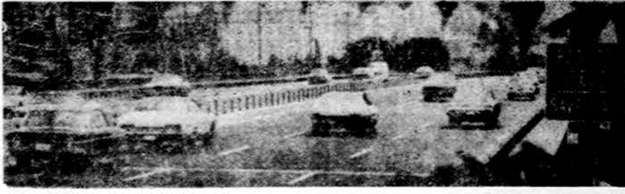
Išpėjimai Amerikos keliuose: taupykite gazoliną

KINSHASA. — Zaire (buv. Belgijos Kongo) prezidentas Sese Mobuto nacionalizavo žemės ūkio kompanijas, bet žadėjo buvusiems savininkams atlyginti. Nesuvalstybino tik medvilnės ir palmių aliejaus pramonės, bet visą kitą, kaip gyvulių ir grūdų plantacijas bei jų produktų prekybą. Zaire vario kasyklos bus suvalstybtintos iki 1980 metų.