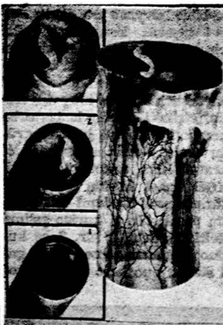
Cia matyti vis didėjantis cholesteroliu užkimas žmogaus didžiosios arterijos - aortos.

Sveikatos priešinį pažinimas gali būti nesunkus ir neišlaidus. Būtina suraskime tuos priešinį vidutinio amžiaus žmogui. Toliau daugiausia galima bus padėti. Net nereikia guldyti paciento ligoninai, net ir be nuodugnau apžiūrėjimo, o tik kreipti dėmesį, kur reikia, galima surasti sveikatos priešinį pas kiekvieną mūsų. Pirmiausia, reikia surašyti paciento medicinišką istoriją. Sužinome iš jos, ar paciento artimi gimines, jaunesni negu 60 metų, turėjo cukralingą diabetą, pakeltą kraujospūdį, sirdies ataką ir stroką - vienos kūno pusės paralyžių. Sužinoma iš paties paciento, kiek jis rūko, kaip jis persivalgo ir kaip jis užsisėdi, nejuda, o tik sėdėdamas visą miestą apkalba. Sužinome iš paciento apie jo emocijinį - nervinį pastovumą, apie jo namus bei darbovietėje darbo sąlygas. Vienam yra namai pragarai. Pvz. tokia žmona, kaip aro profesionalo po tris šimtus dolerių niekam išleidžia, o vaikų nedengia, nemaitina ir namuose nebūna. Narkotikų prisėmus akcidentą po akcidento turi, o vy-