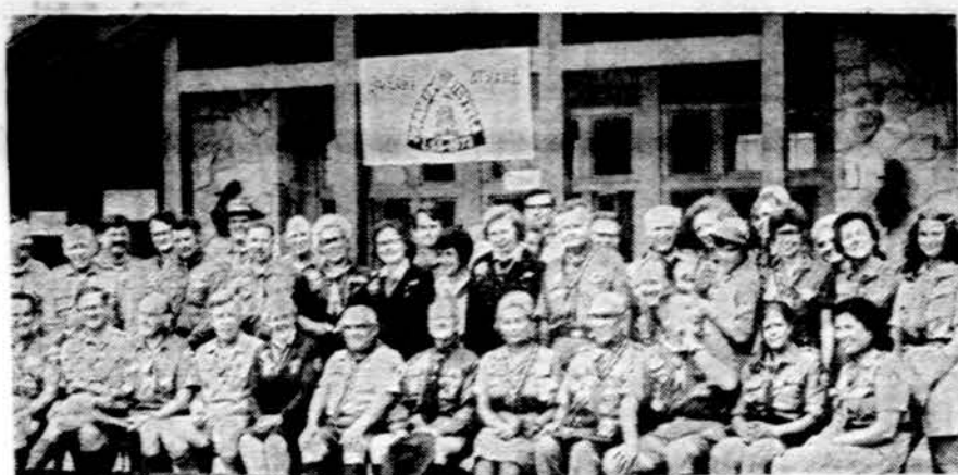
Lietuviai skautai palaiko ryšius su kitų tautybių skautais. Čia matome būrį lietuvių, latvių, estų ir lenkų skautų vadovų, susirinkusių pasitarimui Rock Creek, Ohio.