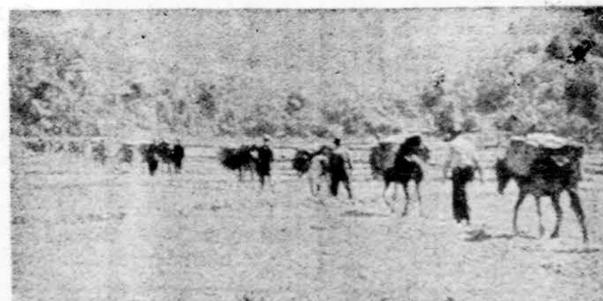
Opiumo transportacija Burmoje. Kai Turkija, Iranas, Tajas ir kiti kraštai pradėjo drausti savo ūkininkams auginti opiumą, tai Burma iš to žada padaryti didelį biznį. Jau dabar per metus į užsienį eksportuoja virš 700 tonų narkotikų.

CANTON, Ohio. — Kad "amžinus" dalykus gali sugriauti labai menkas reikalas, yra šio miesto pavyzdys. Miesto parko yra John F. Kennedžio memorialinis fontanas, prie kurio degė Amžinoji ugnis. Dabar ugnis užgesinta taupant alyvą, o alyvos ne tiek daug ir sunaudojavo — tiek, kiek reikia apšildyti vienos šeimos namui.