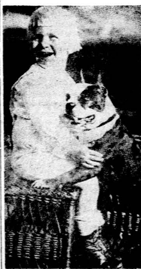
Gerald Fordas, kai buvo tik 3 m.

Savo žodyje viceprezidentas Fordas pasakė, kad jis nėra Lincolnas, bet Fordas, ir tokios iškalbos neturi, bet pažadėjo daryti geriausią, ką jis gali, ir kalbės trumpai ir atvirai. Nuo šiol jis nežiūrės, kad čia respublikonai ar demokratai, įstatymus leidžiantieji, vykduojantieji ar prižiūrintieji organai, bet tik amerikiečiai. "Aš matau tik amerikiečius, kurie mokyti, mokyti, dirba ir aukojasi savo kraštui ir savo vaikams. Aš matau amerikiečius, kurie drąsiai sutiko pavojų gruodžio 7 prieš 32 metus".