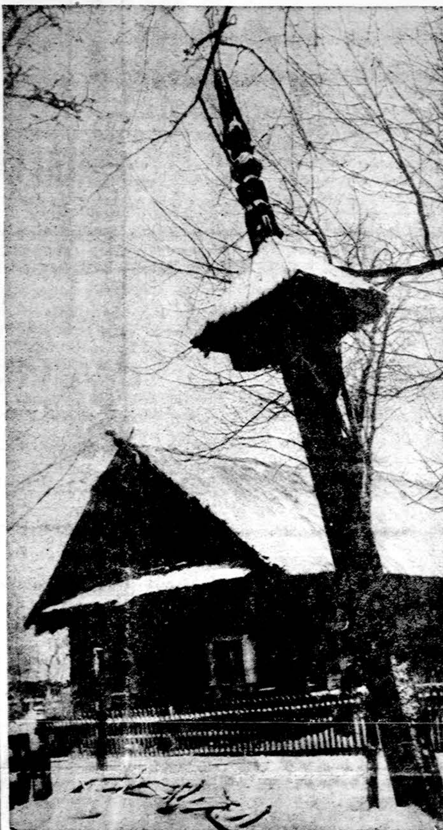
Palinkės nuo metų naštos. Pelyšių km., Šimonių vls., Panevėžio aps.

Spalio mėnesį išėjo iš spaudos pirmasis numeris naujo Rytų Europai skirto leidinio: "East Europe (USS Geography: A Newsletter of the Committee on Eastern Europe of the Association of American Geographers)". Šis leidinys reikalingas kruopščios pabaltiečių akademių ir politikų peržiūros, nes amerikiečių geografai kartais susipainioja politiniuose klausimuose. Prenumeratos ir kitais reikalais kreiptis į Thomas M. Poulsen, Editor, Dept. of Geography, Portland State University, Portland, Oregon 97207. (E.)