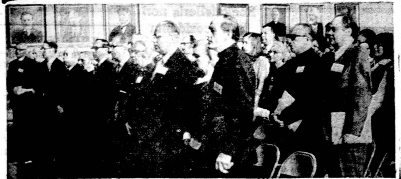
Chicagoje buvo sėkmingai pravaistas II Mokslo ir kūrybos simpoziumas. Jo pranešėjų bei dalyvių skaičiuje buvo nemaža ir ateitininkų.