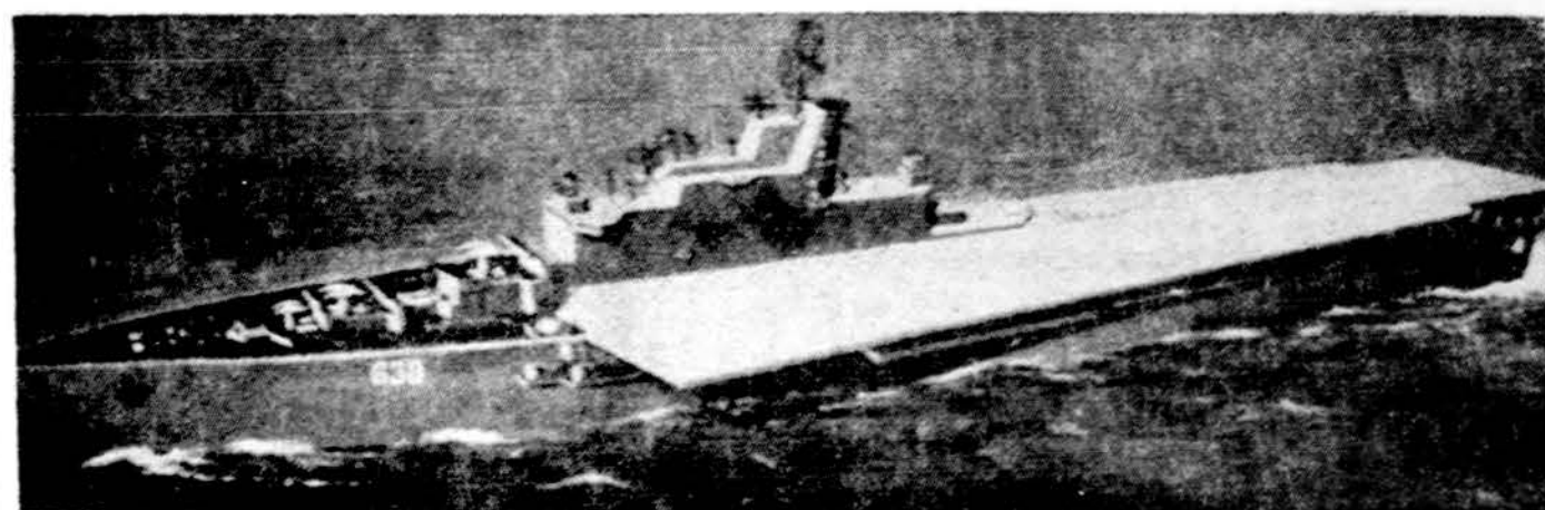
Baigiamas statyti sovietų pirmasis lėktuvnešis "Kiev" (Piešiny)