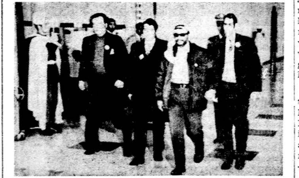
Palestinos arabų partizanų vadas Arafatas lankėsi Alžirijoje. Čia jis eina lydimas sargų

Prieš tokį Kissingerio pareiškimą Tel Avive kilo demonstracijos. Žydai Kissingerį apšaukė antruoju "Chamberlainu", pardavusiu Hitleriui Rytų Europą. Yra manančių, kad taikos reikalai neina taip, kaip pasirodė