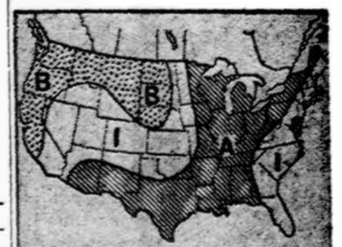
Amerikos Oro biuras (National Weather Service) pranašauja šiltą žiemą "A" pažymėtoje Amerikos dalyje, "B" šaltesnę nei normaliai ir "T" — ypatingų pasikeitimų.

Berlynas. — Rytų Vokietijos Varnemiundeje sovietams pastatytas prekinis laivas, pavadinintas "Salvatore Allende" vardu.