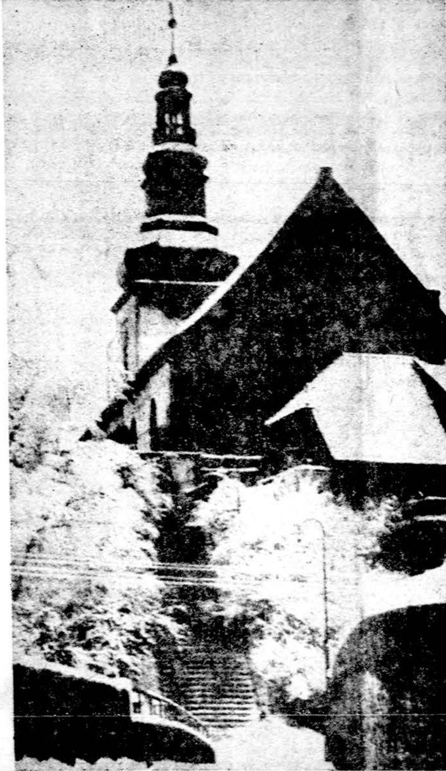
Darkiemis Mažojoje Lietuvoje, Donelaičio gyventoji apylinkė

TUNIZAS. — Tunizijos Suso provincijoje rastas nepaprastas lobis, daugiau nei 41 tūkstantis įvairių varinių monetų, išgulusių žemėje 17 šimtų metų. (E.)