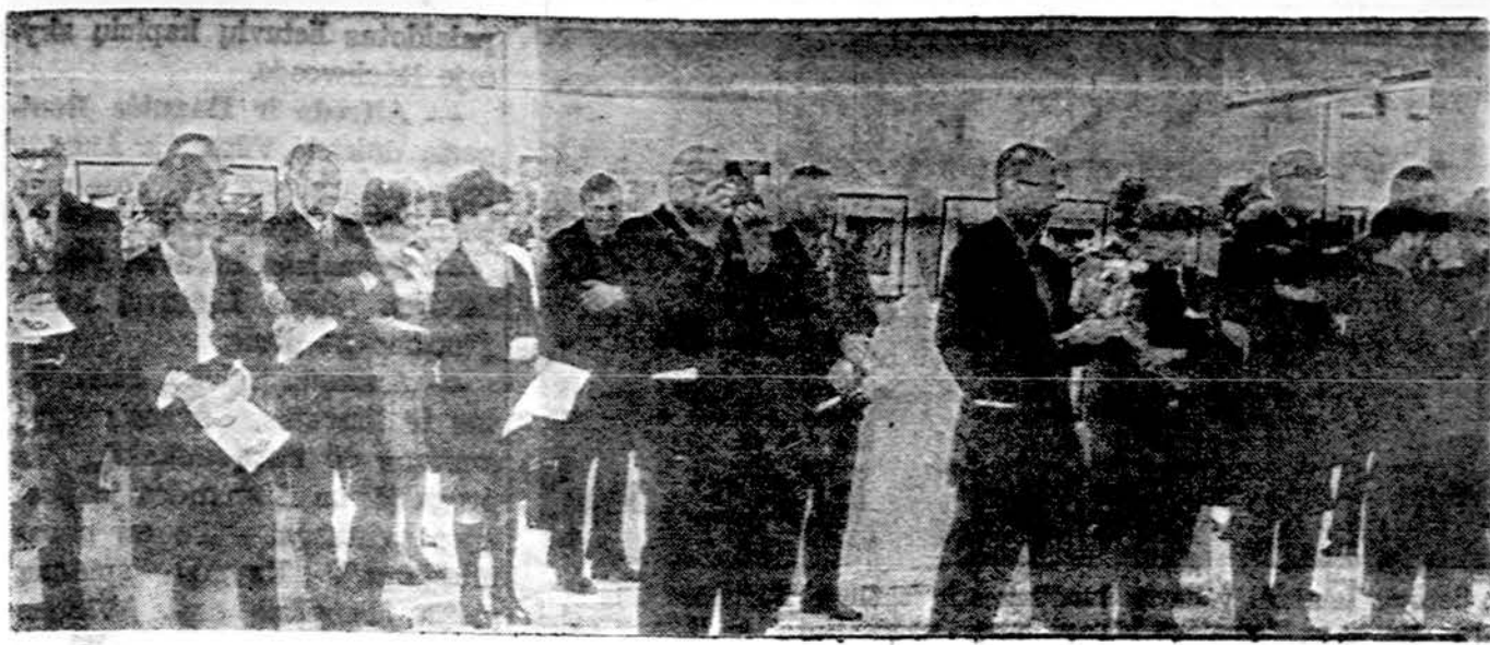
Grafikos parodoj Ciurlionio galerijoje Chicagoj.