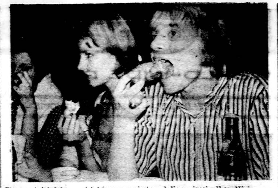
Cicero ateitininkų susirinkime: po rimtos dalies, rimti užkandžiai.