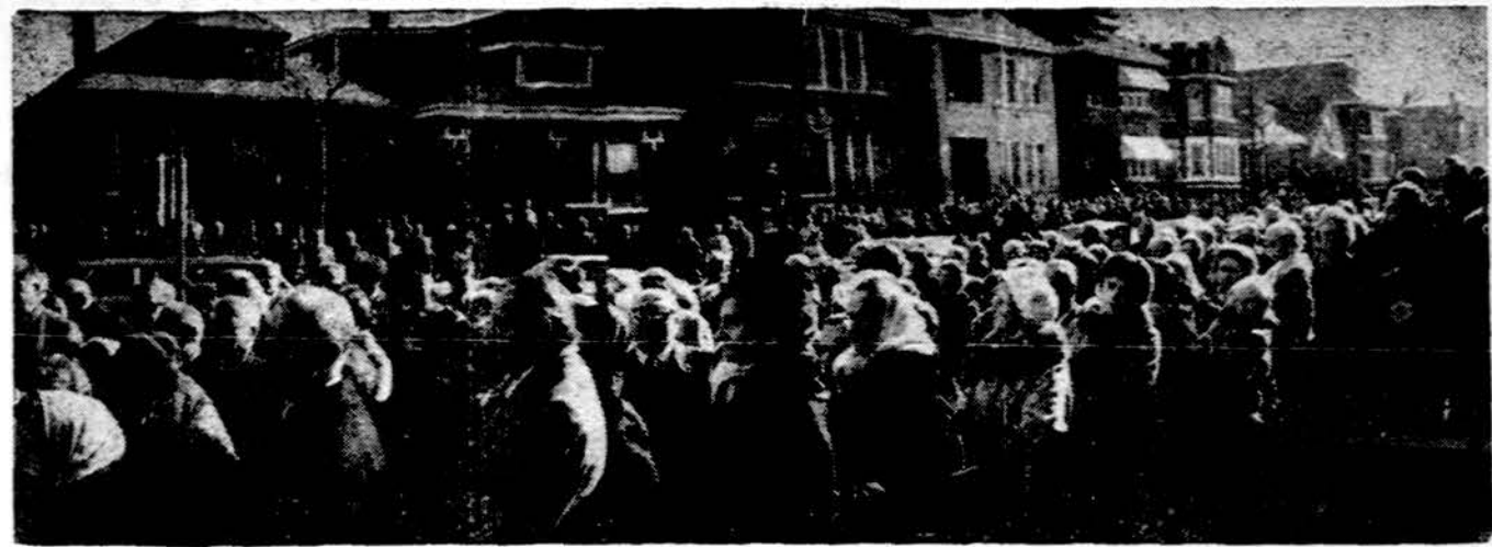
Dvitiškstantinė lietuvių minia dalyvavo lietuvių tautinės vėliavos šventinimo ir iškilimo iškilimėse prie Marquette Parko lietuvių parapijos mokyklos. Kartu su lietuviška vėliava buvo pašventinta ir iškeita nauja amerikietiška vėliava. Lietuvių vėliavai stieba pastatė ir vėliavomis pasirūpino Marquette Parko LB apylinkės valdyba.

× Pirmą sykį įvairūs lietuviškos muzikos rinkiniai - pramoginės, liaudies dainų, kaimo ir daug kitų randami 8-track stereo tape cartridges - $6.95, & cassettes - $5.95. Pildnam sąrašui rašykite Anatole Productions, Inc., 5845 So. Oakley Ave., Chicago, Illinois 60636. Tel. (312) 778-2100. (sk.)