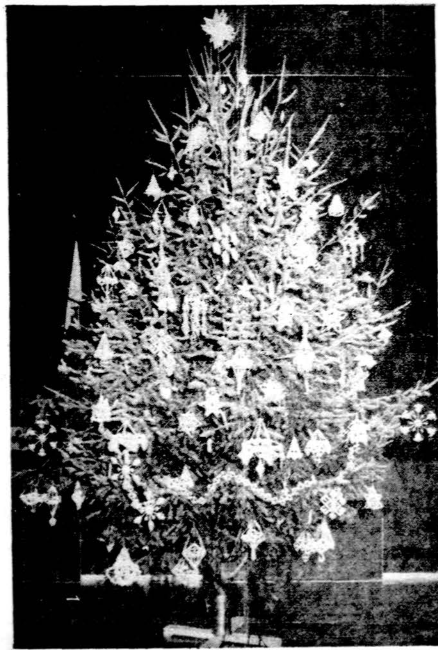
Detroito Gabijos tunto lietuviškais šiaudinukais papuošta eglutė Dievo Apvaizdos lietuvių parapijos kultūriname centre.

Savitinkai Truck Refrigeration Service Co., Inc.