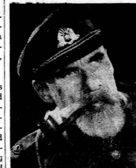
Gen. Povilas Plechavičius

Chicago. — Gruodžio 19 po ilgos ir sunkios ligos mirė generolas Povilas Plechavičius, sulaukęs 83 metų amžiaus.