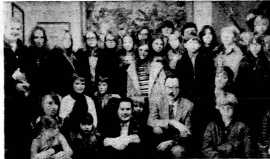
Dalis Lemonto lituanistinės mokyklos mokinių aplankę Balzeko lietuvių kultūros muziejų Chicagoje. Nuotr. Rimmo Kamanto

Kai kurie mokslininkai tvirtina, pranešdami apie tikslus mus supančio oro matmenis — penki milijonai milijardų tonų. Aplamai imant, atrodytu, kad tai daug. Bet reikalas tas, kad atmosferos sluoksnis nepaprastai plonas, lyginant su šešių tūkstančių kilometrų žemės spinduliu. Girdi, vaikams mokyklose sakome, kad jeigu žemė — apelsinas, tai oras — plonytis popirosinis popierius, kurį tas apelsinas suvyniotas. Ir tą plonytį popierių mes nuolat plėšome. jm