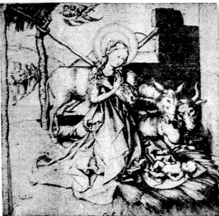
KRISTAUS UŽGIMIMAS. Martin Schongauerio (15 amž.) raižinys