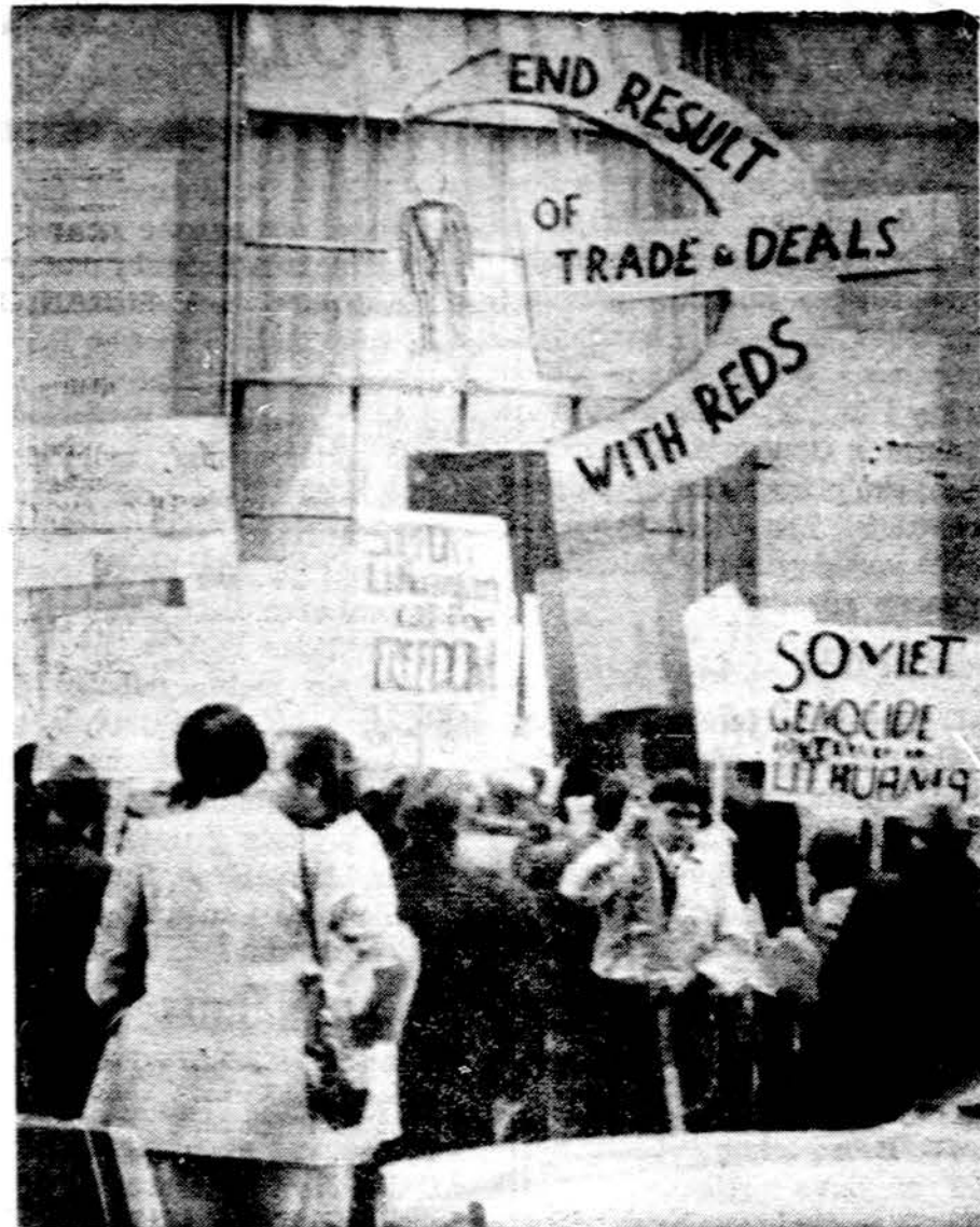
Iš demonstracijų Chicagoje prie Can bendrovės.