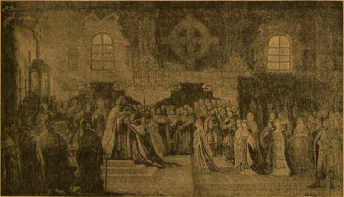
Adomas Varnas Karaliaus Mindaugo vainikavimas