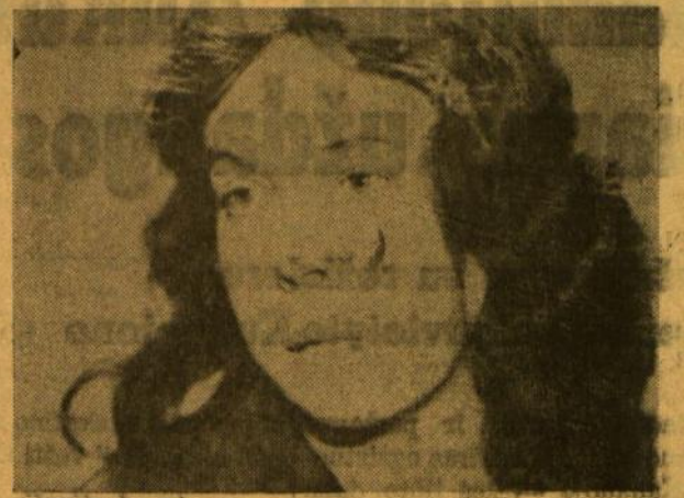
Janina Degutyte (gim. 1928) viena ryškiausių okupuoto Lietuvos poečių. Šį kartą čia dėmesį skiriame naujausiam jos eilėraščių rinkiniui „Prieblandų sodai“.

Ir nutilo žemė ir dangus, Ir akimirksniu sustojo debesys — Suskambėjo linksmos lerištinės fleitos. Nuo stogu, nuo medžių ir nuo kryžių Sušūrleno, sukrykštė auksinis ledas, Duždamas į aidus ir džiaugsmus, Tapdamas kriokliu, šviesa ir fleitom.