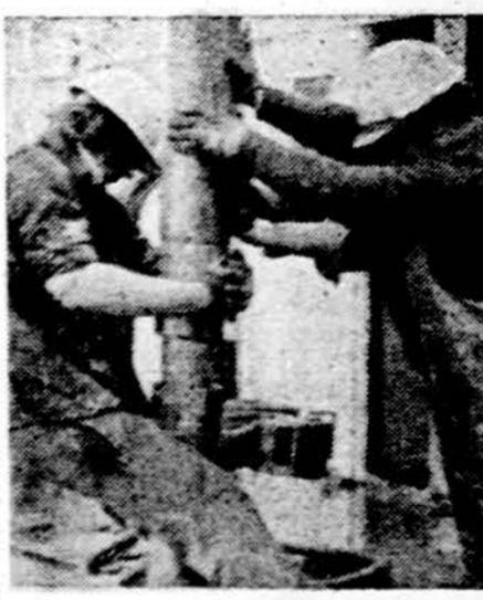
Naftos ieškojimas šiaurės jūroje

WASHINGTONAS. — Amerikos gyventojų surašymo biuras pateikė skaičių, kuriuos mažai kas tiki. Oficialiai pranešama, kad Naujųjų Metų pradžioje, vidurnaktį, Amerikoje buvo 213,203,059 gyventojai. Kad čia gyvena nuo 5 iki 10 milijonų nelegalių emigrantų, ir jų skaičius niekas tikrai nežino, Biuras nieko nesako.