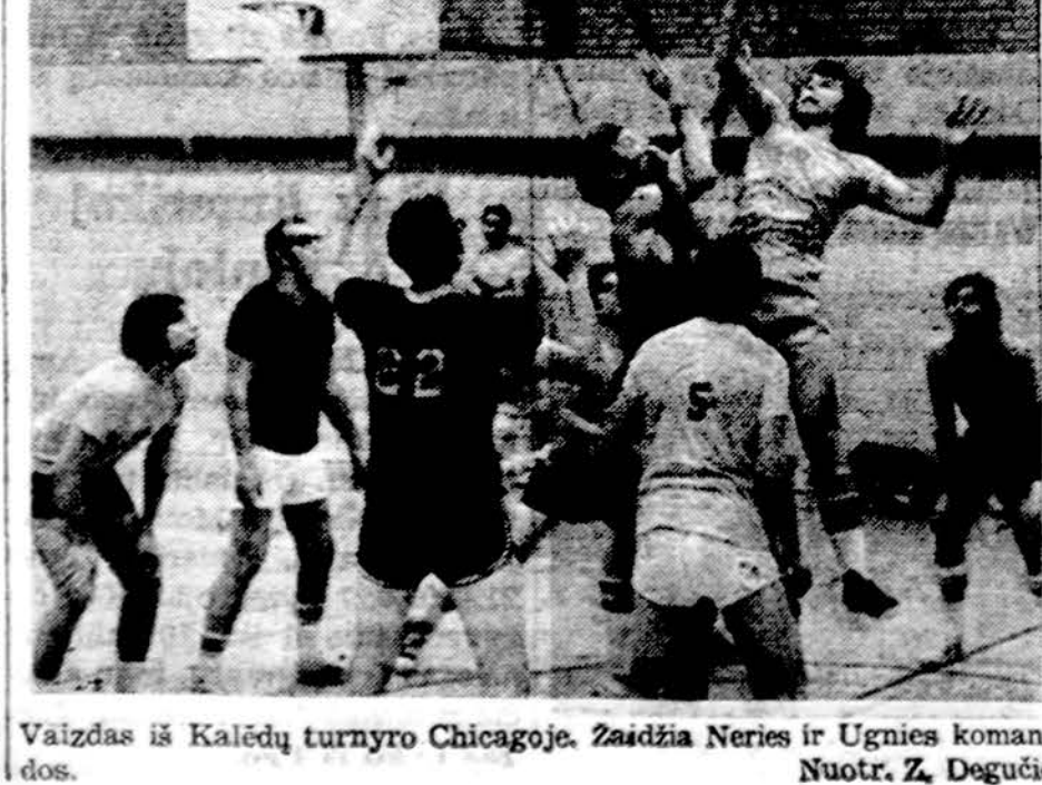
Vaidžias iš Kalėdų turnyro Chicagoje. Žaidžia Neris ir Ugnies komandos.

Geriausias aikštėje buvo Stankūničius 25, kuris dominavo abi lentas ir pasakiškai šaudė. Jesevičius taip pat šlavė lentas, o iš 17 taškų, kaikiuriais jis pats netikėjo, Varnas 10, vis dar retais a-