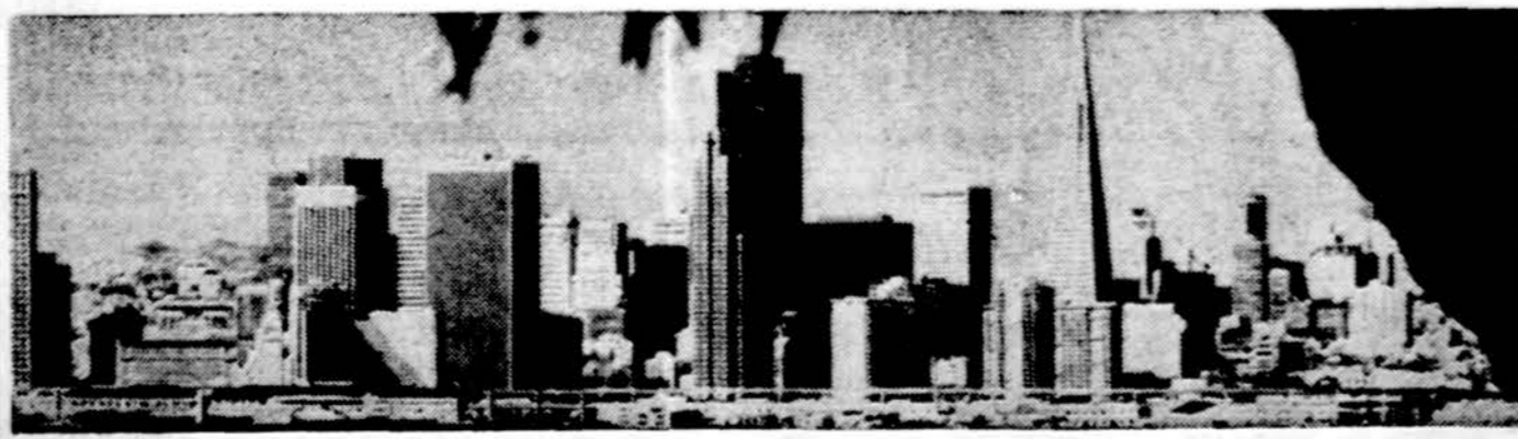
San Francisco miesto panorama

Daugiausia apsiniaukę, 60% galimybė lietaus su sniegu, apie 30 laipsnių.