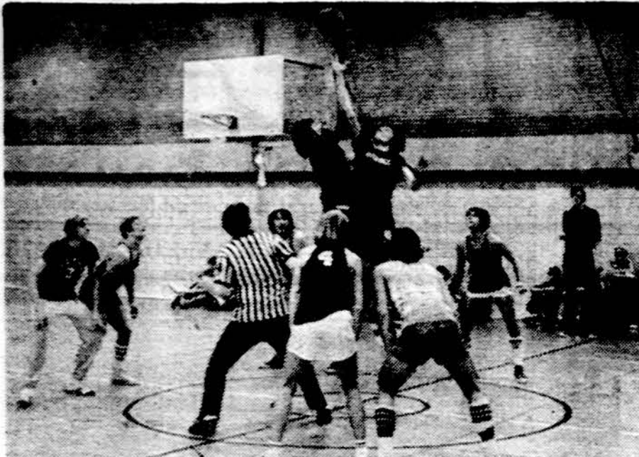
Jaunių baigmės pradžia kalėdiname turnyre Chicagoje.

— Pasaulio čempionas R. Fischer atsisakė savo titulo, protestuodamas prieš FIDEs priimtas taisykles kovai dėl titulo, vienok FIDE to atsisakymo dar nepriėmė, siūlydamas jam geriau susipažinti su priimtoju reglamentu ir pakeisti savo nusistatymą. Vienok pabrėžė, jei Fiferis nestotų į dvikovą prieš pretendentų nugalėtoją Anatolijų Karpovą, tai pasaulio čempiono titulas būtų suteiktas Kampovui. Dabar aiškėja,