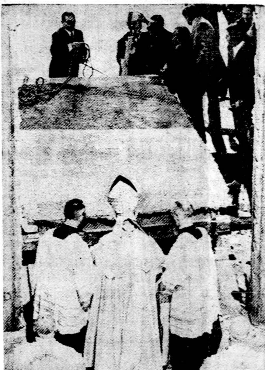
Šventųjų Metų pradžia. Pautas VI sidabrinu plaktuku stuktėlėjo šv. Petro bazilikos šventąsias Duris, o darbininkai jas iškėlė

VENECIJA. — Venecijos miesto valdyba numatė 32.5 mil. dolerių paskirti miesto istorinių namų ir paminklų restauracijai. Gal tai prisidės ir prie sulaukymo gyventojų bėgimo iš Venecijos. Per paskutiniuosius 20 metų išsikraustė 60,000 gyventojų.