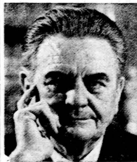
Teisėjas John Sirica