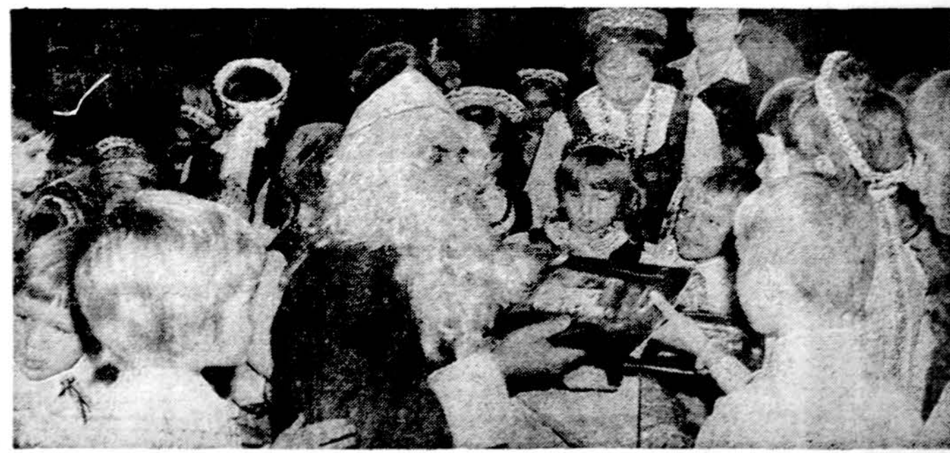
Kalėdų senelis Marquette Parko lietuvių parap. lituanistinės mokyklos eglutėje.

Chicagoje 1974 m. nužudyti 968 žmonės, o Naujų Metų dieną nužudyti dar 4 žmonės.