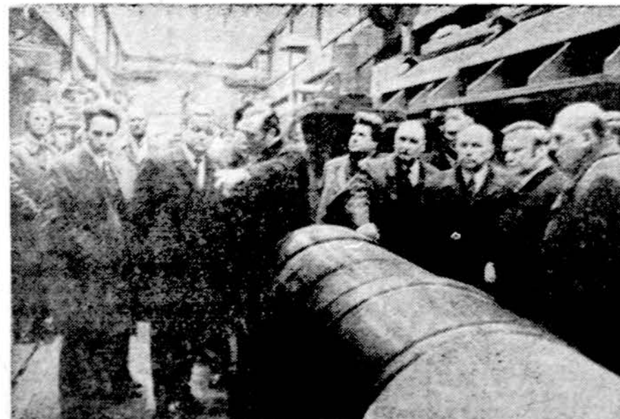
Sovietai daug kalba, kad pas juos visko yra ir jie viską gali patys pagaminti, bet be Vakarų pagalbos neišsiverčia. Nuotrukoje sovietų delegacija Muelheimo mieste, Vakarų Vokietijoj, gėrisi vokiečių gaminiams ir nori jų pirkti

MASKVA. — Šeštadienio "Pravda" visą puslapij paskyrė penkmečio plano paskutiniųjų, 1975, metų įvykdymui. Paskelbė partijos šūki: "Daugiau produktų, geresnė kokybė, mažesnė kaina". Pasigyrė, kad pas juos, priešingai, negu kapitalistiniame pasauly, nėra nei krizės, nei bedarbių, nei infliacijos, bet nepasakė, kad be keikiamų kapitalistų neturėtų nei duonos, nei aukštos kokybės prekių, nei mašinių.