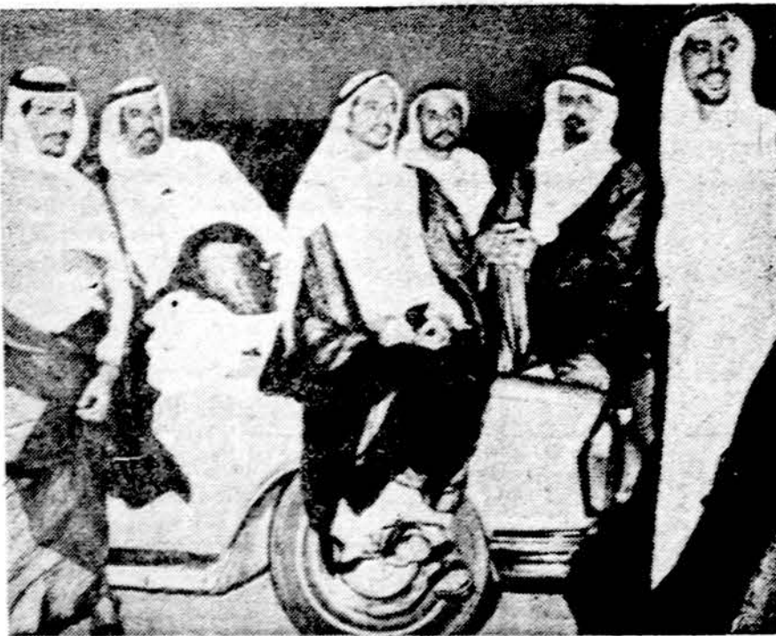
Arabų šeichai suka galvas, kaip geriau galėtų investuoti savo milijonus kas pajamas. Apsisprendė, kad esą geriausiai pirkti automobilių gamybos bendrovių akcijas.

WASHINGTONAS. — Nesiliaujant su kaltinimais, kad CIA ilgą laiką sekė tam tikrą skaičių įtartinų asmenų ar organizacijų pačioj Amerikoje, prezidentas Fordas nutaręs sudaryti atitinkamą komisiją, kuri ištirtų, kiek tuose teigimuose yra tiesos.