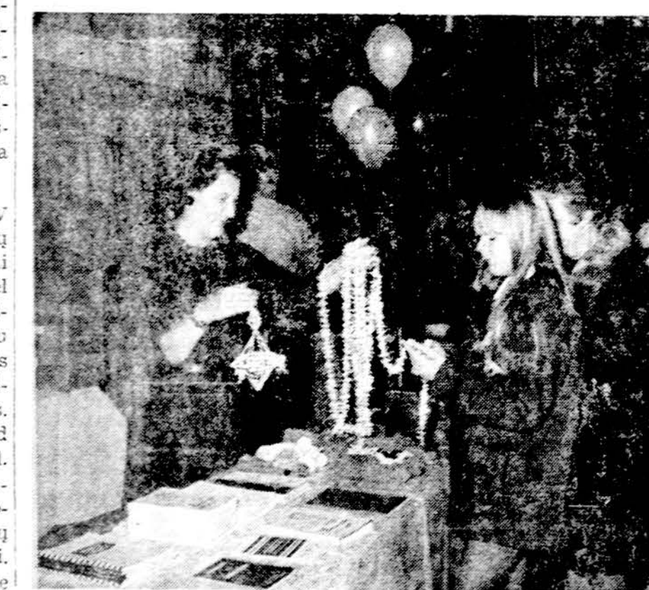
"Grandies" globos komitetas rūpinasi tešų sutelkimu, kad lietuviškas jaunimas galėtų reprezentuoti mūsų tautinį meną.

zinoma, tokia Prancūzija, kuri auksu kaupimu susirūpino tuoj po karo, kai jo uncijos kaina tebuvo 35 dol., nėra pralaimėtoja (tokia kaina tas auksas daugiausia ir be jokio tikro reikalo atėjo iš JAV), bet tikrai pelnė. Jei mokoje dvigubai daugiau, tai tuomet ir ji nepelnė. Pavyzdžiui, investuoti 10.000 dol. į 8 proc. laktūras ar akcijas, palūkanas ar padalą, vis iš naujo perinvestuojant, per 10 metų duoda 11.589 dol. pelno arba 10.000 suma išvirsta 21.589 dol., o per 20 metų — 46.609 dol. O šiandien ir geros akcijos ir geri laktūrai neša ir daugiau metidar pelno.