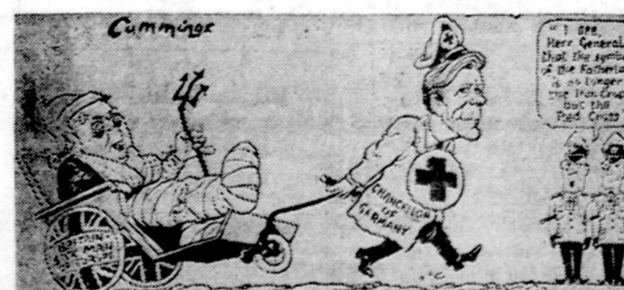
"Aš matau, pone generale, kad mūsų valstybės simbolis pasikeitė. Vietoj geležinio kryžiaus pavirto Raudonojo kryžium". (Londono "Daily Express")

Viena. — Austrijos sostinėje įregistruota 54,000 šunų. Vienas šuo tenka 29 vieniečiams.