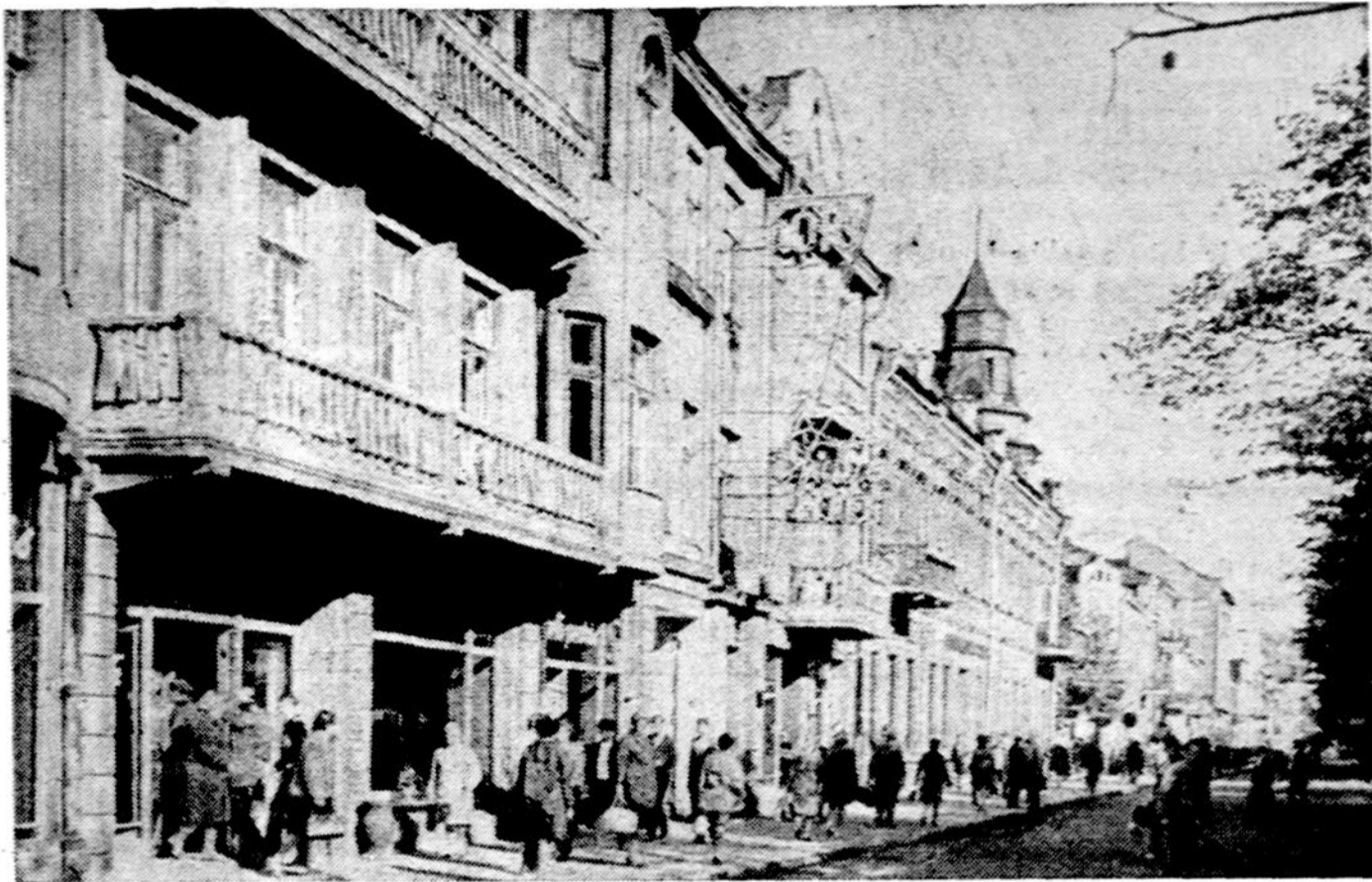
Kaunas šiandien. Laisvės alėja. Apsilankę Lietuvoje pasakoja, kad miesto namai po karo dar neremontuoti

Kokių nuolaidų jis padarys už tuos pasitraukimus? Pirmiausia pažada, kad pirmas karo neprašės. Egipto karo ministerija jau pranešė ir apie kariuomenės skaičiaus mažinimą — pašauktiesiems į kariuomenę tam tikruose daliniuose tarnauti bereikės 18 mėnesių, kai reikėjo anksčiau 24.