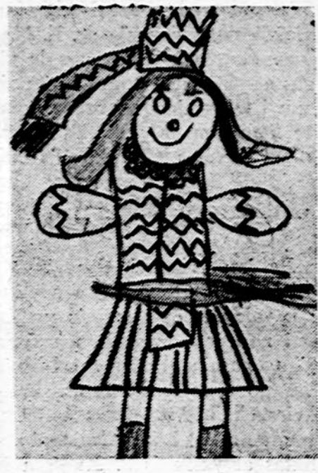
Lietuvaitė. Piešė Kristina Brazdžiūnaitė, Dariaus Girėno lit. m-los II sk. mokinė.