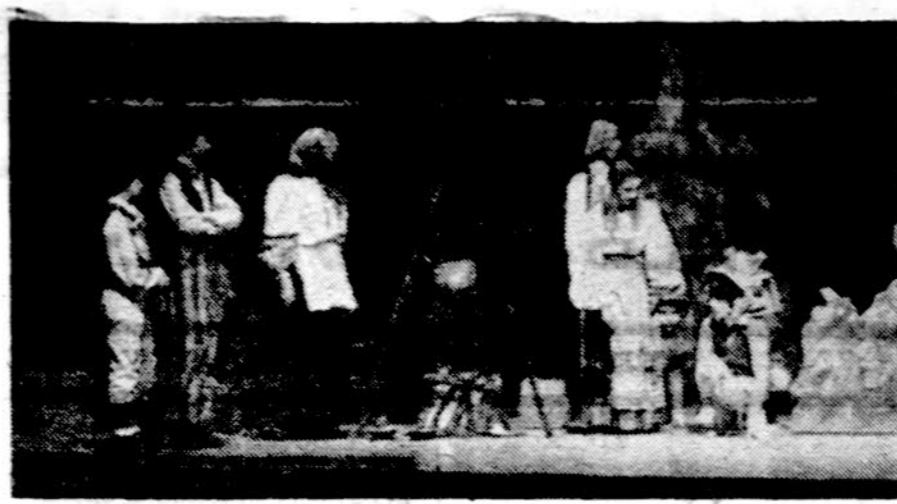
Seena iš Chicago skautų-čių ansamblio pastatymo "Dvylika brolių juodvarniais ląksčius".