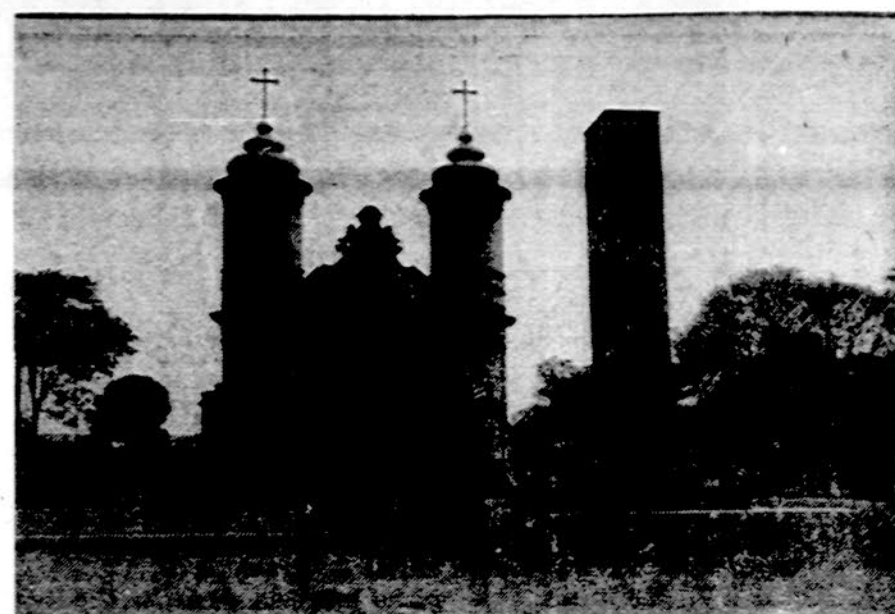
Šioje Tamoio cukraus dvaro bažnyčioje daugelį metų meldavosi ir sunkiai bei sąžiningai dirbą lietuvi. Prieš bažnyčią paminklas tarnautojų vaizduoja įvairius darbus cukrinių nendrių plantacijoje.