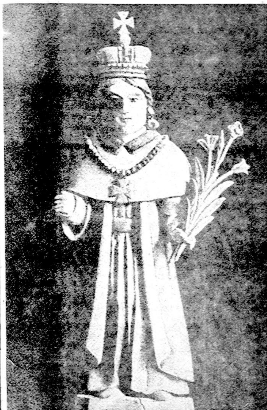
Šventasis Kazimieras. Nežinomo lietuvių liaudies menininko darbas

PHNOM PENH. — "Jų galvos stiprios, bet širdys suminkštėjo", — pasakė Um Sim, Kambodijos ambasadorius Amerikai po to, kai šeši iš aštuonių Kongreso narių šešias valandas praleido apsuptoji Kambodijos sostinėje. Tik McCloskey ir Abzug sakė, jog jie balsuos už ekonominę pagalbą Kambodijai, bet priešinsis karinei pagalbai. Delegacija buvo pafrontė, kalbėjosi su fronto vadais. Jiems buvo surengti priešpriešai, dalyvavo min. pirm. Long Boret. Nebuvo tik prezidento Lon Nol. Buvo liudininkais, kai komunistų raketos sprogo vos keli blokai nuo jų. Turėjo progos susitikti ir su komunistų Khmer Rouge belaisviais.