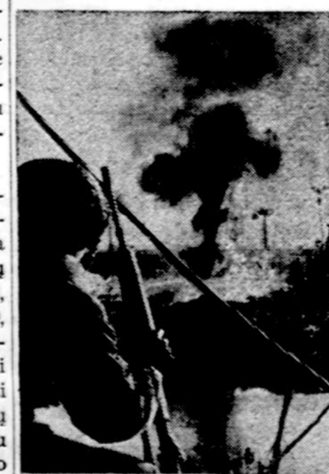
Nuolatinis vaizdas Pietų Vietnamo komunistų raketos sproginas

WASHINGTONAS. — Prezidento Fordo politiniai patarėjai skundžiasi, kad jo ekonomistai blogai pramato ekonominius pasikeitimus, neįvertina esamos recesijos, paliko jį, prezidentą, nepasiruošusį politiniam sprendimui. Jeigu ekonomija ir toliau teiks tik blogas žinias, reikia, kad prezidentas būtų iš anksto įspėtas.