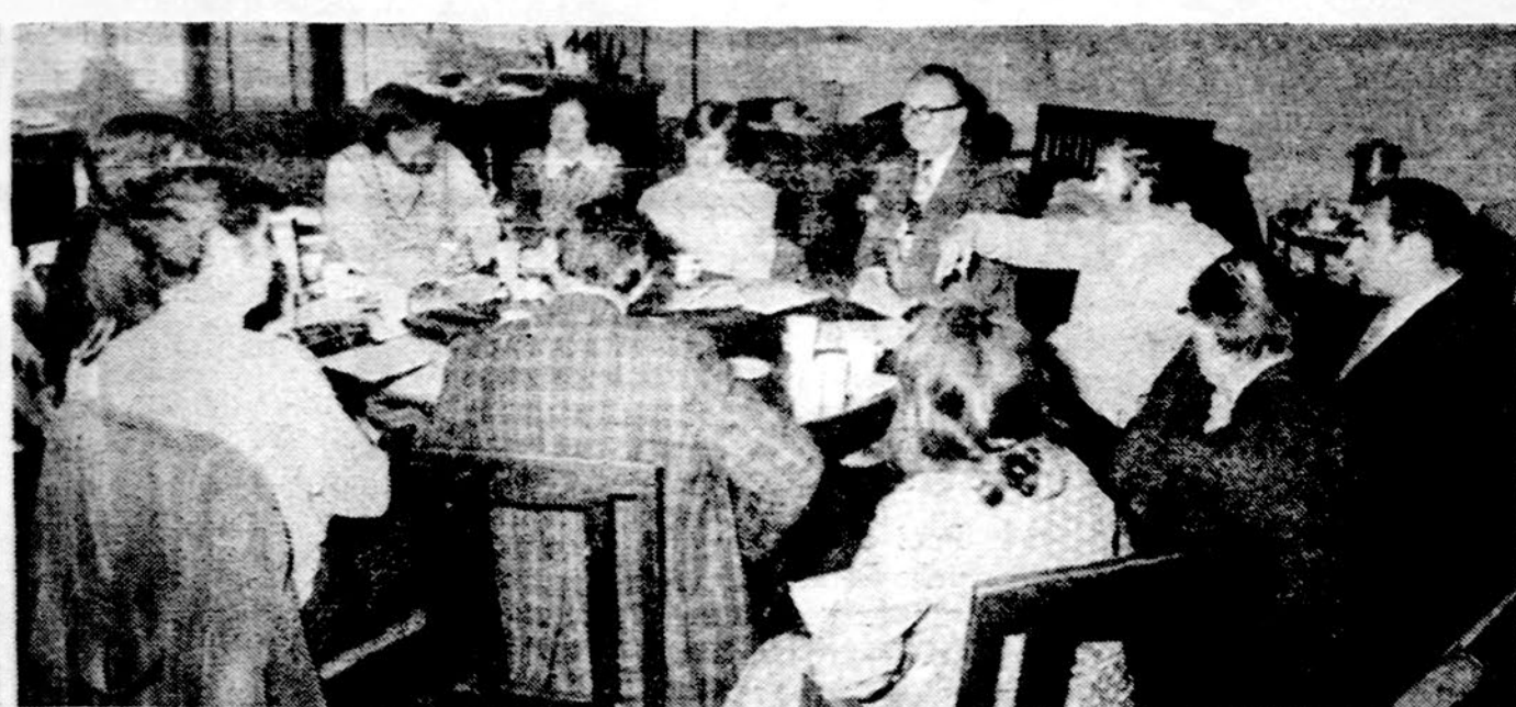
Pasitarimas Liet. jaunimo kongreso reikalais Chicagoje, kur buvo suvažiavę įvairūs Lietuvių Bendruomenės pareigūnai.

Taigi atrodo, kad tuose pasitarimuose nebuvo spręstas ar net svarstytas svarbus vyskupijoms vyskupų paskyrimas. Bet susitarti nebus lengva nė ateityje. Valdžia nori, kad vys-