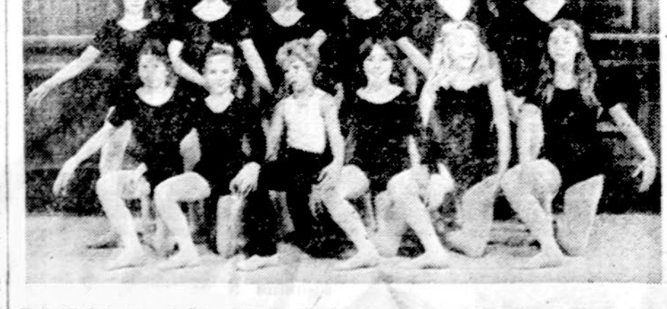
Civic Balo grupė, kovo 23 d. atliekanti programą Southern Ill. universitete