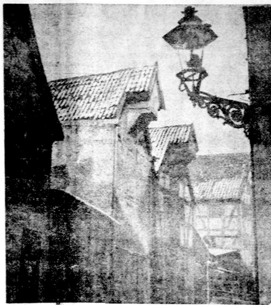
Karaliaučiaus kampelis — senieji sandėliai (Prieškarinė nuotrauka)

LONDONAS. — Ministeris pirmininkas Harold Wilsonas ir jo vyriausybė britams rekomenduoja balsuoti už pasilikimą Bendoroj rinkoj. Referendumas pažadėtas birželio mėnesį.