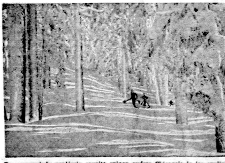
Po pavasarinės praėjusią savaitę sniego audros Chicagoje ir jos apylinkėse pasiekė rekordą — 68 F.

Kas paskatino platesniu mastu pergildinti ginkluoto sovietams pasipriešinimo laikus? Studijoje spėjama, kad priežastys galėtų būti tokios: pagyvėjęs jaunimo tarpe patriotinis judėjimas (gam totyros būreliai ir pan.), prieš kurį sovietinė spauda ir prieš tai pradėjo kovą, be to, yra dar nemaža partizanų kovų siaubingo laikotarpio vidurinės ir senesnės kovos liudytojų, kuriuos norima išpėti. Režimo šalininkams tai yra paraginimas kovoti su "liaudies priešais", kurių žiaurumai dabar išskeliami: vien Skuodo rajone esą žuvę per 4000 nuo partizanų ("Valst. Laikr." 1975.1.26). (E.)