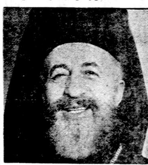
Kipro prezidentas ark. Makarios