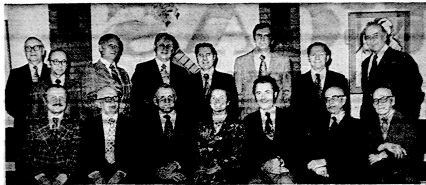
Lietuvių fondo taryba ir valdyba Jaunimo centre, Chicagoje, po posėdžio, nutarus surošti milijono užbaigimo šven- tų-pokylį. Pokylis bus bal. 12 d. Martiniuko svetainėje, Chicagoje. Visi kviečiami dalyvauti, nes pokylyje dalyvaus svečiai iš Floridos ir kitų tolimųjų vietovių.

— Dekoju jums, p. Reklaiti, už plačias informacijas. Jums sek- mės.