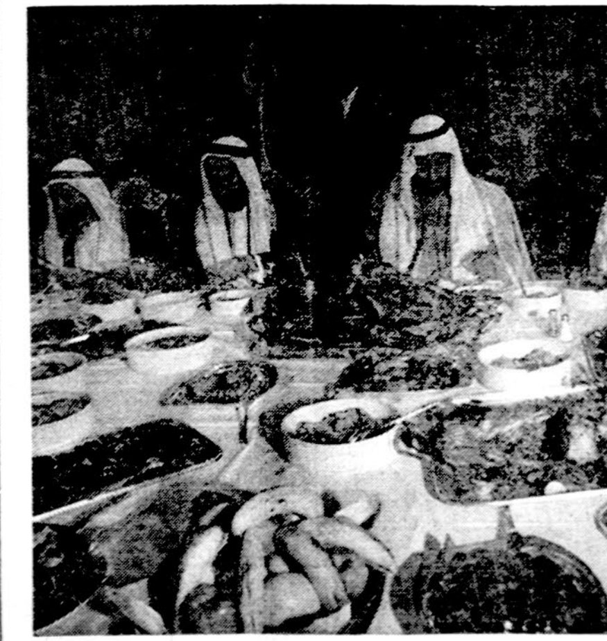
Ant arabų stalo. Jungtinio Arabų Emirato didikai pietauja. Ar jie prisimena benamus ir alkstančius savo brolius palestiniečius, tai kitas reikalas

Dalinai apsniaukę, šilčiau, apie 45 laipsniai.