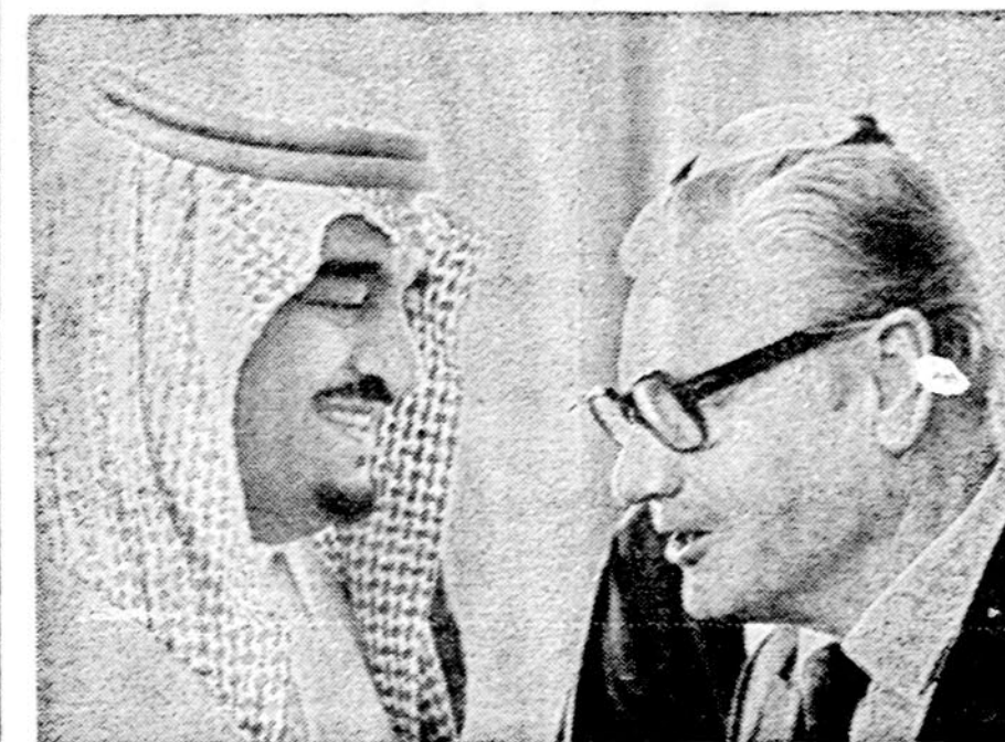
Kai viceprezidentas Nelson Rockefelleris dalyvavo karaliaus Faisalo laidotuvėse, susitiko su princu Fahd, Saudi Arabijos sosto įpėdiniu.

Brežnevo vizitas į Amerika, numatytas birželio mėnesį, greičiausiai, bus nukeltas į rugsėjo mėnesį. Kremlius pirmą nori sukviesti 35 kraštų, dalyvaujančių Europos Saugumo ir bendradarbiavimo konferencijoje, viršūnių susitikimą ir ratifikavimą geografinių pasikeitimų po II pasaulinio karo.