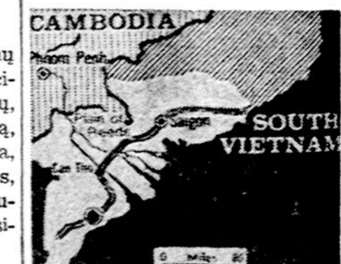
Tiek iš Pietų Vietnamo liko neužimta. Saigonas valdo tik kur baltai pažymėta.

SAIGONAS. — Komunistai buvo perkirtę plentą Nr. 4, einantį iš sostinės į Mekongo deltą, bet vyriausybės daliniai kelią nuo priešo vėl išvalė. Tuo keliu vyksta Saigono aprūpinimas ryžiais.