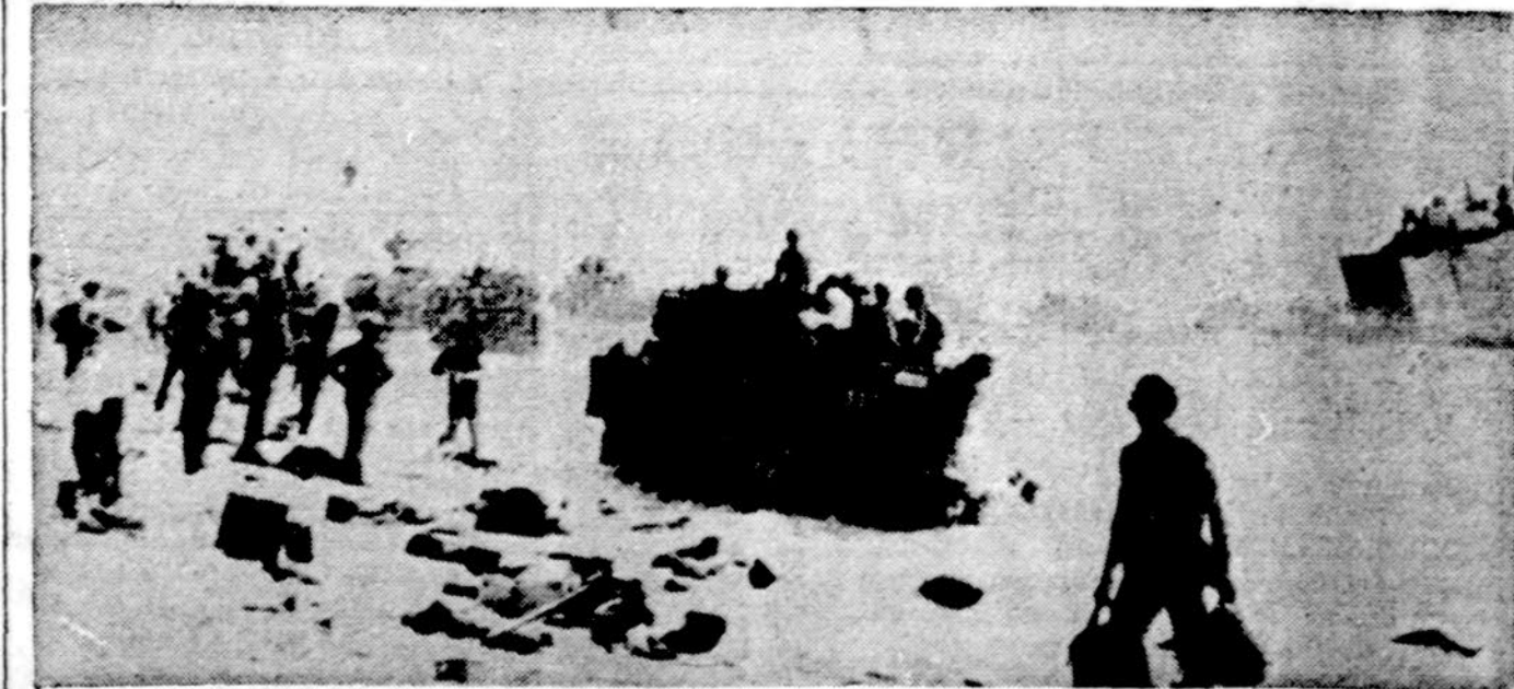
Pietų Vietnamo daliniai traukia iš apsupimo, sėdė į laivus

Saulė teka 6:13, leidžias 7:30. ORAS Daugiausia apsiniaukę, iš ryto galimas lietus, apie 55 laipsniai.